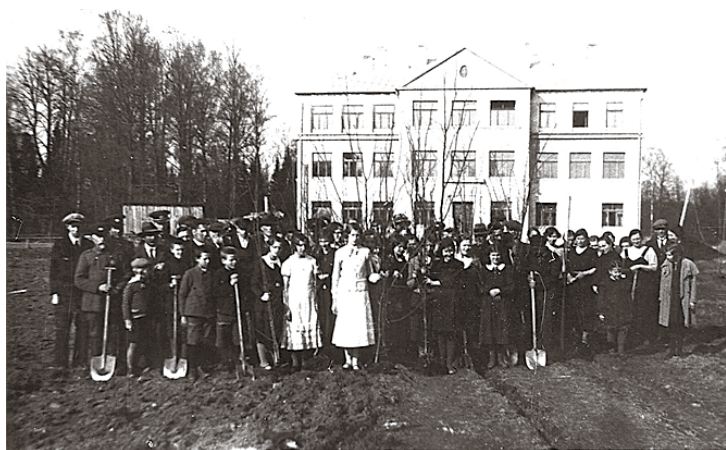
Pirms alejas stādīšanas – 1935. vai 1936. gads.

1958. gadā brīvajā laukumā, kur trūcīgajos pēckara gados bija