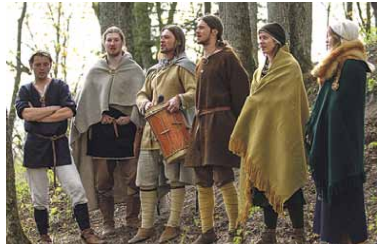
Folkloras kopas „Trejasmens” koncerts.