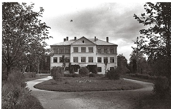
Pretī skolas ieejas durvīm 3 liepiņas apcirptas, kā to bija plānojis Miķelsons. Jau 14 gadu augušas.

skolotāju sakņu dārzi, ierīkoja sporta laukumu. Futbola laukuma galā bija arī augstlēkšanas un tāllēkšanas sektori. Laukumu pilnībā sakopa skolēni un fizikultūras skolotājs. (Šodien izskan doma par to, ka vajadzētu ieviest trešo fizikultūras stundu nedēļā. Vai nebūtu labāk ieviest vienu fiziskā darba stundu, vismaz skrejceļiņu izravētu.)