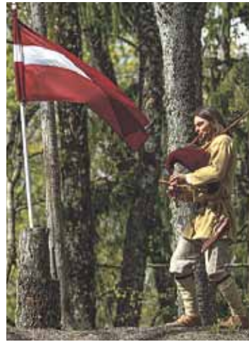
Ieskandinam „Ropažiem 810”.