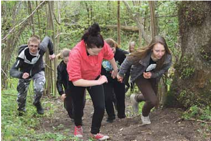
Skolēnu intelektuāli aktīvā spēle.