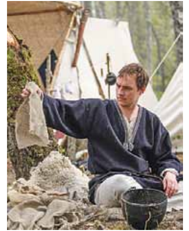
„Rodenpoys” Armands taisa lāpas.