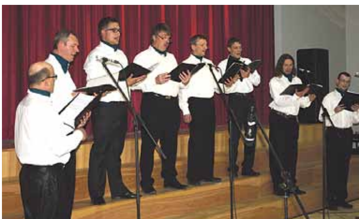
Neatkarīgais vīru vokālais ansamblis.