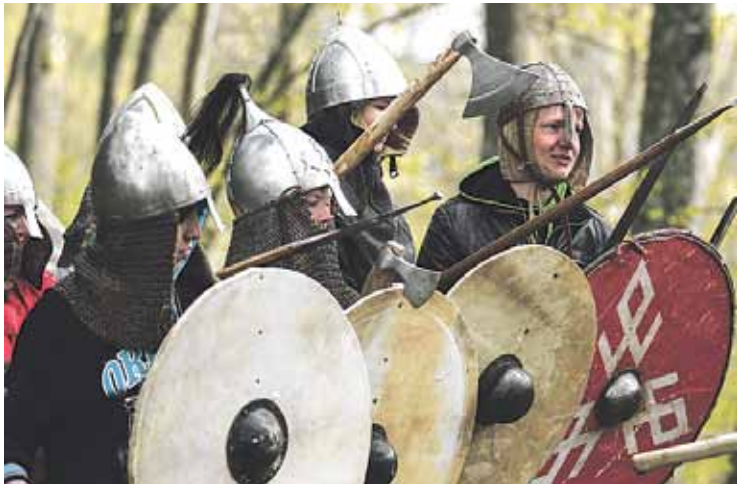
Kaujas ierindas apmācības skolēniem.