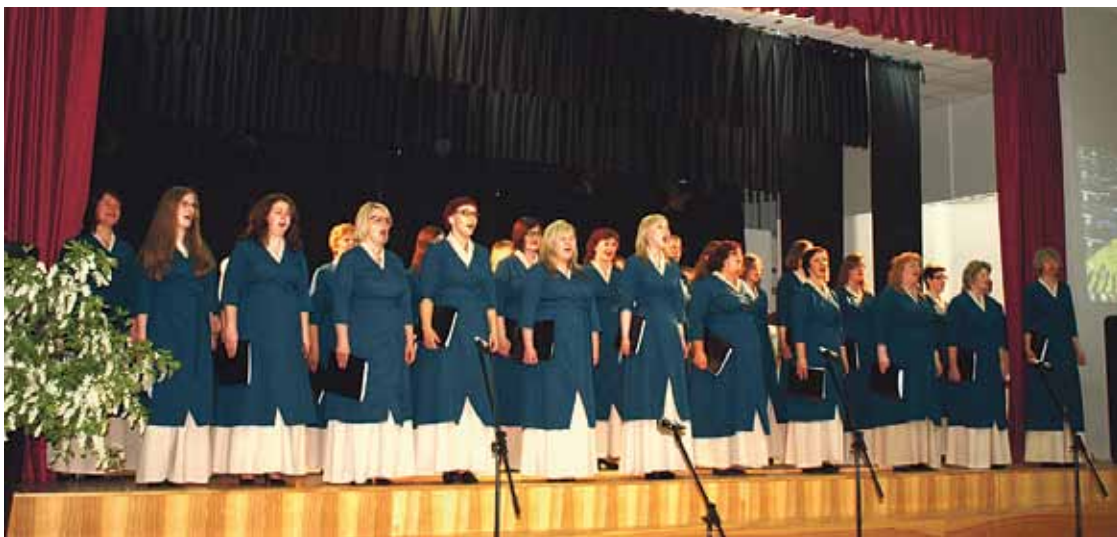
„Dziesma, ar ko tu sācies” kora „Ropaži” izpildījumā.