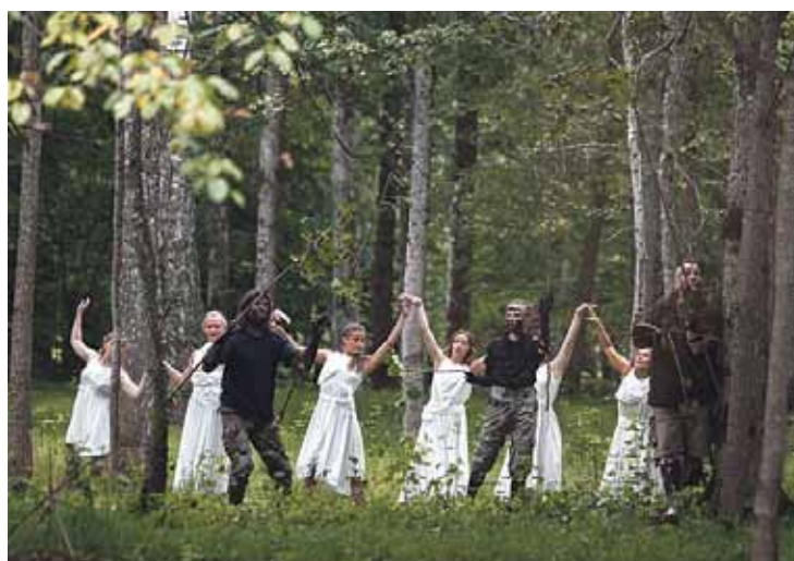
„Piesiets šai apaļajai pasaulei”.