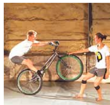
Lilijas Liporas izrāde „Abi”.