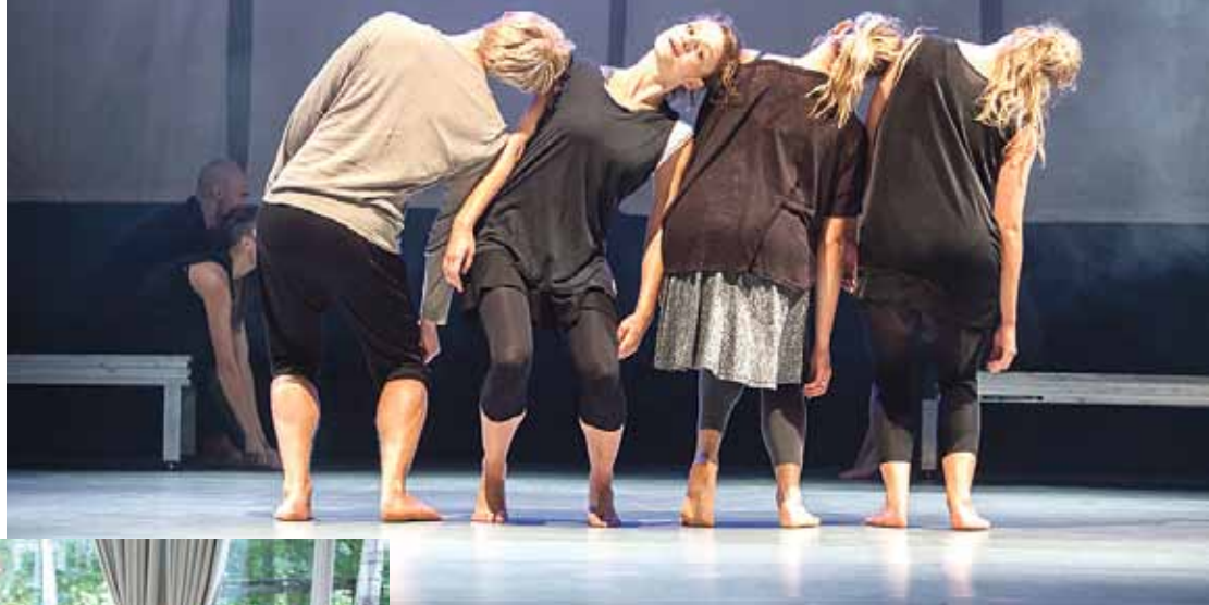
Gabijas Biriņas izrāde „Pus vēji”.