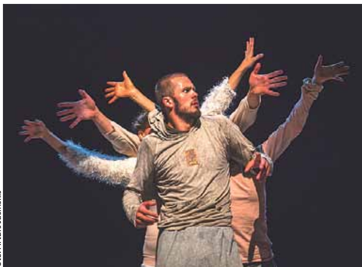
Čehu izrāde „Rider”.