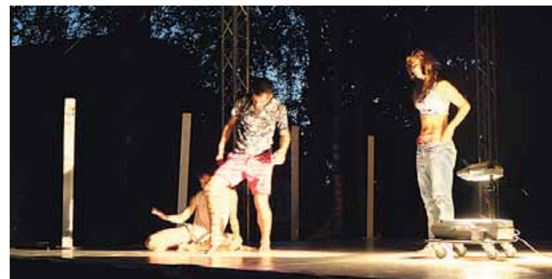
Slovāku dejas izrāde „BAKKHEIA – dancing on the edge”