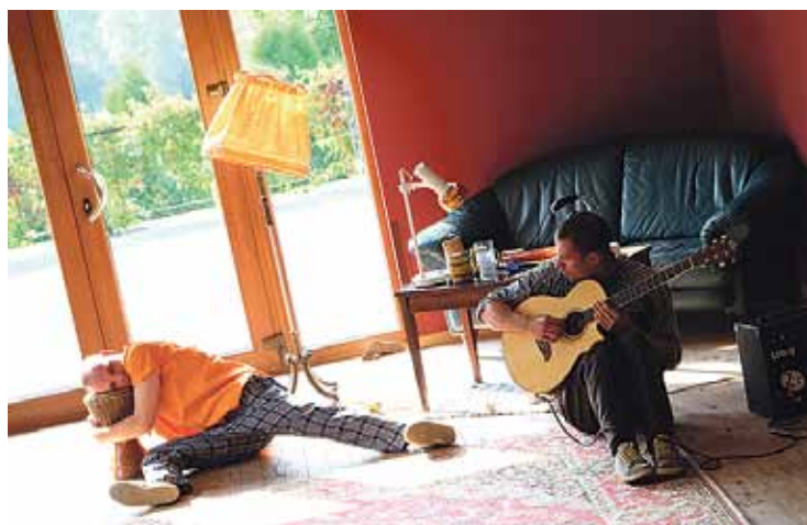
Izrāde „Bez vadiem”