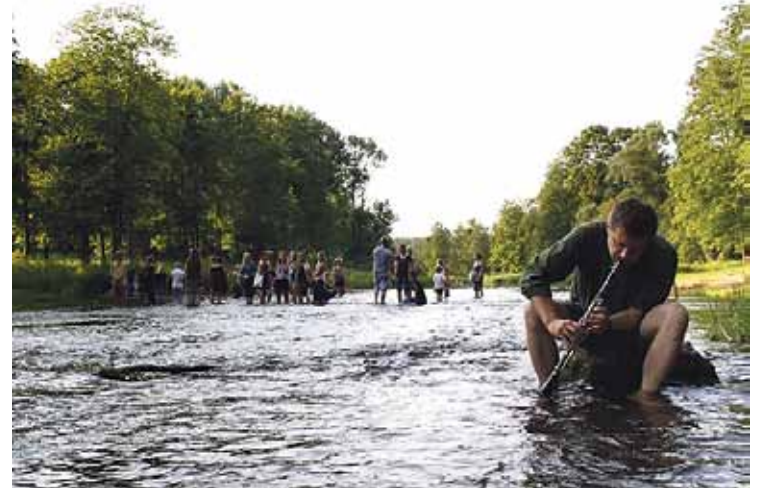
K. Santa performance „Tekme”