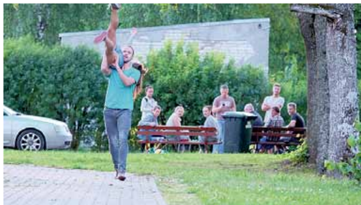
Izrāde „Ar putniem”