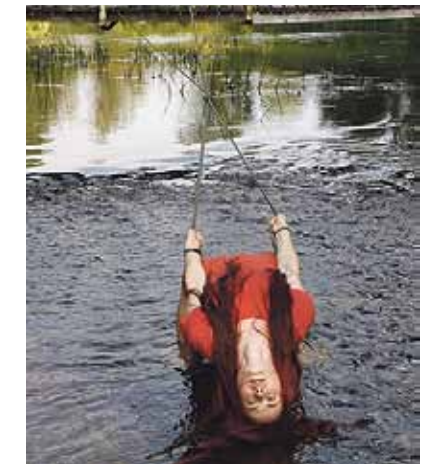
K. Santa performance „Tekme”