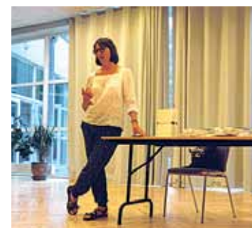
Grāmatas „Expeditions in Dance Writing. Writing Movement 2012–2014” prezentācija