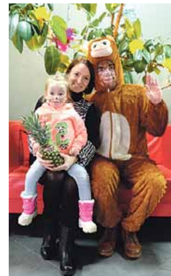
Ugunīgais Pērtiķis ar draugiem

Ugunīgais Pērtiķis bērniem bija sagatavojis veselīgu un garšīgu dāvanu – ananasus no tropiskajiem džungļiem