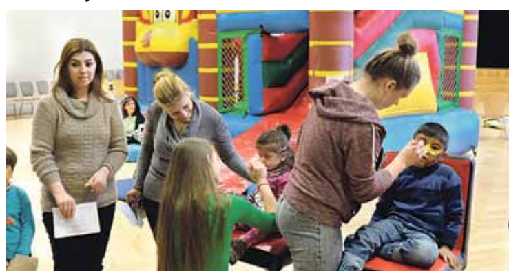
Darbnīcā „Pucēšanās” bērniem bija iespēja kļūt par dažādiem tēliem