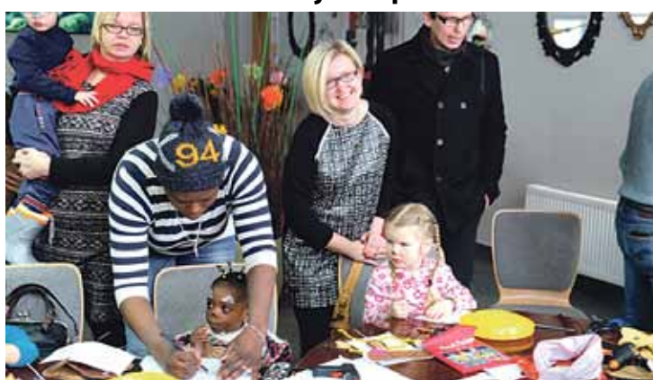
Patvēruma meklētāju centrs „Mucenieki” mazie iemītnieki ar saviem tuviniekiem