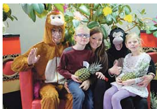
Laimīgi un smaidīgi: pabijuši visās radošajās darbnīcās un izpriecājušies no visas sirds