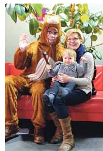
Ugunīgais Pērtiķis visus laipni aicināja nofotografēties savā džungļu filiālē