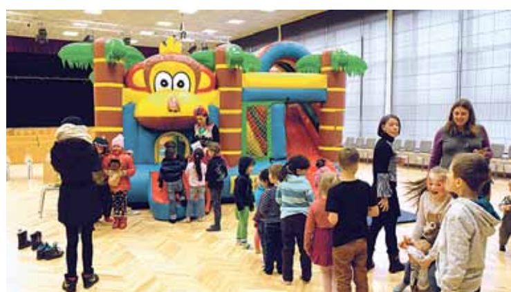
Ugunīgais Pērtiķis bija atvedis atrakcijas, kur varēja izlēkāties un iztraktoties kā īstos džungļos: lēkāt pa liānām un šļūkt no ūdenskrituma