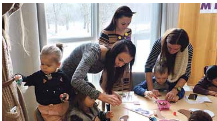
Veidojot dažādus un jaukus radošos rokdarbus