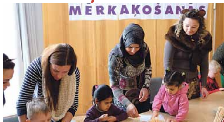
Bērni ar vecākiem darbojas radošajā darbnīcā „Mērkaķošanās”