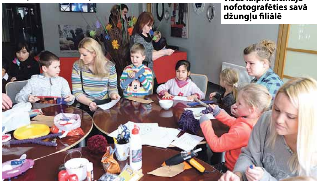
Bērni ar vecākiem darbojas Ropazu vidusskolas darbnīcā