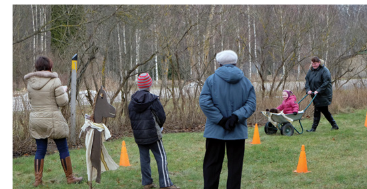
Metēņu svētku dalībnieki sacentās dažādās stafetēs – ragavu vilkšanas vietā šoreiz stafetē nācās izmantot ķerru