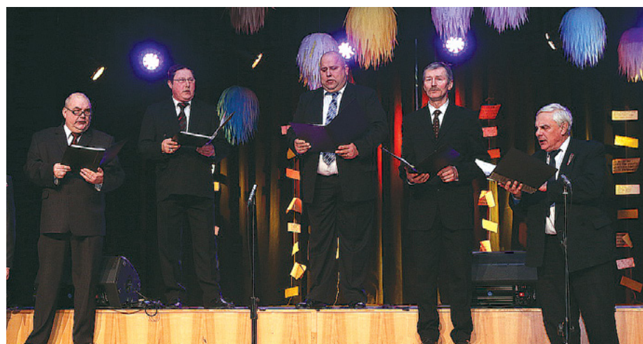
Dzied kora „Ozolzīle” vīri