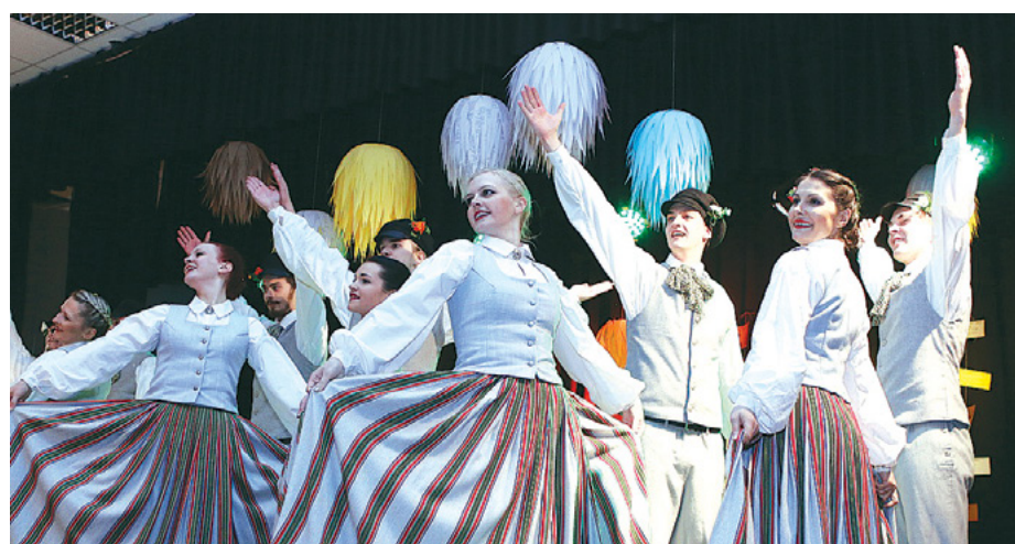
Deju kolektīvs „Cielava”