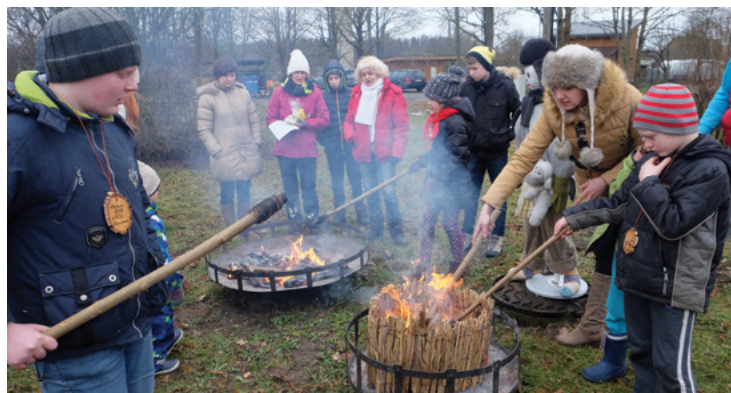
Lai turpmākais gads būtu veiksmīgs, sliktās domas tika sasietas salmu buntītēs un tad kopīgā uguns rituālā sadedzinātas