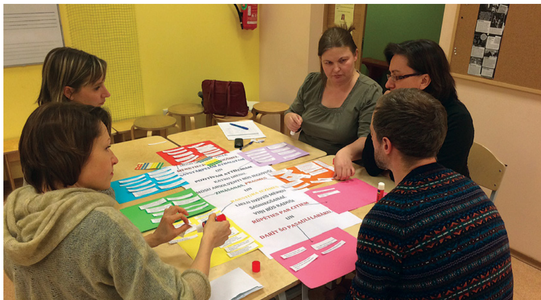
Zaķumuižas pamatskolas skolas padomes vecāki

1. Bērna milzīgais prieks, dodoties uz skolu. Ir prieks vērot, kā meita ar interesi apgūst visu jauno, meklē papildu materiālus mājas uzdevumiem un ar kādu nevilnotu prieku rāda no skolotājas saņemto vērtību uzlīmi.