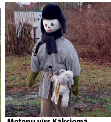
Metēņu virs Kākcimā sagaidīja ikvienu svētku dalībnieku