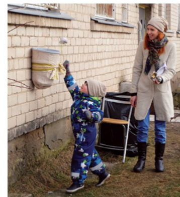
Sniega piku vietā pikošanās notika ar bumbām, kas izgatavotas no avīzēm