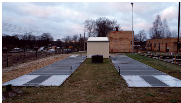
No jauna izveidotā kanalizācijas ūdeņu attīrīšanas sistēma Zaķumuižā

Iepriekš apstiprinātie ūdensapgādes un kanalizācijas tarifi bijuši spēkā kopš 2008. gada, un pa šo