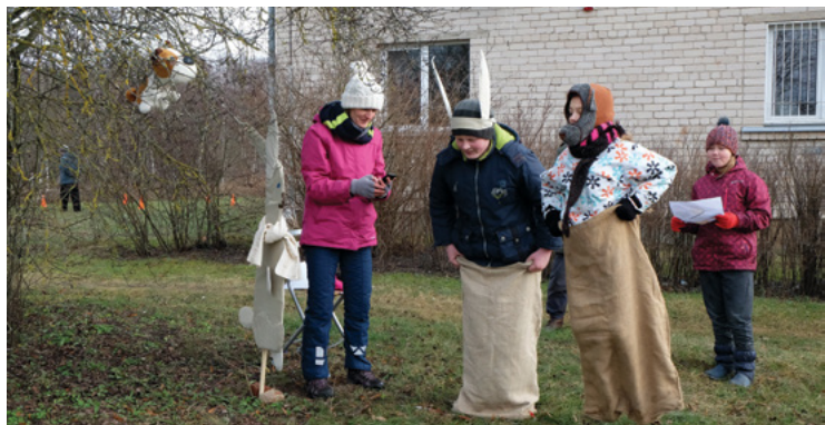
Kurš ātrāks? Un veiklāks?