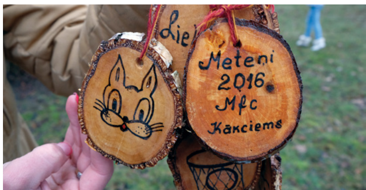
Īpašās Metēņu svētku piemiņas medaļas