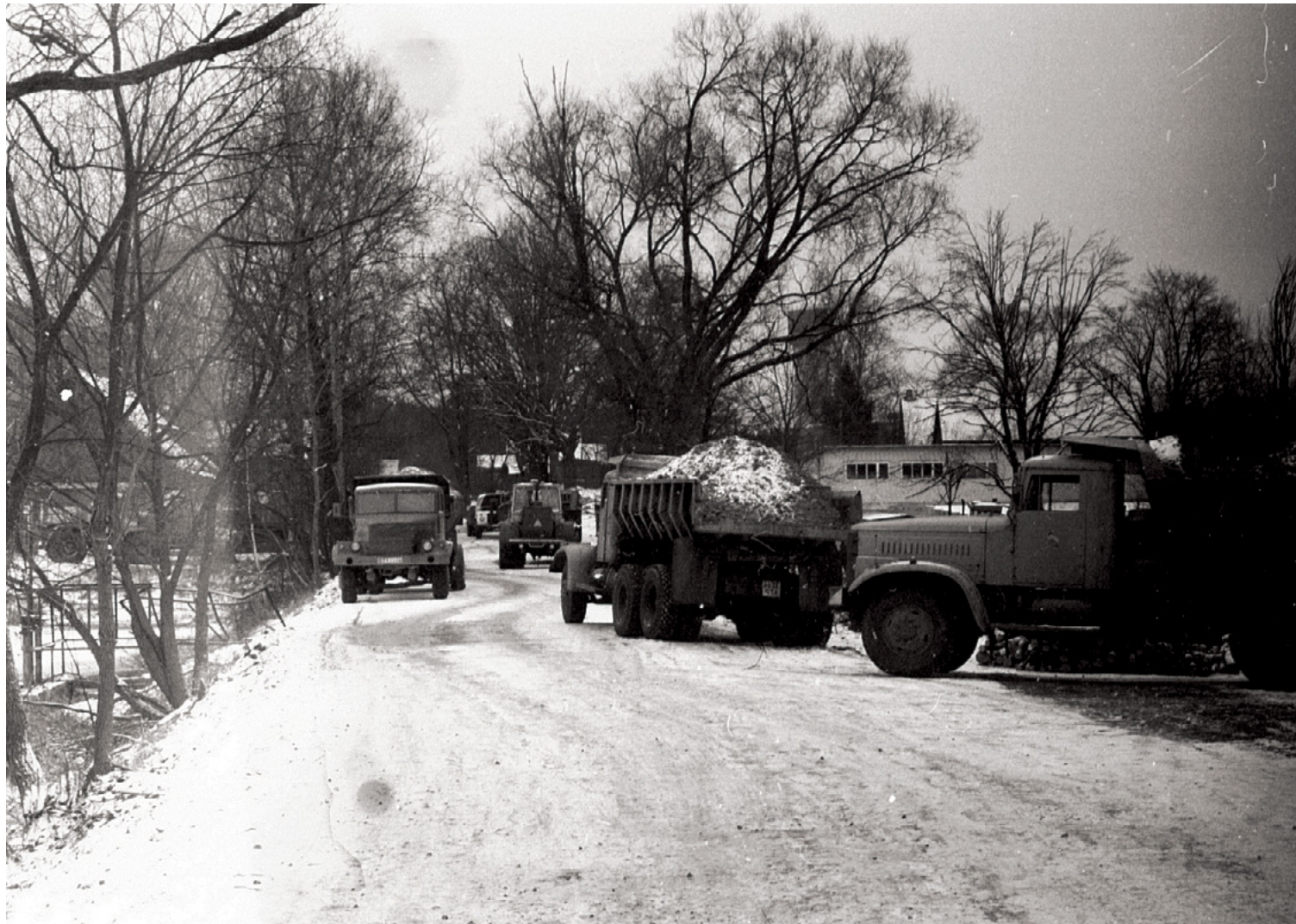
Smagā tehnika Ulbrokas radioraidītāja torņa apkārtnē, 1991. gada 15. janvāris