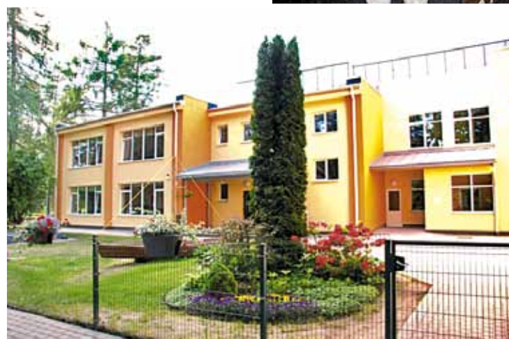
Zaķumuižas pirmskola 2015. gadā.

karogā, tajā attēlota Lielā Jugla un Ropažu novada ģerboņa trīs cīruļi.