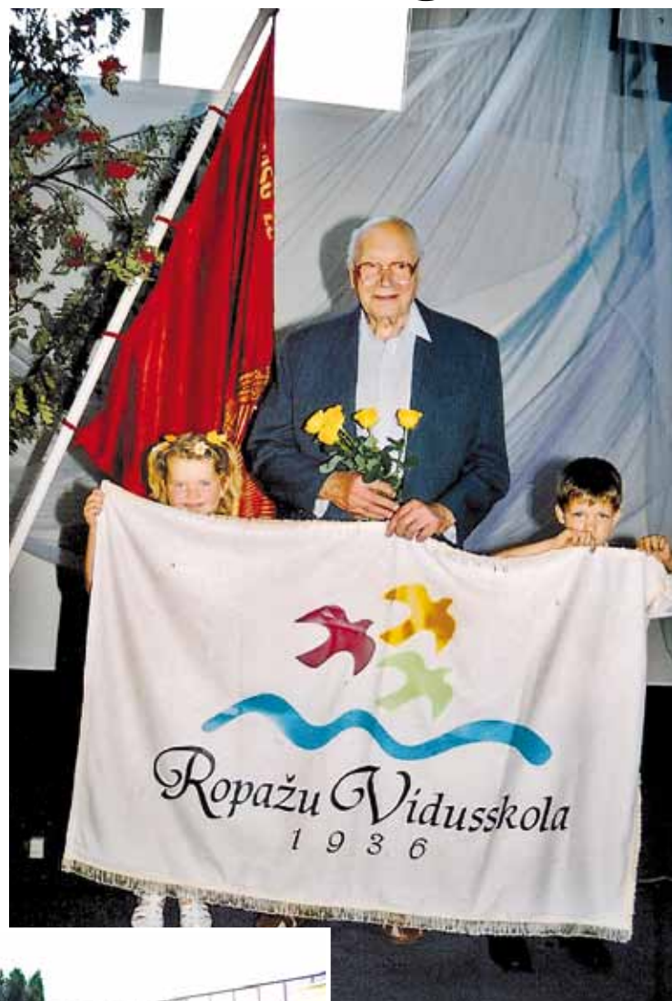
Ropažu vidusskolas karogs 2006. gadā. Fonā bijušais Latvijas Padomju Sociālistiskās Republikas Ropažu vidusskolas karogs.

2006. gadā skola izstrādāja jaunu logo, kurš simboliski tika iekļauts arī jaunajā skolas