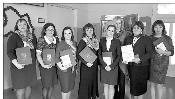
Общая фотография педагогов края на конференции в Дагде.

Во второй половине дня все участники конференции могли принять участие в различных мастер-классах, начиная с английского языка и математики и заканчивая