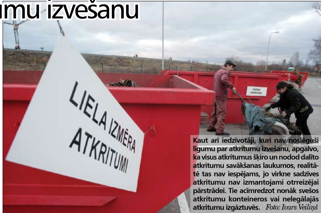
Kaut arī iedzīvotāji, kuri nav noslēguši līgumu par atkritumu izvešanu, apgalvo, ka visus atkritumus šķiro un nodod dalīto atkritumu savākšanas laukumos, realitātē tas nav iespējams, jo virkne sadzīves atkritumu nav izmantojami otrreizējai pārstrādei. Tie acīmredzot nonāk svešos atkritumu konteineros vai nelegālās atkritumu izgāztuvēs.