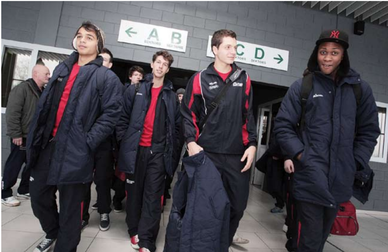
Vieni no pirmajiem Jelgavā uz Eiropas volejbola čempionāta 2. kvalifikācijas kārtas spēlēm pirmdien iradās angļi, kuri jau vakar aizvadījuši pirmo spēli tieši ar Latvijas U-18 komandu.