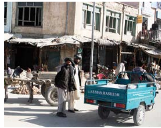
Skats uz vietējo Meimanas tirgu.