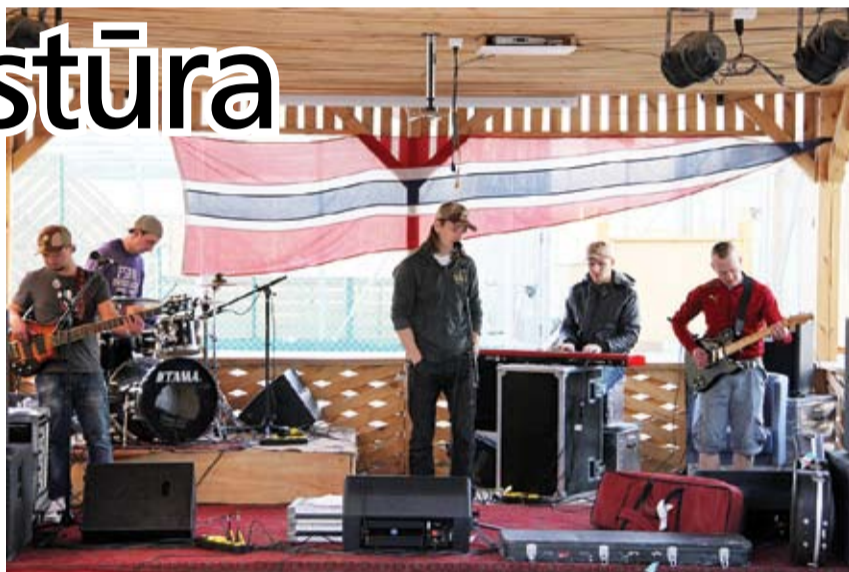
Grupa «Gain Fast» uzstājas latviešu, norvēģu, amerikāņu un vācu karavīriem.

Tur viņi arī satikuši afgāņu puiku, kurš runā latviski, diemžēl visvairāk viņš zina lamuvārdus. Šis video šobrīd populārs interneta tīmeklī youtube.com.