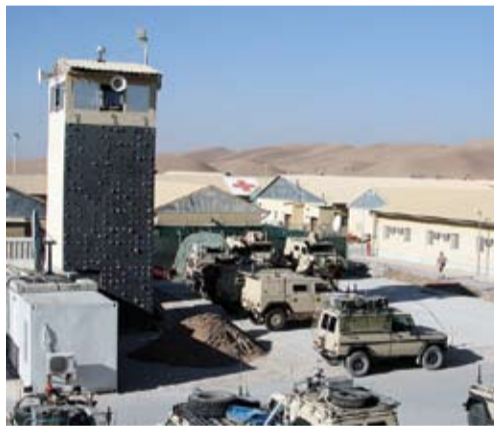
Miera uzturētāju karabāze Meimanas pilsētā.