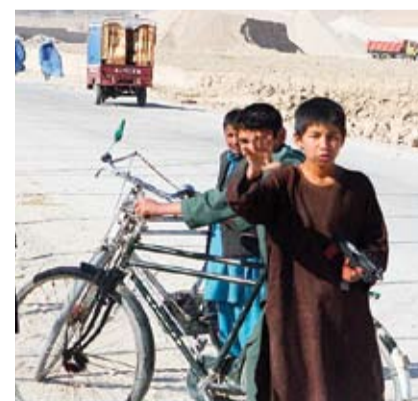
Šauj pat bērni.