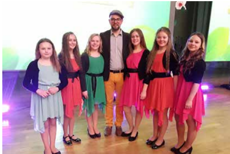
Konkursā popgrupa „MIX” saņēma 1.pakāpi un latviešu dziedātāja, komponista un dzejnieka Laura Valtera simpātiju

• 4. un 5. martā Ilūkstes Mūzikas un mākslas skolas popgrupa „MIX” un solisti devās pretī jauniem izaicinājumiem, jaunām iespējām, jaunai pieredzei uz Latvijas jauno izpildītāju konkursu “Nāc sadziedāt!”. Skolotāja Oksana Seršņova stāsta: „Kopā ar citiem dalībniekiem palīdzēja pieskandināt Pārdaugavas Koncertzāli - Rīgas Stradiņa universitātes Aulā, kā arī kopā satikties, priecāties, iedegties, dziedāt no sirds, dziedāt par prieku sev un citiem, nest gaismu,