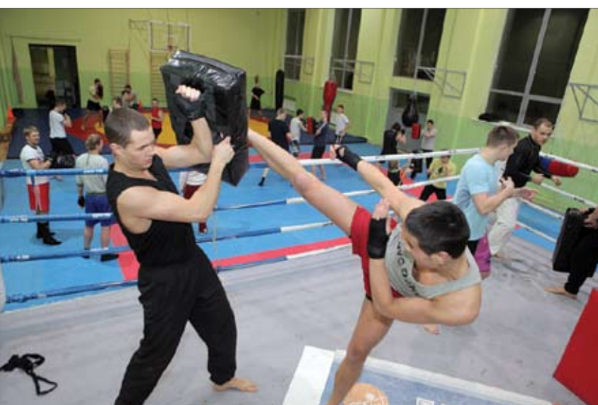
Jelgavas Čiņas sporta veidu centra audzēkņi nopietni gatavojas sestdienas pasākumam «Jelgava Fight Club», jo apzinās – viņu sniegums var mudināt citus pievērsties šim sporta veidam.

«Jelgava Fight Club» sāksies pulksten 19, bet ieeja jau no pulksten 18. Biļetes cena – 5 lati, tās iepriekšpārdošanā nopērkamas «Biļešu servisa» kasēs, bet pasākuma dienā – ZOC kasēs. Neoficiālā daļa turpināsies klubā «Opera», kur uzstāsies DJ no Amerikas, būs deju šovs un iespēja satikt cīkstoņus un bokserus. Ieeja – ar «Jelgava Fight Club» biļetēm.