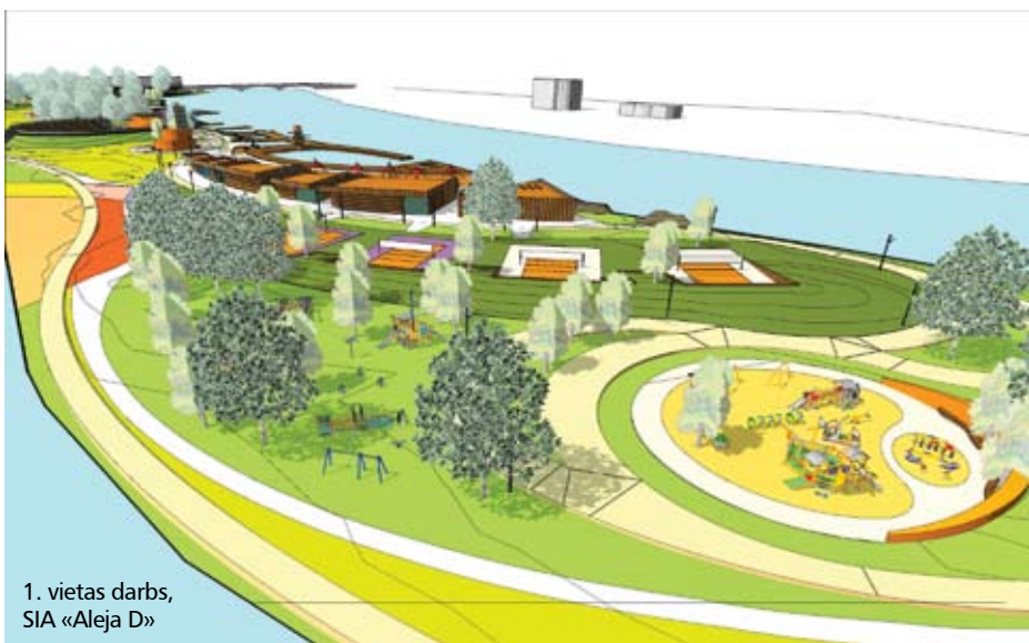
1. vietas darbs, SIA «Aleja D»

salas attīstība. Kopumā uz salas paredzētas gan aktīvas atpūtas vietas, gan celiņi pastaigām un velosportam, bērnu rotaļu laukums, laivu piestātne, estrāde, restorāns. Konkursa uzvarētājs saņems naudas balvu 1500 latu apmērā, 2. vieta – 1000 latus, bet 3. vieta – 500 latus, līdz ar to visi trīs darbi būs Jelgavas pašvaldības īpašums un tālāk tiks izmantoti, lai uzsāktu Pasta salas tehniskā projekta izstrādi. Tā kā Pasta salā atrodas arī divi privātīpašumi, «Jelgavas Vēstnesis» jautā viedokli to saimniekiem – kā viņi redz Pasta salas attīstību un vai ir gatavi iesaistīties salas sakārtošanā.