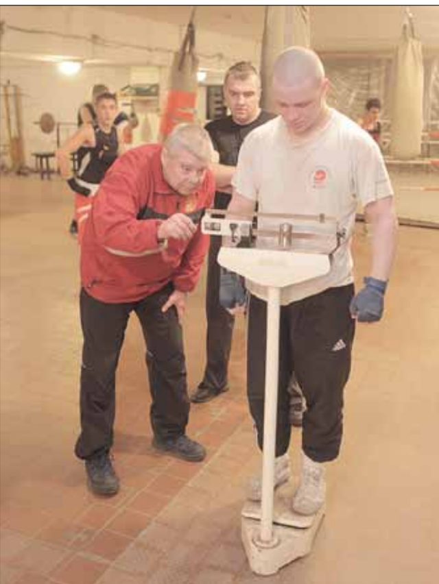
Svēršanās ir neatņemama boksa sacensību sastāvdaļa. Šodien bokseri svērsies, bet pēc tam mandātu komisija sadalīs viņus pa svara kategorijām...