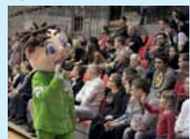
«Zemgale» spēle ir 24. martā pulksten 19.30 pret «Valmieru» (ZOC).