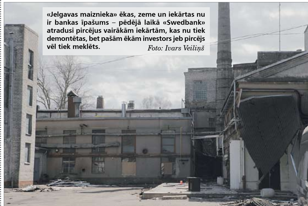
«Jelgavas maiznieka» ēkas, zeme un iekārtas nu ir bankas īpašums – pēdējā laikā «Swedbank» atradusi pircējus vairākām iekārtām, kas nu tiek demontētas, bet pašām ēkām investors jeb pircējs vēl tiek meklēts.