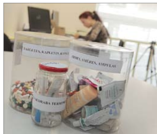
Videi draudzīgi no veciem medikamentu atkritumiem var atbrīvoties, tos nododot jebkurā «Pils aptiekā» – pēc tam tie tiek nogādāti Rīgā, lai tur jau tos atbilstoši utilizētu.