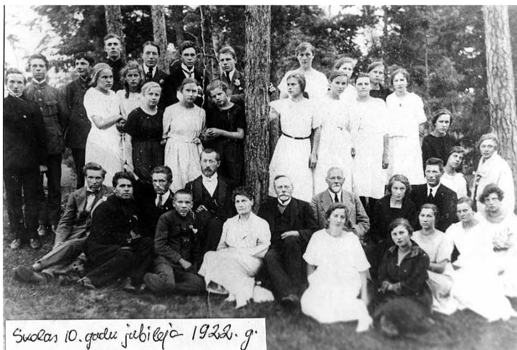
Skolas 10. gadu jubileja 1922. g.