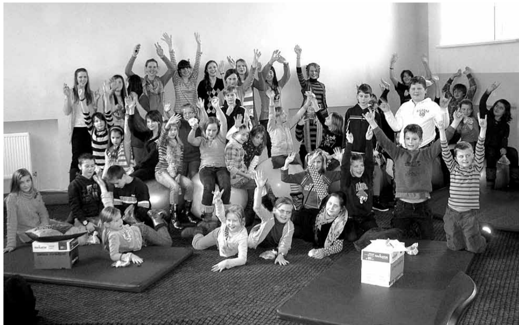
Bērnu un jauniešu žūrija.