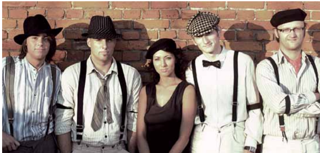
Ansamblis "Tango sin quinto"