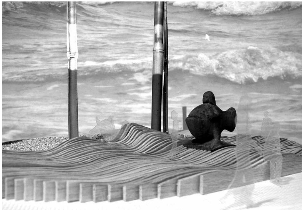
Saules laukuma makets.