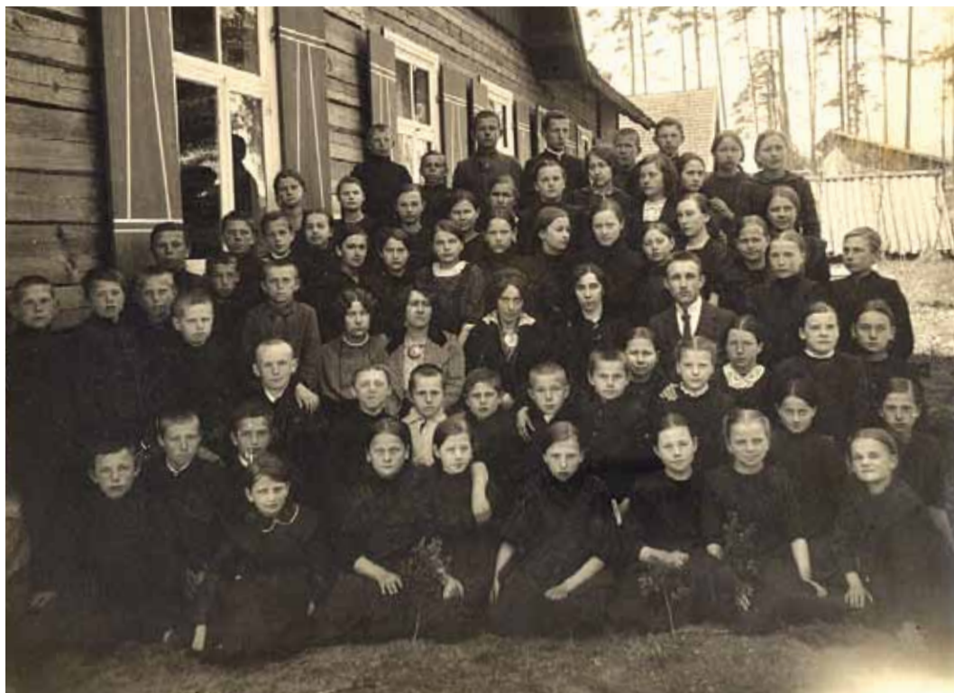
1913./1914. mācību gada audzēkņi un skolotāji