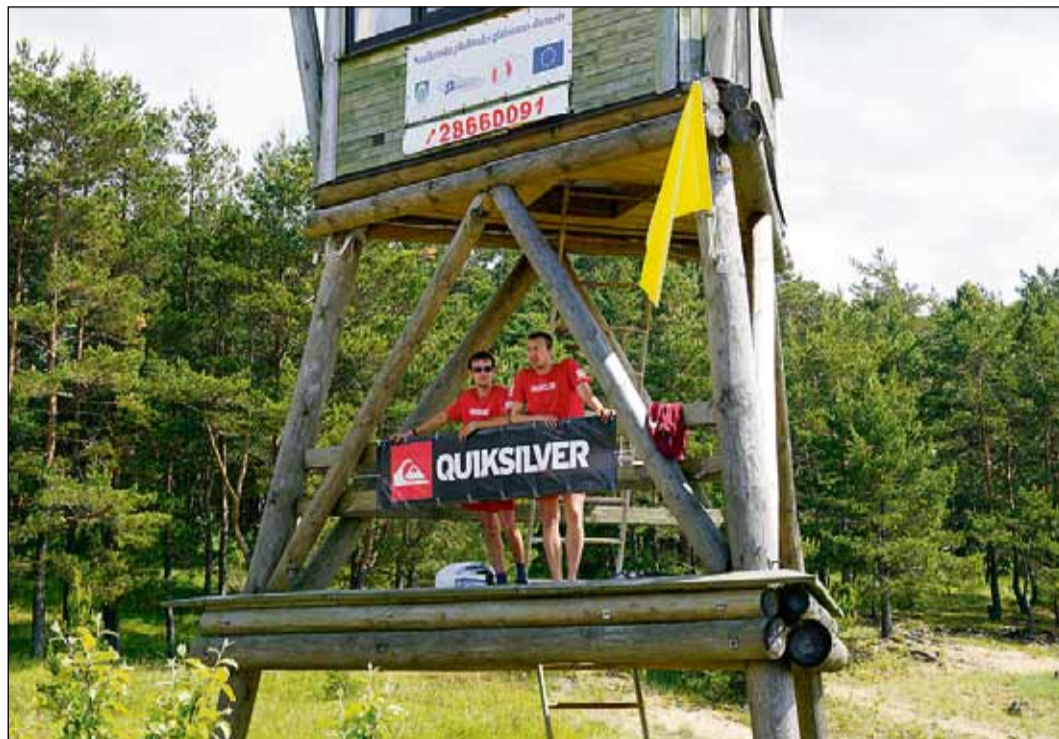
Saulkrastu peldvietas glābšanas dienesta glābēji gatavi darbam.

2012. gada sezonā Saulkrastu pilsētas pludmalei "Centrs" piešķirts Zilā karoga programmas Nacionālās peldvietas kvalitātes sertifikāts.