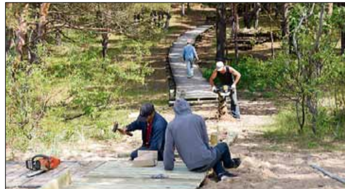
L. Paegles ielā laipu un kāpņu nomaiņa.