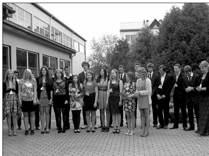
Zvejniekciema vidusskola

Absolventi pateicās visiem skolas darbiniekiem par kopā pavadītajiem jaukajiem, interesantajiem un arī komiskajiem brīžiem.