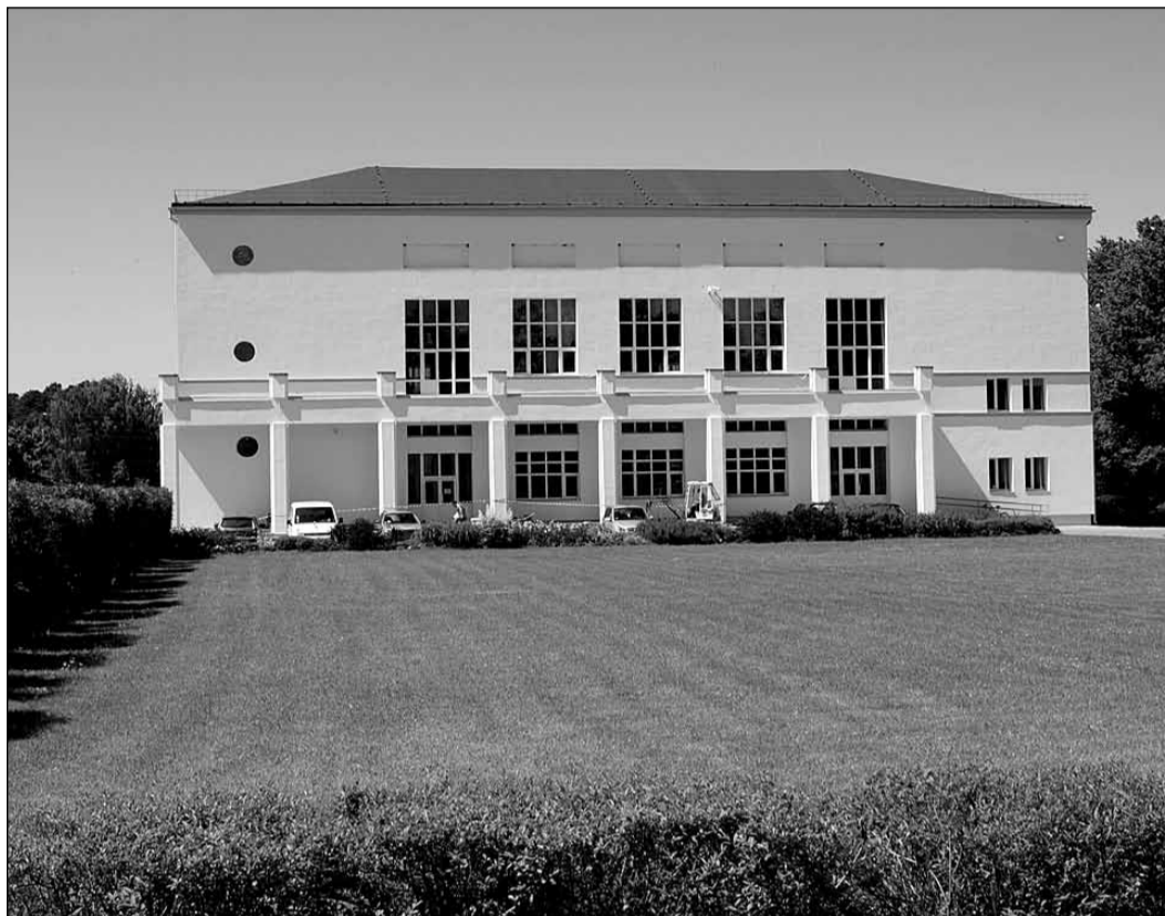
Apgaismojuma, siltumapgādes, ugunsdrošības sistēmas uzlabošana – šie un citi darbi ietilpst kultūras nama "Zvejniekiems" siltināšanas un rekonstrukcijas projektā.

Kultūras namā "Zvejniekiems" siltināšana un rekonstrukcija tika sākta 2011. gadā. Projekta kopējās izmaksas ir 330 031,41 lats, no kā domes līdzfinansējums ir 82 837,88 lats.