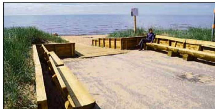
Rekonstruētā noeja pludmalē Bīriņu ielā.

Šajā nedēļā sāka avārijas stāvoklī esošo kāpņu pārbūve L. Paegles ielas izejā uz jūru. Līdz Pilsētas svētkiem 6. jūlijā plānots turpināt labiekārtošanas darbus Baltajā kāpā, pārbūvējot bojātās laipas, kāpnes un tiltiņu uz Saulrieta takas, kā arī izbūvēt jaunu koka celiņu ar soliēm līdz svētku norises laukumam.