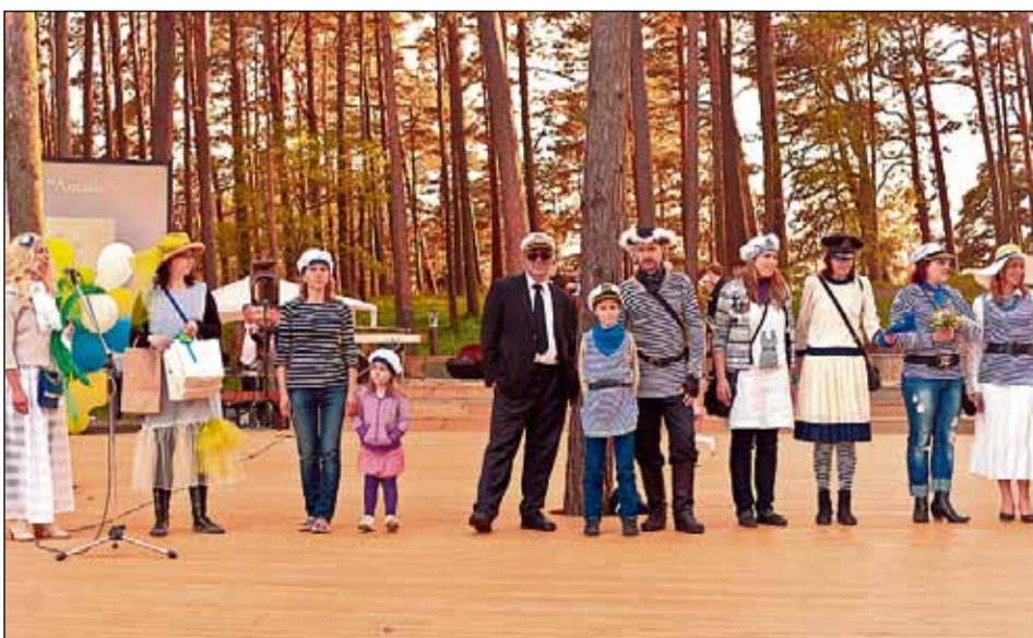
Tuvojoties svētku kulminācijai, īpaši tika apbalvotas daiļākās Lielās un Mazās Saulkrastu Katrīnas un braškie Lielie un mazie Saulkrastu Kapteiņi!