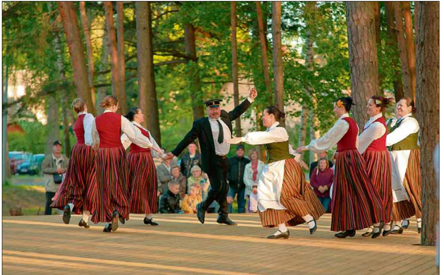
Raitu deju soli jaunajā laukumā grieza novada pašdarbības deju kolektīvi, kuros piedalās visu paaudžu saulkraścieši.

Vairāk foto apskatāmi www.saulkrasti.lv sadaļā "Galerijas".