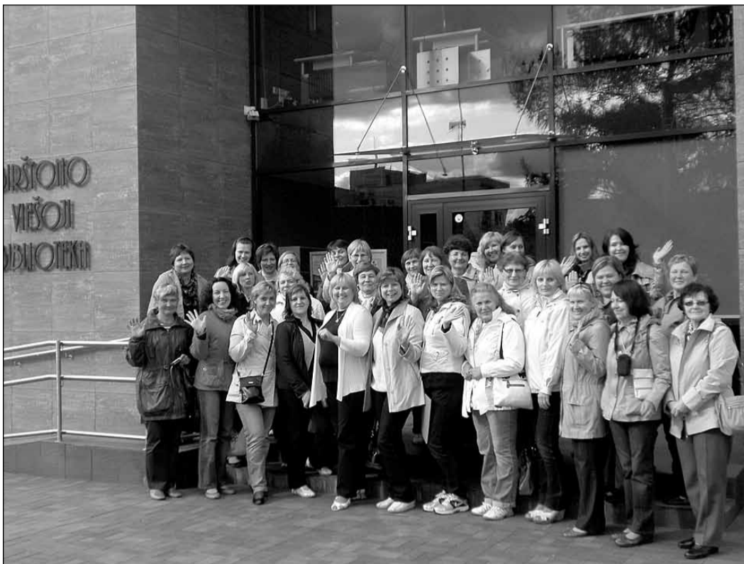
Pierīgas bibliotekāri pie Birštonas bibliotēkas ēkas.

Mazā kūrortpilsētiņa Birštona atrodas uz dienvidiem no Kauņas, tur dzīvo trīs tūkstoši iedzīvotāju.