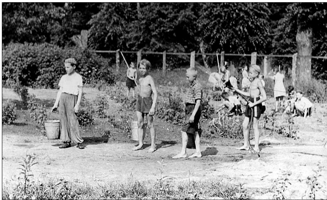
Piecdesmitajos gados pretī jaunuzcēltajai skolai sāka darboties lauksaimniecības izmēģinājumu lauciņš.