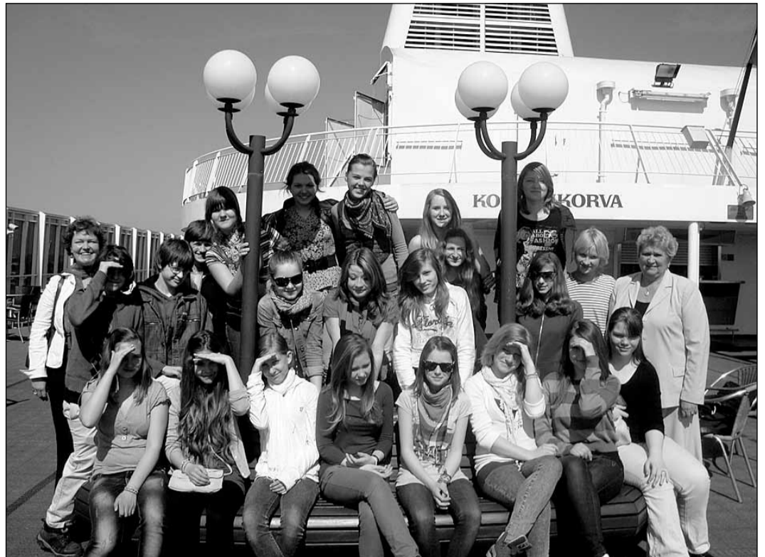
Saulkrastieši konkursā sagatavoja reklāmu, darināja lavas lampu un iestudēja stāstu par Parīzi.

Liels prieks bija uzzināt, ka no 127 klasēm, kas startēja 7.-9. klašu grupā, esam to sešu komandu vidū, kuras aicinātas 28. aprīlī uz Tallink prāmja "Romanika" klāja, lai noslēguma pasākumā uzzinātu uzvarētāju vārdus. Esam 5. vietā! Lielisks starts – tas bija vienprātīgs skolotāju un skolēnu secinājums. Un īstais stimulants, lai pēc konkursa "Zvaigžņu klase 2013" Saulkrastu vidusskolas nu jau 8. a klase kā uzvarētāji aizbrauktu ceļojumā uz Stokholmu.