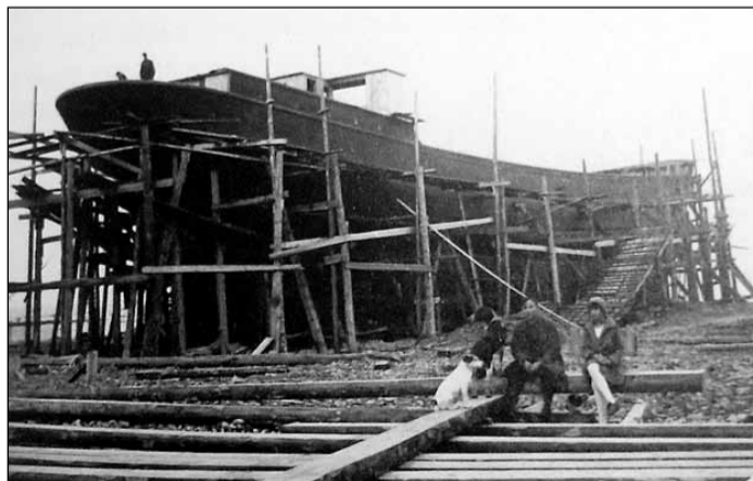
Buru kuģa būve 20. gs. sākumā.

Lai buru kuģi uzbūvētu, ir nepieciešami pieredzējuši meistari, kam uzticēt darbu vadību. Ar meistarību vienojas par kuģa lielumu, tipu un izmaksām. Būvmeistars pēc mēroga izgatavo kuģa modeli vai pusmodeli, ko vēlāk izmanto, būvējot kuģi. Modeļi veido no bezzarainiem alkšņa dēļiem precīzi noteiktā mērogā, tā, ka pēc