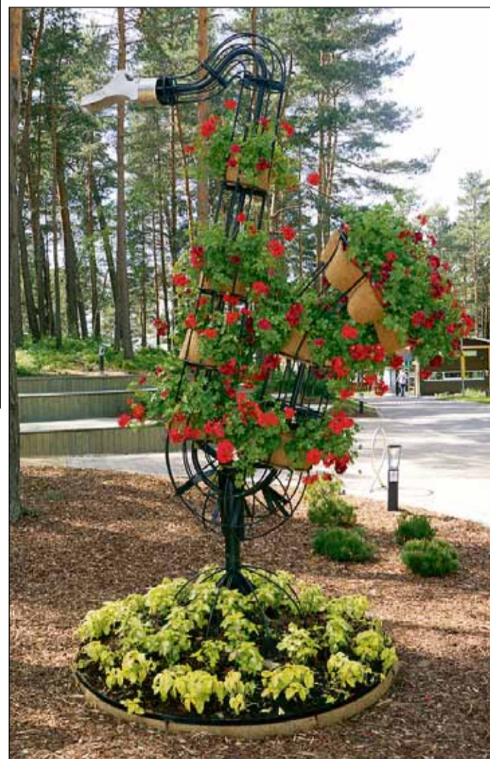
Ziedu saksofons veltīts "Saulkrasti Jazz" 15. jubilejai.