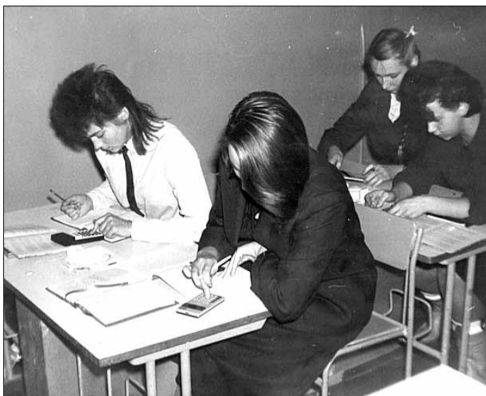
Informātikas un skaitļošanas tehnikas stunda.