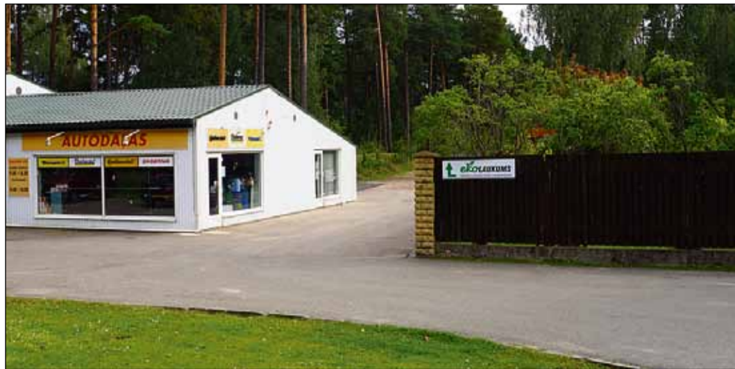
Eko laukums atrodas aiz remontdarbnīcas Rīgas ielā 96 a.

Augusta pēdējā dienā Saulkrastos, Rīgas ielā 96a (aiz autoservisa), piedaloties Saulkrastu novada pašvaldības pārstāvjiem un novada iedzīvotājiem, svinīgi tika atklāts Eko laukums šķirotu atkritumu bezmaksas pieņemšanai. Eko laukumu izveidojis atkritumu apsaimniekošanas uzņēmums ZAAO sadarbībā ar Saulkrastu novada pašvaldību.