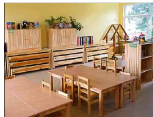
Jaunās grupiņas "Spārīte" telpa.

ciema vidusskolā un Vidzemes jūrmalas Mūzikas un mākslas skolā, oktobrī tiks pabeigta gājēju ietves izbūve gar Bērzu aleju un Atpūtas ielā.