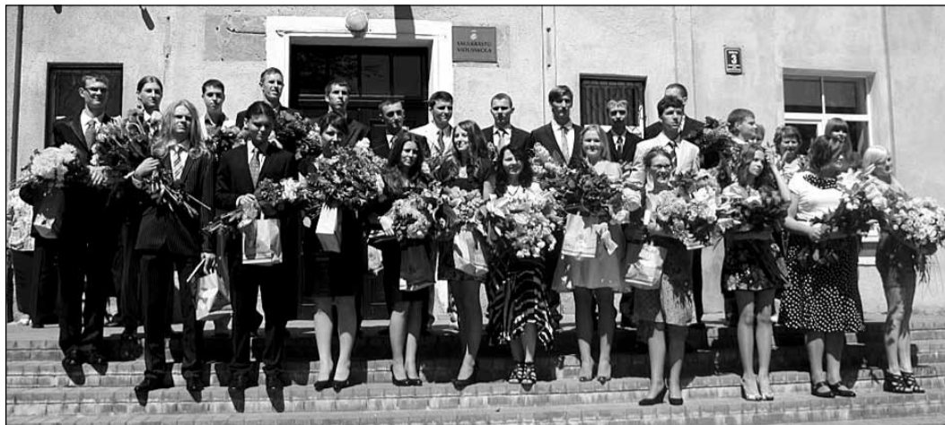
Saulkrastu vidusskolas absolventi un pedagogi izlaidumā.

Pierīgas Izglītības, kultūras un sporta pārvaldes organizētajā konferencē Saulkrastu vidusskola tika izcelta kā otra labākā Pierīgas novada skola, vērtējot izglītojamo augstos sasniegumus (A, B, C līmenis) centralizētajos eksāmenos. Eksāmenu vērtējumi liecina par skolēnu un skolotāju pašreizējā ikdienas mācību darbu.