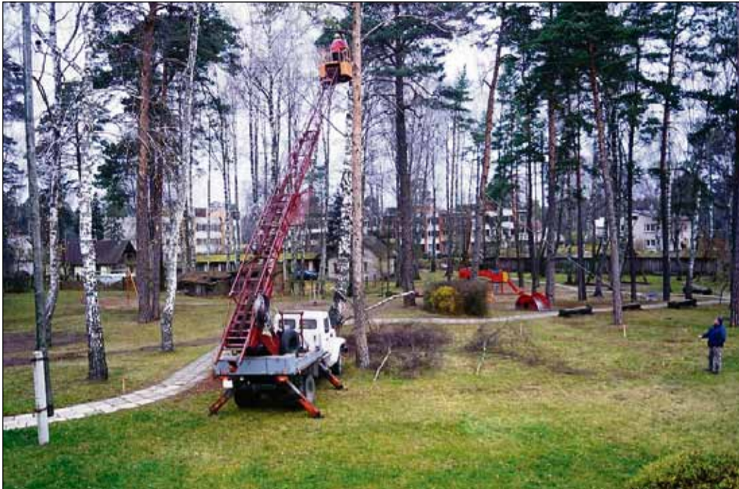
Rotaļu laukumā tiks ierīkots apgaismojums, nobruģēti celiņi, papildinātas rotaļu ierīces, uzstādīti jauni soliņi, atkritumu urnas, kā arī izveidoti apstādījumi.

lekšpagalmā aiz Saulkrastu novada domes ēkas un Saulkrastu sākumskolas sāka labiekārtošana. Izstrādātais projekts paredz, ka šī teritorija kļūs par pievilcīgu pastaigu un atpūtas skvēru iedzīvotājiem, bet īpaši sākumskolas un mākslas skolas audzēkņiem, kuri šo teritoriju izmanto atpūtai starpbrīžos starp mācību stundām.