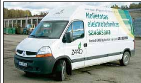
Turpmāk pilnās somas tukšos ZAAO mikroautobuss, kam ir mazāki gabarīti un labākas manevrēšanas spējas.

Lai uzlabotu pakalpojuma kvalitāti un pieejamību Saulkrastu klientiem, ZAAO ir nolēmis ar 2013. gada janvāri mainīt Eko somu tukšošanas kārtību Saulkrastu novadā. Turpmāk pilnās somas tukšos ZAAO mikroautobuss, kam ir mazāki gabarīti un labāka manevrēšanas spēja. Ar jauno gadu šī iemesla dēļ mainī-