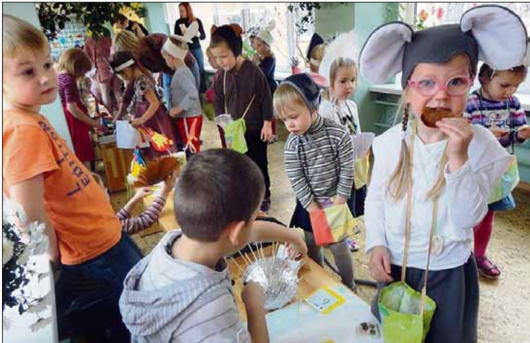
Rudenī atzīmējam Miķeļdienu un Mārītdienu. Kad pienāk novembris, ir klāt Lielais Mārītdienas tirgus. Iet vaļā maskošānās un lielā andele.

Decembrī mūsu bērnu darzdārzā norisināsies projekts “Rūķi”. Visu mēnesi notiek lielā “rūkošanās”. Rotaļnodarbībās skolotājas piedāvās dažādas aktivitātes par rūķu tēmu: bērni pētīs un izzinās rūķu dzīvi, niķus un stiķus, mēris un salīdzinās, skaitīs un rēķinās, mācīsies dziesmas, klausīsies pasakas, zīmēs, gleznos, darinās