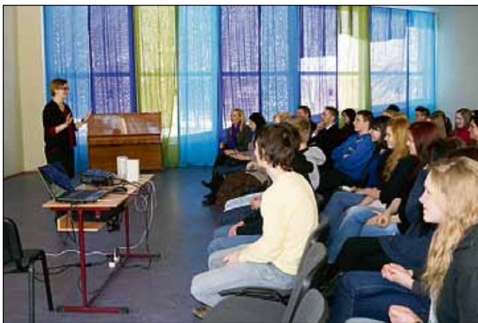
Atašeja dalījās ar savu pieredzi brīvprātīgajā darbā Āfrikas valstī Mauritānijā un aicināja jauniešus iesaistīties brīvprātīgā darba programmās.