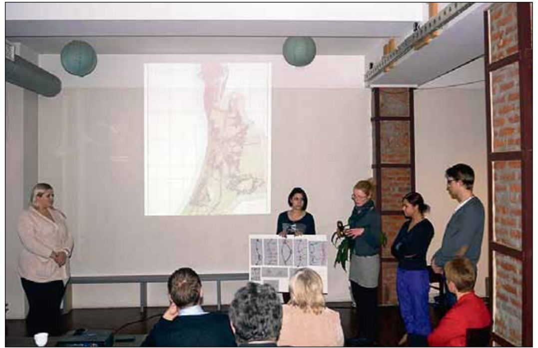
Jaunie arhitekti un dizaineri piedāvā Saulkrastos uzbūvēt peldošās laipas, SPA, zivju restorānus, zivju tirgu, kuģa būves muzeju, distanču slēpošanas trases un citus novada iedzīvotājiem un viesiem noderīgus pakalpojumus.