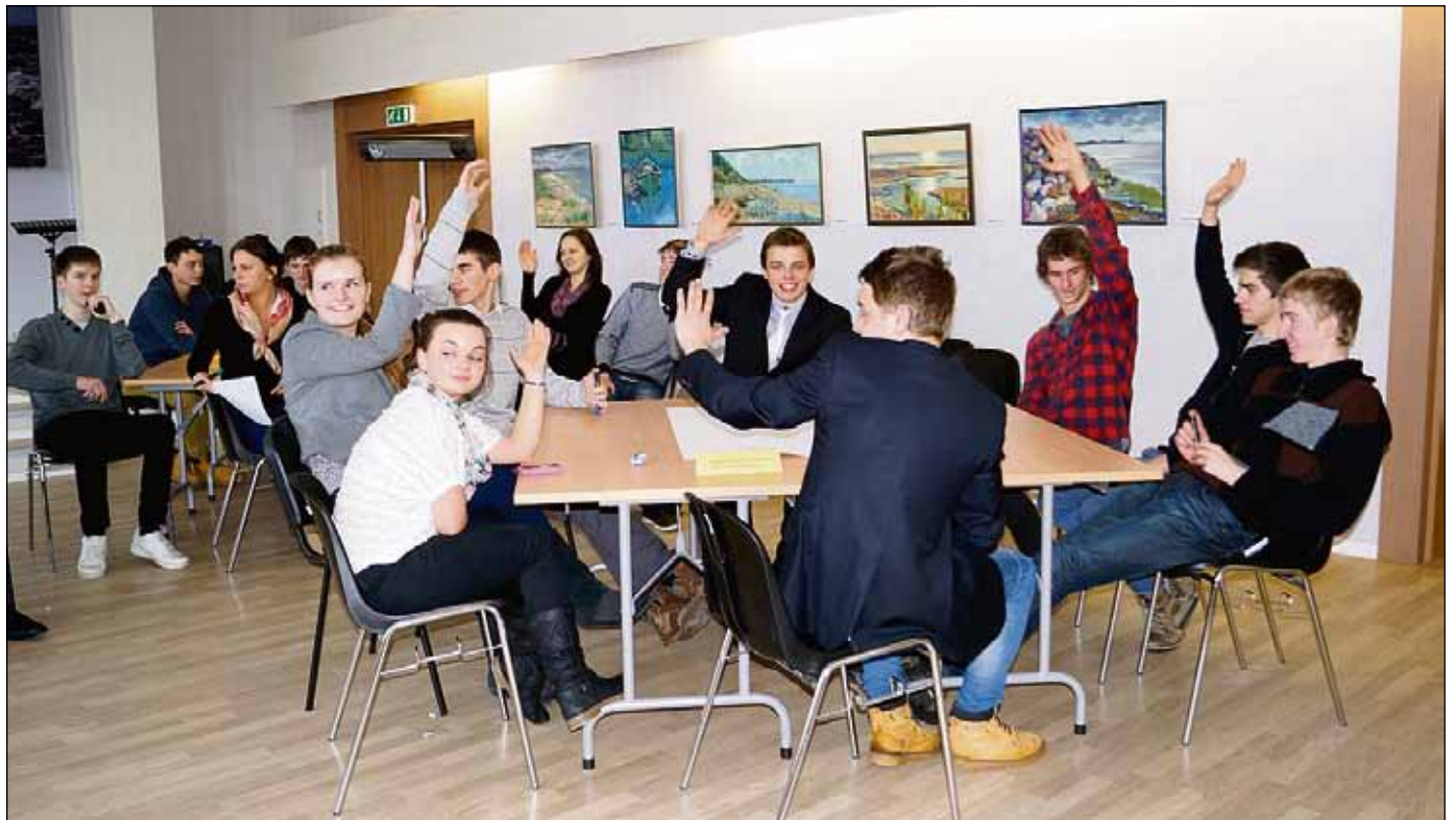
Jaunieši uzskata, ka nepieciešams lielāks atbalsts sportam – uzlabot basketbola un strītbola laukumu kvalitāti, ierīkot volejbola laukumus un aktīvās atpūtas vietas, kur var atpūsties ne vien jaunieši, bet arī ģimenes ar bērniem un seniori.

Pēc priekšsēdētāja ievēlēšanas skolēni sadalījās četrās komitejās – finanšu komitejā, tautsaimniecības, attīstības un vides komitejā, sociālo jautājumu komitejā un izglītības, kultūras, sporta un jaunatnes lietu komitejā. Katrai komitejai tika uzdoti trīs jautājumi, un pus-