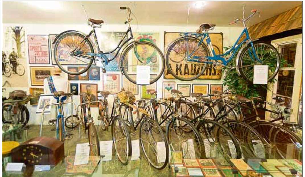
Muzeju 2012. gadā ir apmeklējuši 5596 cilvēki. Izteiktākais apmeklētāju skaita palielinājums vērojams vasaras sezonā no maija līdz septembrim.

2013. gadu muzeja ekspozīcija sāks ar daudziem jaunumiem. Kā, piemēram, muzejs savā kolekcijā ir ieguvis firmas "Eduard Sagowsky" velosipēdu darbnīcā 1899. gadā Rīgā būvētu velosipē-