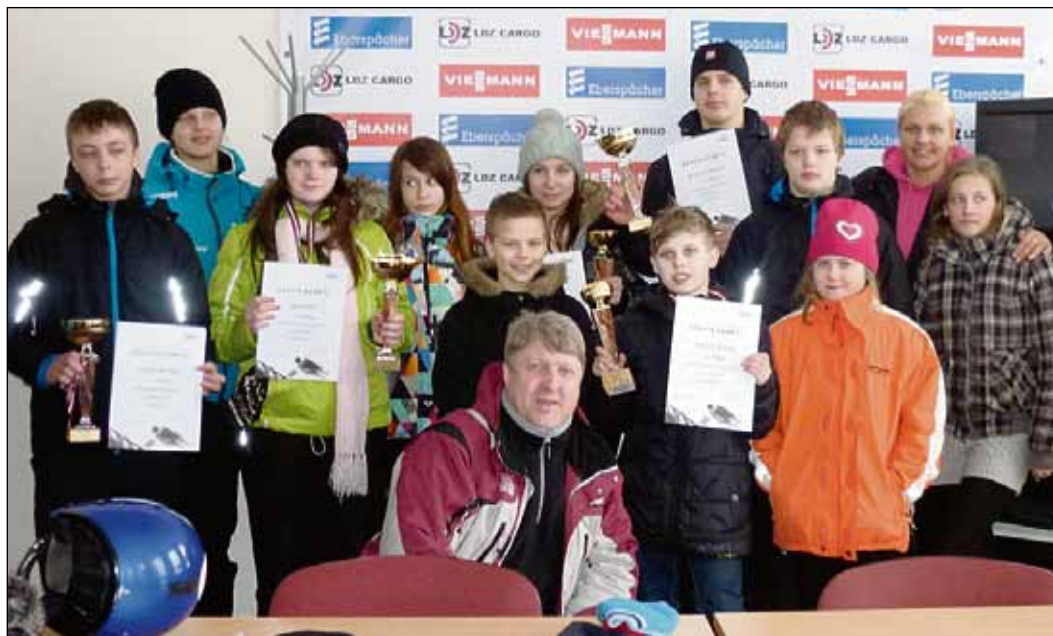
Jaunie kamaniņu braucēji ar treneriem.

Ļoti patikami otro reizi pēdējo nedēļu laikā pārsteidza Anda Upīte, kura mājup varēja doties ar sacensību uzvarētāja kausu, izcīnot to spēcīgajā konkurencē meitenēm B grupā. Ne mazāk patika-