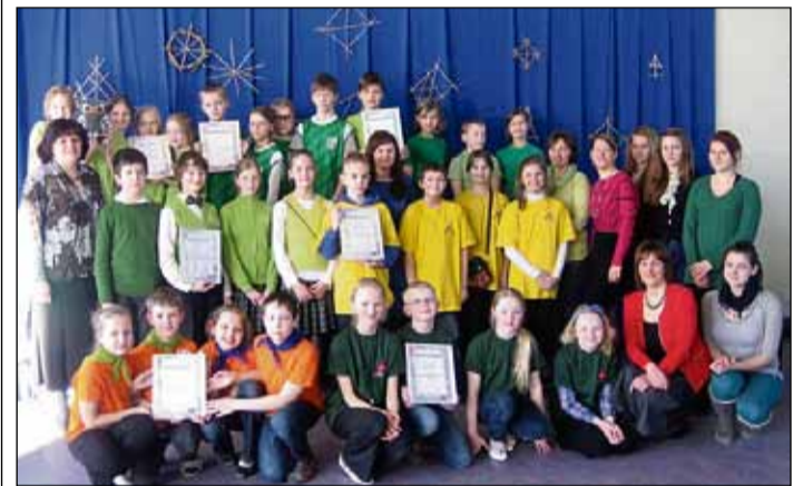
Konkursa dalībnieki un skolotāji.