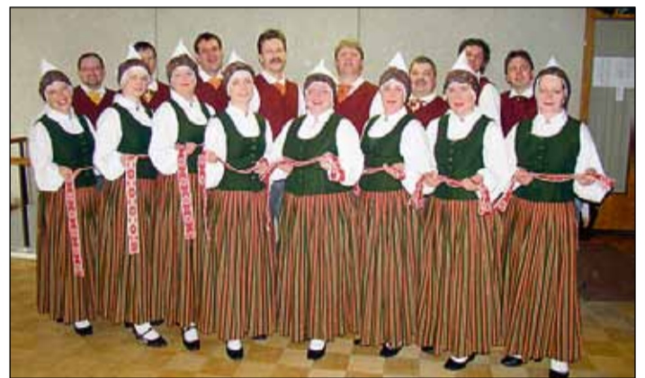
Vidējās paaudzes deju kolektīvs "Jūrdancis".

Dalība deju kolektīvos nenozīmē tikai dejošanu vien, tā dod iespēju tikties ar līdzīgu interešu cilvēkiem, radoši pilnveidoties, saturīgi pavadīt brīvo laiku (katram kolektīvam ir tikai sev vien raksturīgas sadzīvīskās norises