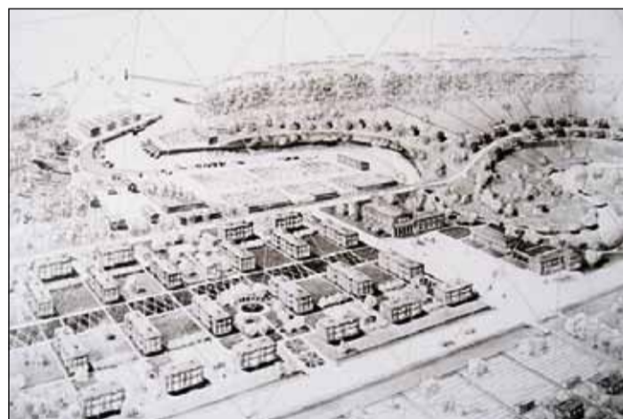
Zvejniekciema teritorijas projekts. 50. gadi.