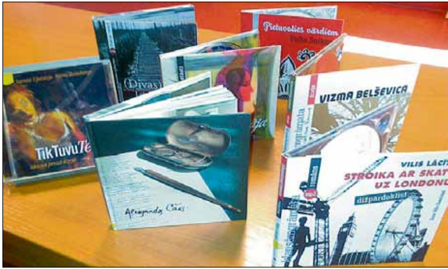
Klausāmgrāmatas ir pieejamas visiem un, tāpat kā lasāmās grāmatas, tiek izsniegtas uz mājām.

Līdz ar pavasarīgām dvesmām un saulainām nojautām Saulkrastu novada bibliotēkā "uzplaucis" arī jauns piedāvājums – klausāmgrāmatas! Tas ir īpašs grāmatu veids, kurā tekstu var klausīties dažādu sabiedrībā pazīstamu aktieru vai mūziķu izpildījumā CD formātā jebkurā disku atskaņotājā vai datorā.