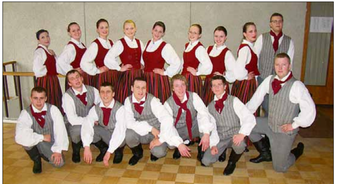
Jauniešu deju kolektīvs "Krustu šķērsu"

Periodu, kad skate aizvadīta, bet līdz deju svētkiem vēl mazliet laika, Saulkrastu deju kolektīvi izmanto ne tikai apgūto deju atkarotāšanai un spodrināšanai, bet arī jaunu deju apguvei un gatavojas sarīkojumiem – koncertiem gan Saulkrastos, gan izbraukumos. Jaunus dalībniekus amatiermākslas kolektīvi parasti uzņem, sākot