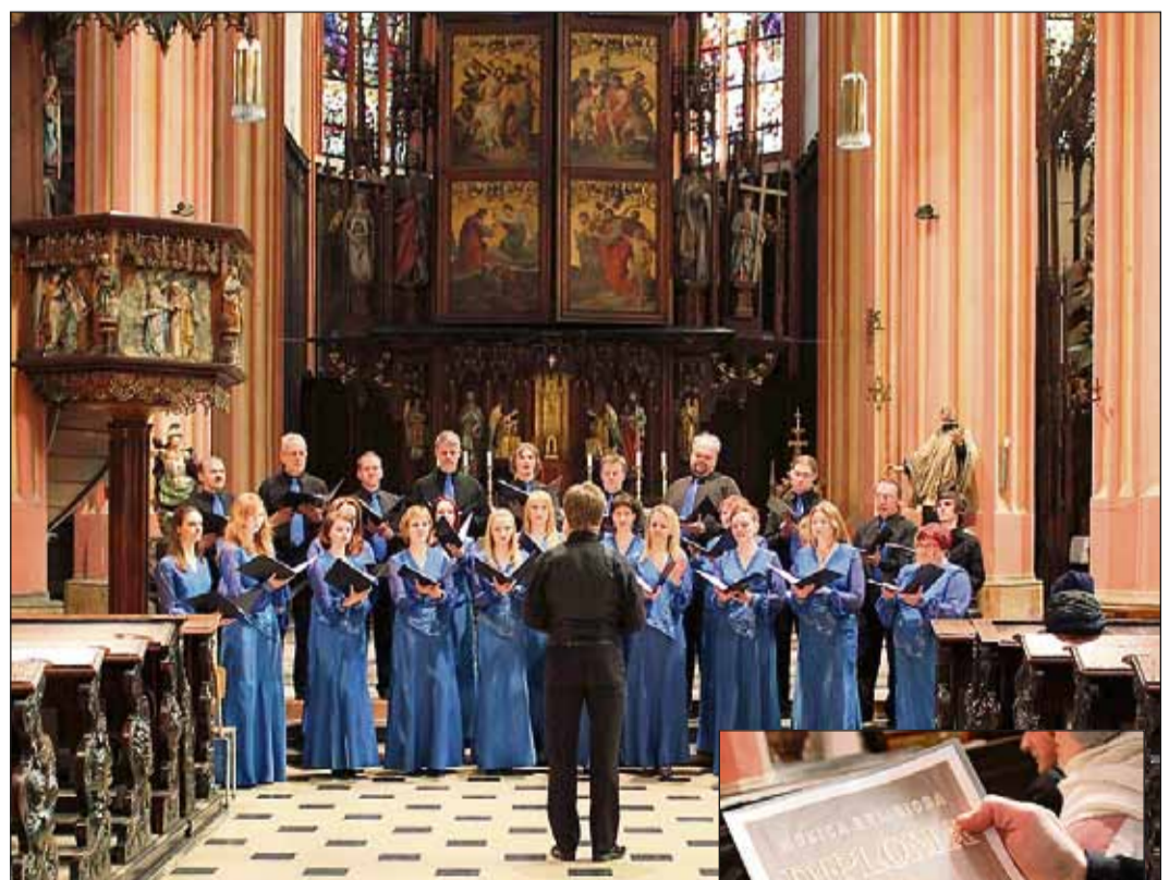
Konkurss notika Čehijas pilsētā Olomoucā Sv. Morica katedrālē, kur atrodas lielākās ērģeles Centrāleiropā.