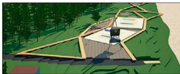
Pludmales parkā atradīsies volejbola laukumi, skatu terases un citi labiekārtojuma elementi.

Plānots, ka pēc darbu pabeigšanas šī teritorija kļūs par iedzīvotāju un pilsētas viesu iecienītu atpūtas un dažādu pasākumu norises vietu dažādos gadalaikos, savukārt peldvietas labiekārtojums atbildīs Zilā karoga statusam un tajā ērti jutīsies gan ģimenes ar bērniem, gan pludmales volejbola