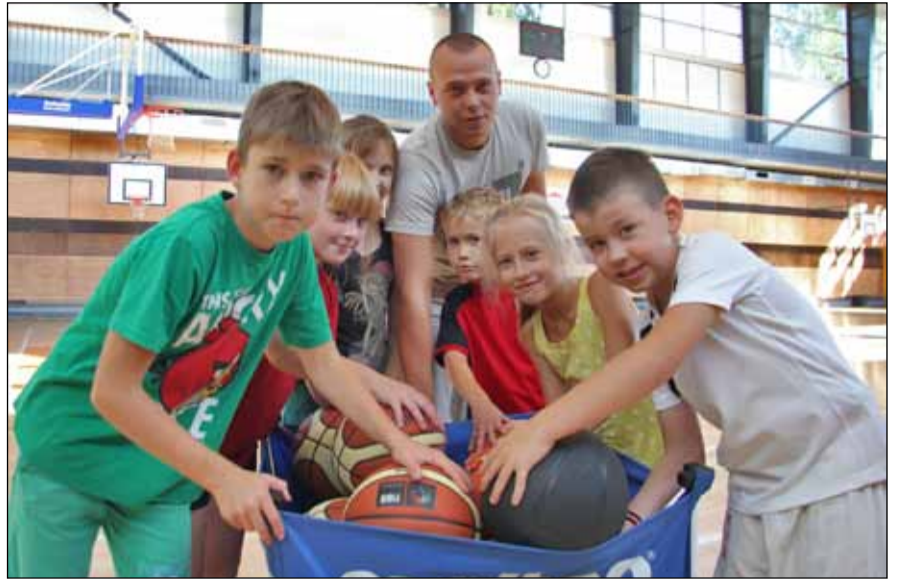
Treniņus basketbolā jau sākuši paši jaunākie sportisti. "Lēnā garā mācāmies. Jā, no sākuma nesanāk tik labi, taču labojam kļūdas, trenējamies. Tieši tas, ka beidzot sanāk, dzen tālāk."