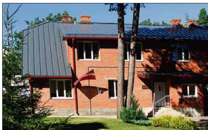
Skolas ēkai Ostas ielā uzklāts jauns jumta segums.

Vidzemes jūrmalas Mūzikas un mākslas skolā 45. jubilejas gadā pirmoreiz skolas vēsturē audzēkņu skaits izaudzis virs 300! Līdz ar to audzēkņu skaita ziņā starp 144 mūzikas un mākslas skolām Latvijā VJMMS ar šo gadu ir valsts lielāko skolu desmitniekā.