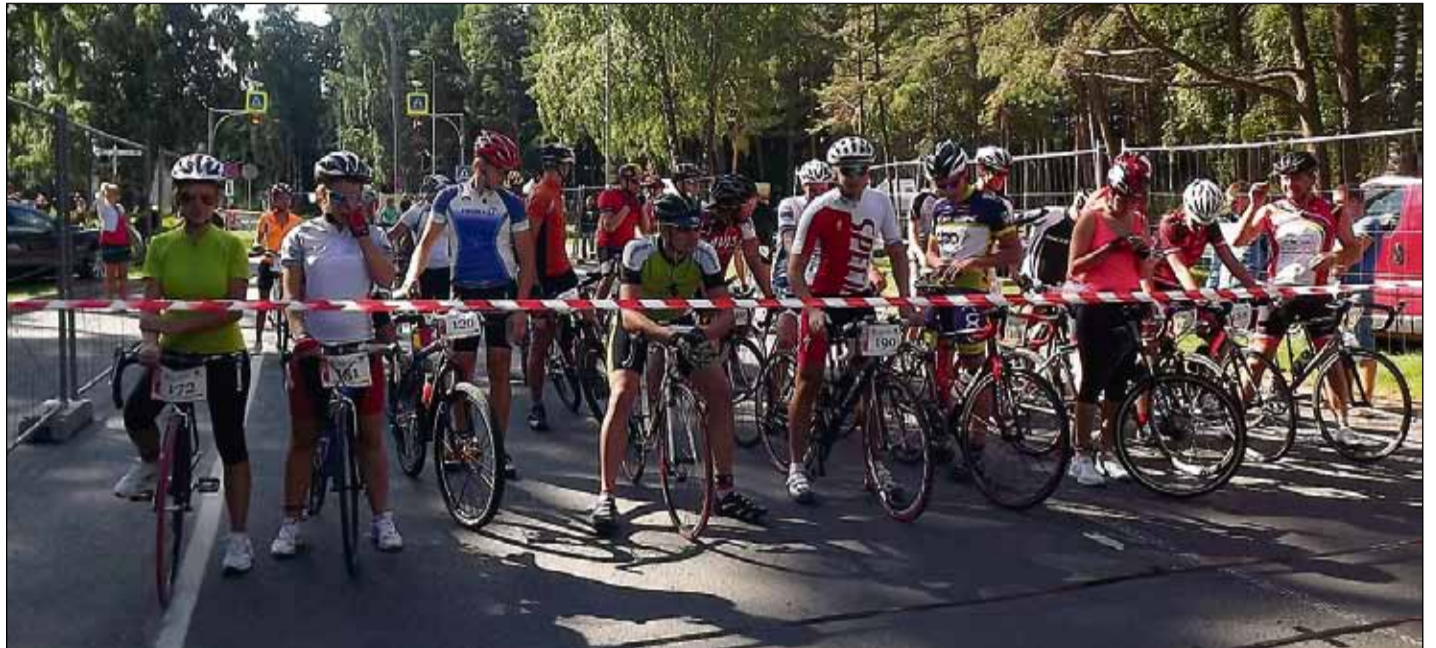
Pirms starta 30 km šosejas distancē.

Lielu cilvēku interesi varēja vērot laikā, kad sporta distancēs iesaistījās paši mazākie. Arī tiem