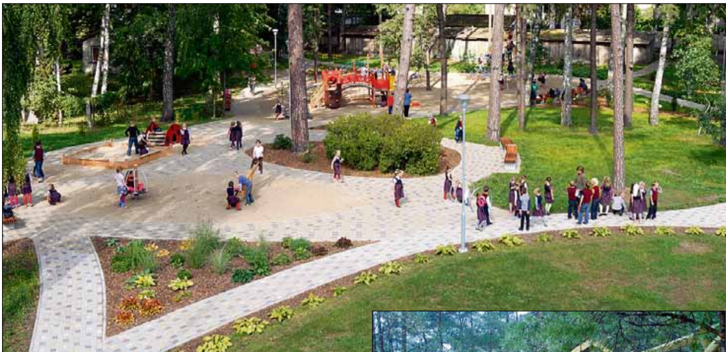
Stundu starpbrīžos mazie skolēni ar prieku dodas uz jauno rotaļu laukumu.

Sākot ar šī gada 1. septembri, pagalmā starp daudzdzīvokļu mājām, sākumskolu un novada