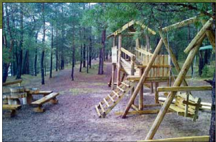
Atpūtas vieta Baltajā kāpā.