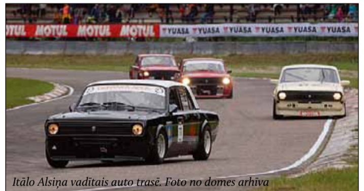
Itālo Alsiņa vadītais auto trasē.

Autosportistam saulkrastietim Itālo Alsiņam šī vasara aizritējusi ar mainīgiem panākumiem. 20. jūlijā Latvijas čempionāta trešajā posmā Rīgā iegūta 7. vieta. Savukārt 4. augustā Pērnavā "Dzintara aplī" 6. posmā starta pirmajā pagriezienā notika sadursme, kuru izraisīja konkurenti, nodarot stipru bojājumu