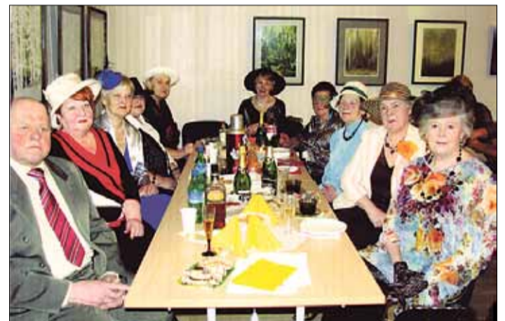
Laikam jau taisnība teicējam, ka tad, kad sieviete uzliek cepuri, viņa kļūst par dāmu. Šodien te ir gan dāma sīkspārnis, gan dāma ar istu sunīti, dāmas ar cepurītēm, kas mazākas par ābolu, – skaisti, asprātīgi, amizanti.

Polonēze, kuru vada Ruta un Staņislavs, ir masku un tērpu parāde, ko vērtē žūrija – Pabažu sieviešu vokālais ansamblis „Zustrenes” ar savu vadītāju Zeltīti Osmani un dzīvesbiedru. Masku esot vairāk nekā nomināciju un balvu, teic žūrijas vadītājs un uz-