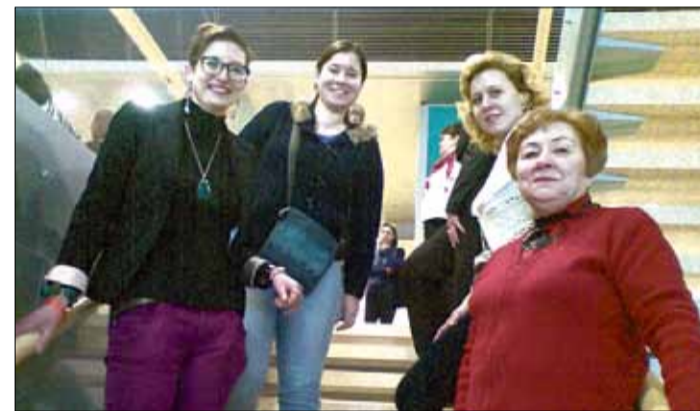
Mēs, Saulkrastu bibliotēkas kolektīvs, sakām paldies visiem mūsu lasītājiem, kuri iesaistījās akcijā „Tautas grāmatu plaukts”. Jūsu atnestās grāmatas mēs nogādājam uz Latvijas Nacionālo bibliotēku!

2014.gada 18.janvārī notika akcija „Gaismas ceļā - Grāmatu draugu ķēdē”, kurā ikviens varēja stāties, lai palīdzētu grāmatām nokļūt no vecās Latvijas Nacionālās bibliotēkas ēkas uz jauno Gaismas pili.