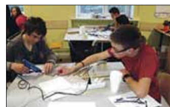
Projekta „Tehniskā jaunrade skolās” ietvaros katrs pats varēja lodēt, veikt ķīmiskas reakcijas un gatavot elektromagnētus.

Pārbaudot fizikas likumus un ķīmijas procesus praktiski, Saulkrastu vidusskolas skolēni guva vērtīgu pieredzi. Cerams, ka eksaktās zinātnes un dabaszinības būs tie mācību priekšme-