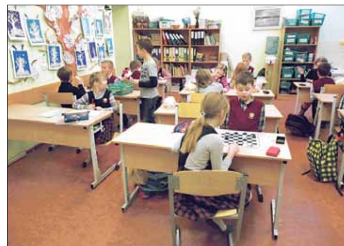
Dambretes pulciņā var spēlēt ne tikai dambreti, bet arī risināt dažādus dambretes uzdevumus un spēlēt citas spēles uz dambretes lauciņa.

Sākumskola ir laiks, kad mazie skolnieciņi ar lielu prieku apmeklē dažādus pulciņus. Arī Saulkrastu vidusskolā ir iespēja apmeklēt sporta, orientēšanās, mākslas un rokdarbu pulciņus, dziedāt, kā arī nodarboties ar citām interesantām lietām.