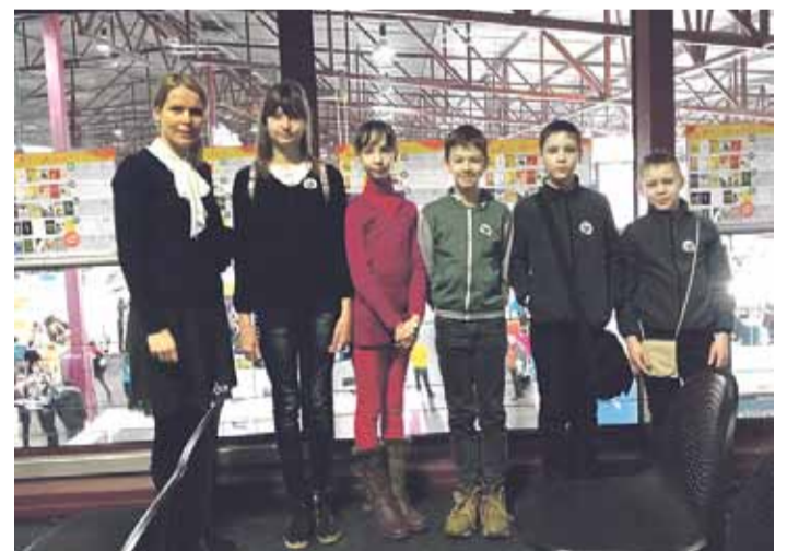
Bērnu un jauniešu žūrijas pārstāvji Lielajos lasīšanas svētkos.

Bērnu žūrijas dalībniekus priecēja pasākuma daudzveidīgā programma, kuras laikā mazie lasītāji varēja satikt iemīļotos rakstniekus – Māri Runguli un