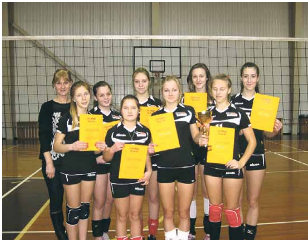
B grupas meiteņu komanda izcīnīja pārliecinošu uzvaru.

Zvejniekiema vidusskolas volejbolisti, kā katru gadu, aktīvi trenējas, lai ar labiem sasniegumiem piedalītos Pierīgas novadu skolēnu sporta spēlēs volejbolā.