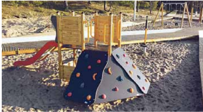
Mazajiem atpūtniekiem pieejamas daudzveidīgas rotaļu ierīces.

Pagājušā gada rudenī tika uzsākti peldvietas „Centrs” labiekārtošanas darbi, lai uzlabotu peldvietas infrastruktūru un nodrošinātu gan vietējos iedzīvotājus, gan Saulkrastu viesus ar drošu un interesantu atpūtu pludmalē.