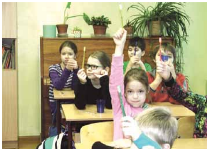
Jaunāko klašu skolēni uzzināja par zobu tīrīšanas nozīmi.