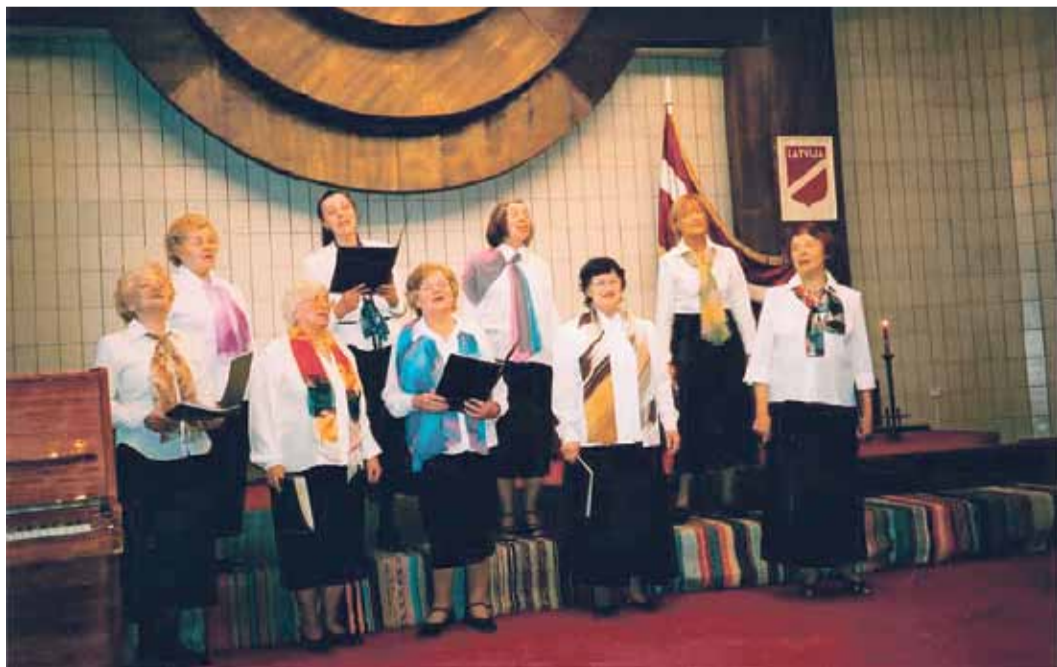
„Kori „Bangotne” dziedāju 40 gadus, bet piecus ansambļi „Dzile”. Dziesmas savulaik man palīdzēja iemācīties lasīt latviešu valodā.”

Tēvs un māte nomira turpat svešumā. Kur ir tēva kaps, es nezinu. Tikai to vien atceros, ka visi runāja, ka pēdējais vagonis, kurā bija vīrieši, arī mūsu tēvs, pa ceļam no sastāva atkabināts un aizsūtīts uz citu pusi. Man bija septiņi gadi, un kaut ko jau es sapratu. Kad 1990. gadā dabūjām rehabilitācijas