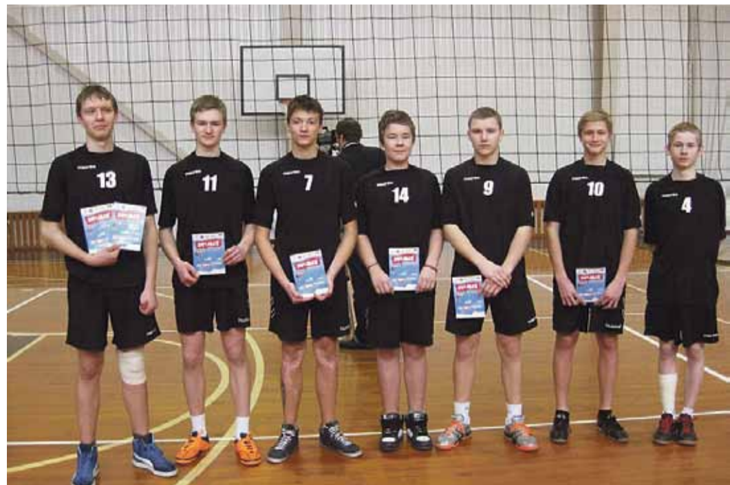
B grupas zēnu komanda.

Zvejniekiema vidusskola „Lāses kausa” sacensībās piedalās jau kopš 2001. gada. Ar labiem sasniegumiem visu šo laiku skolas komandas ir piedalījušas finālspēlēs.