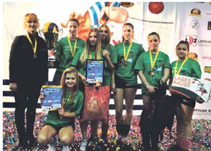
Finālsacensībās 31 komandas konkurencē Zvejniekiema vidusskolas meiteņu komanda kļuva par sacensību „Lāses Kaus 2014” 1. vietas ieguvēju.