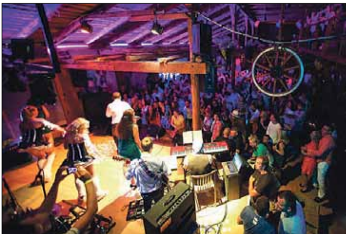
Jauka ballīte nedēļas nogalē.

Tā kā mēs esam ģimenes uzņēmums, visi dara visu, kas nepieciešams. Es jau vairākus gadus vadīju kāzas, rakstīju scenārijus, organizēju pasākumus firmām. Meitenes man šo un to piepalīdzēja jau tad, kad es darbojos ar kāzām, vēlāk līdzdarbo-