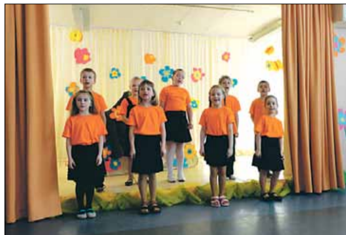
Saulkrastu PII „Rūķītis” ansamblis „Zvaniņš”