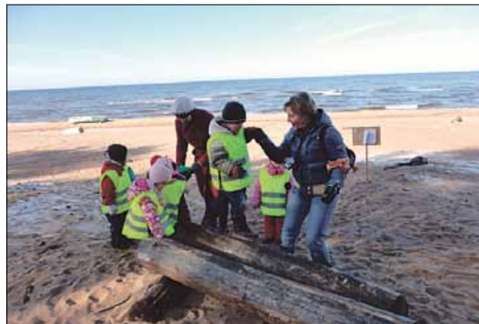
Grupa „Cielaviņa” Metenim pa pēdām.