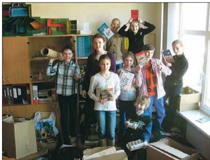
5.klases skolēni priecājas par veikumu.

2. Sargāt mežu, jo katra savāktā makulatūras tonna pasargā no nociršanas sešus kokus!