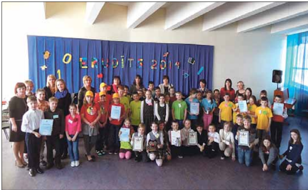
„Erudīta 2014” dalībnieki – Mārupes vidusskolas, Zvejniekiema vidusskolas un Mārupes pamatskolas komandas.

4. martā Zvejniekiema vidusskolā tikās Pierīgas skolu 3. klašu komandas, lai apliecinātu savas zināšanas, prasmes, radošumu un veiklību konkursā „Erudīts 2014”.