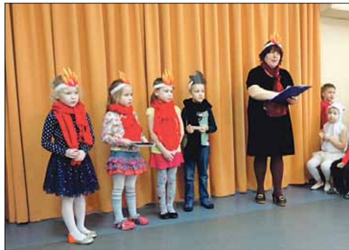
Grupa „Pūcītes” projekta „Drošība” noslēgumā. Tēma – ugunsdrošība.