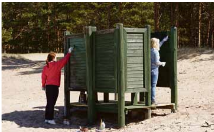
Peldvietā „Centrs” tika sakoptas un nokrāsotas pārģērbšanās kabīnes.