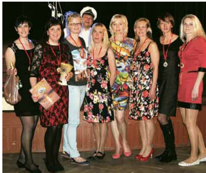
Saulkrastu dāmu komanda - turnīra uzvarētājas.