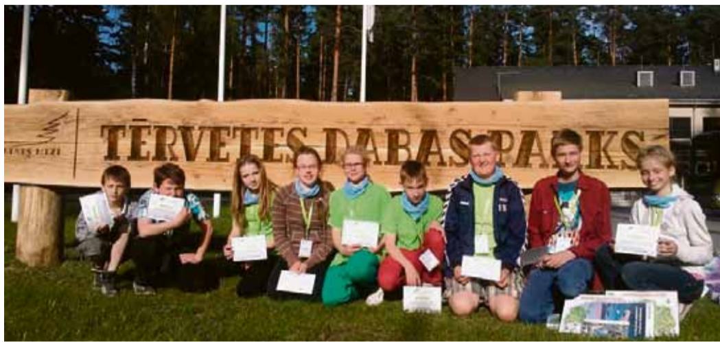
6. klases skolēni Tērvetes dabas parkā.