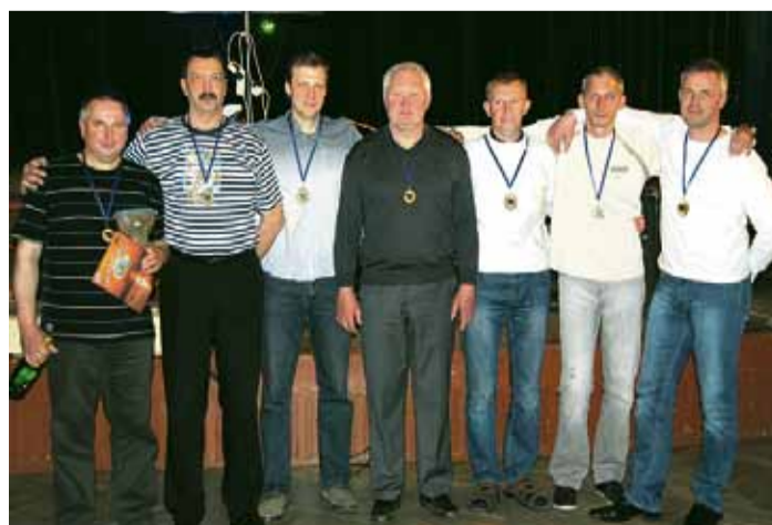
Zvejniekciema komanda dramatiskiem notikumiem pārbagātā cīņā izcīnīja 2. vietu.