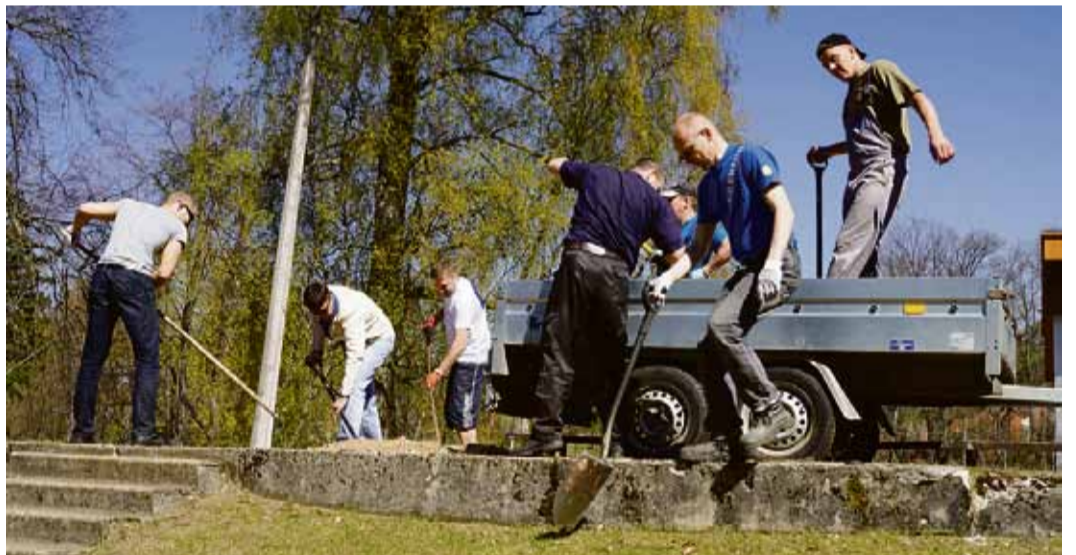
Sakopšanas darbi notika arī Saulkrastu estrādes teritorijā, tostarp tika sakārtoti gājēju celiņi.