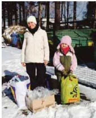
Vijgriežu ģimene EKO laukumā Saulkrastos, Rīgas ielā 96a.

Galveno balvu ieguva Borīsovu ģimene, kura uz EKO laukumu Valmierā atnesa sadzīves metāla priekšmetus un PET dzērienu pudeles, turklāt viņi bija īpaši piedomājuši arī par