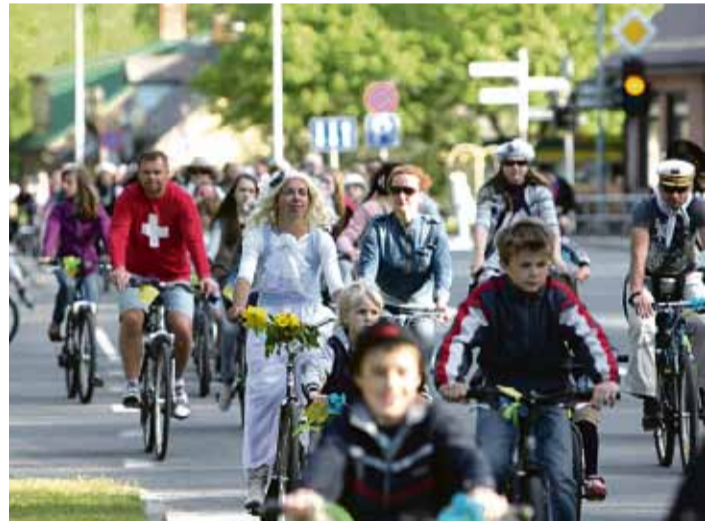
Jau trešo gadu Saulkrastu iedzīvotāji un viesi ir aicināti piedalīties Velosipēdu muzeja rīkotajā braucienā, kas, sadarbibā ar pašvaldību, kļuvis par Saulkrastu kūrorta sezonas atklāšanas neatņemamu sastāvdaļu.

Velosipēdu remonta pakalpojumus sākām piedāvāt tāpēc, ka Saulkrastos, tāpat kā Rīgā, velobraucēju kļūst arvien vairāk. Velosipēdu remonta darbnīcu atvērām 2009. gadā, un, jāteic, ka ar katru gadu darba ir aizvien vairāk. Saulkrastu pilsētai velobraucēšanas ziņā ir ļoti pateicīgs ģeogrāfiskais izvietojums. No viena pilsētas gala līdz otram ir kādi 12 kilometri. Ar mašīnu, protams, būs ātrāk, bet ar velosipēdu – ērtāk. Arī man pazīstamo cilvēku lokā tie, kuri