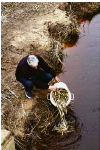
Smoltu ielaišana Pēterupē.

Piedaloties Lielrīgas reģionālās vides pārvaldes inspektoriem, Saulkrastu novada domes un Vidzemes zvejnieku biedrības pārstāvjiem, novada mazo upju lejtecēs tika ielaisti vairāk nekā 2500 taimiņa mazuļi. Zivju mazuļu monitoringu un novērtējumu paredzēts veikt šogad un nākamajā gadā sadarbībā ar zinātniskā in-