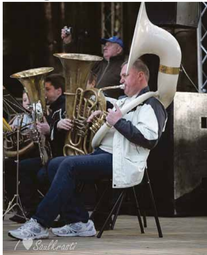
Svētkus ieskandināja pūtēju orķestru koncerts „Lai svētki skan un atbalsojas!”, kurā kopā muzicēja gan pašmāju orķestris „Neibāde”, gan Limbažu PO „Lemisele”, gan orķestri no Pociema un Ugāles.