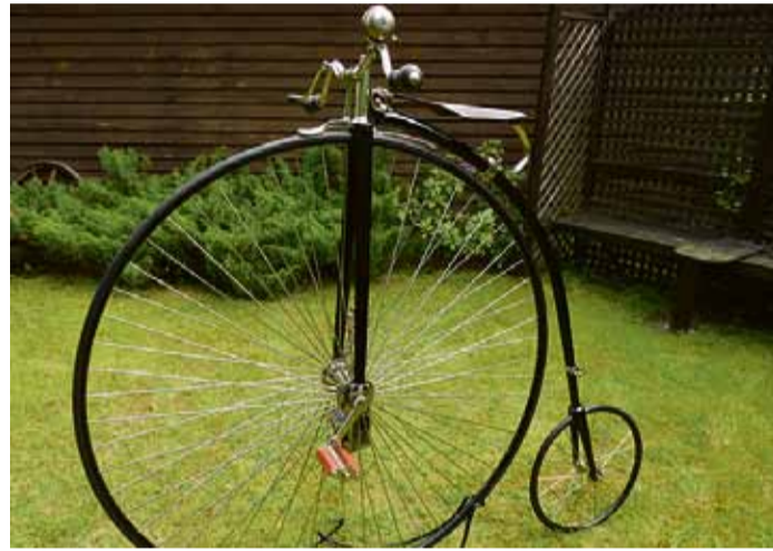
Kalēja kalts augstrats jeb „zirneklis”, arī „vellapēds”, ir gan muzeja simbols, gan viens no pirmajiem posmiem velosipēdu būves vēsturē.