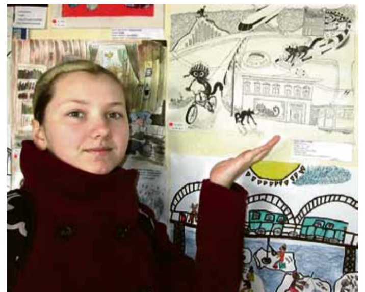
„Manā darbā Melnais Runcis brauc pa Rīgu ar velosipēdu, aplūko Nacionālo bibliotēku no augstākā skatupunkta, viesojas Dabas muzejā un vēl paspēj izpeldēties Līvu Akvaparkā,” stāsta Elīza.

Apsveicam Elīzu un viņas skolotāju ar sasniegumu!