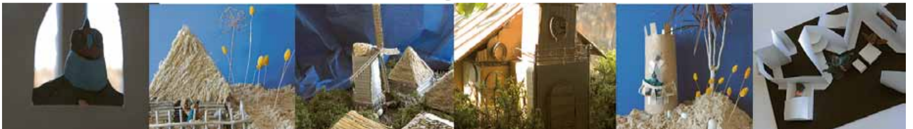
VJMMS mākslas nodaļas filmas kadri valsts konkursam.

Šogad konkursā piedalījās vairāk audzēkņu nekā jebkad – 344 audzēkņi no 91 mākslas skolas, savukārt mākslas pedagogu ikgadējais seminārs un darbu izstāde, kas šogad notika Saldū, pulcēja 220 pedagogus no visas Latvijas.