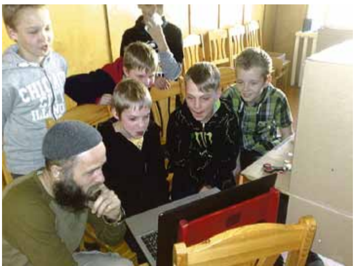
4.b klases skolēni veido filmu.

Atzīmējot Starptautisko bērnu aizsardzības dienu, Saulkrastu novada bibliotēka sadarbībā ar biedrību „Mēs varam”