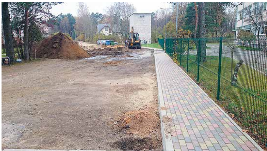
Darbu ietvaros plānots asfaltēt Stirnu ielas daļu gar bērnu dārzu, izbūvēt betona bruģakmens autostāvvietas, ierīkot lietusūdens savākšanas gūlijas un infiltrācijas akas, kā arī izvietot ceļazīmes.

Oktobra vidū uzsākta stāvlaukuma un lokālās lietusūdens kanalizācijas izbūve Stirnu ielā pie pirmsskolas izglītības iestā-