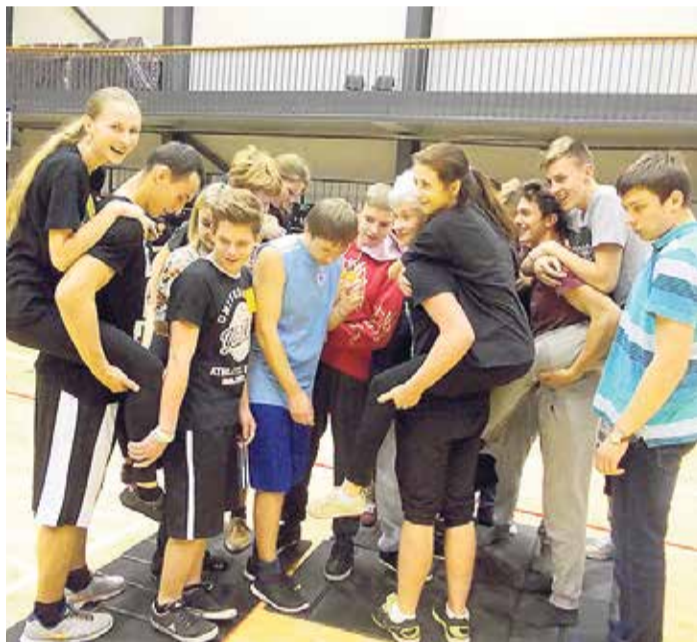
Sportiskās aktivitātes atraišija gan Saulkrastu, gan Neringas skolēnus, un vakars turpinājās jautrā un draudzīgā noskaņā.