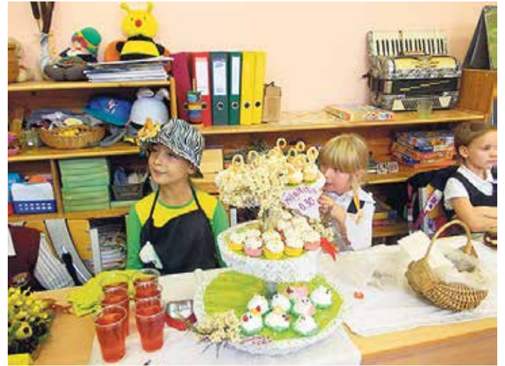
Miķeļdienas gadatirgū arī pašu gatavotie gardumi.

Sirsnīgā, krāšņā un latviskā noskaņā Saulkrastu vidusskolā ienāca Miķeļdiens ar bagātīgu gadatirgu, kuru ieskandināja Jumis ar interesantām ainiņām no Latvijas lauku sētas, ar jautriem aneides skatiem no Miķeļdienas gadatirgus. Tirdziņā viss bija kā pienākas: burzma, jautra mūzika, krāšņi saposušies tirgotāji un visdažādākās preces. Bagātīgs bija arī rudens velšu klāsts un pašu gatavotie gardumi.