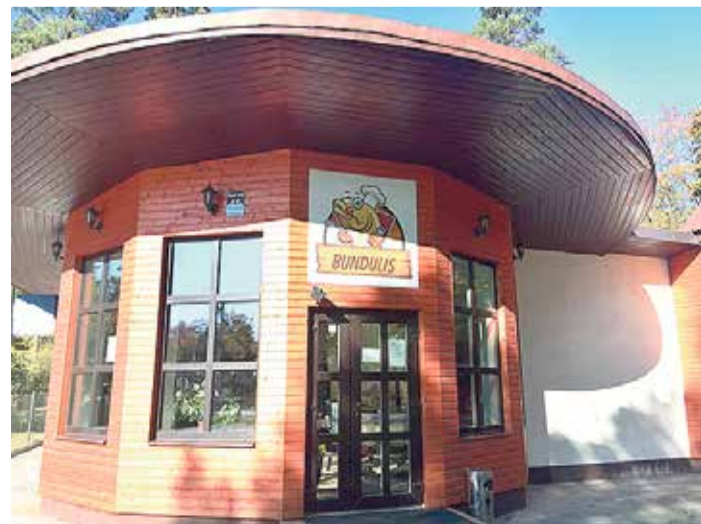
Plašāka informācija par uzņēmumu www.bundulis.lv .

No 3. novembra līdz 9. novembrim notiek Globālās rīcības dienas, kad ekoskolas un ekobērnodarzi rīkojas zaļi, piesaistot ar savu rīcību sabiedrības uzmanību dažādām vides aktualitātēm. PII „Rūķītis” bērni šajā nedēļā kopā ar audzinātājiem un vecākiem vāks ozolziļes Līgatnes dabas taku iemītniekiem.