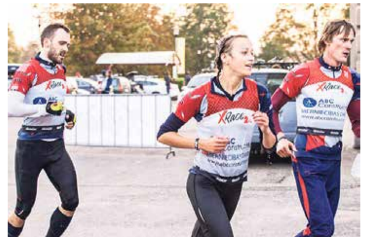
Peilānu uzvaras finišs.

Latvijas XRace sacensībās, kuras notika 5 kārtās no aprīļa līdz septembrim, ļoti pārliecino-