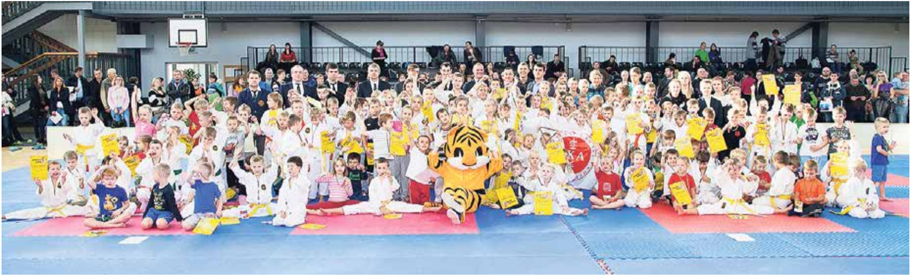
Karatē dienas dalībnieki.

25. oktobrī Saulkrastu sporta centrā norisinājās bērnu Sporta diena un LKA Karatē liga 2014-2. Sporta dienā piedalījās aptuveni 200 sportistu no visas