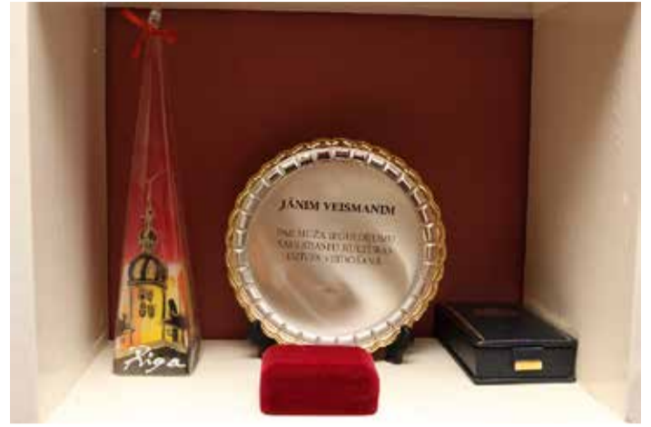
Triju Zvaigžņu ordeņa Goda zīme, kas saņemta no Valsts prezidentes Vairas Vīķes-Freibergas, un novada atzinības balvas