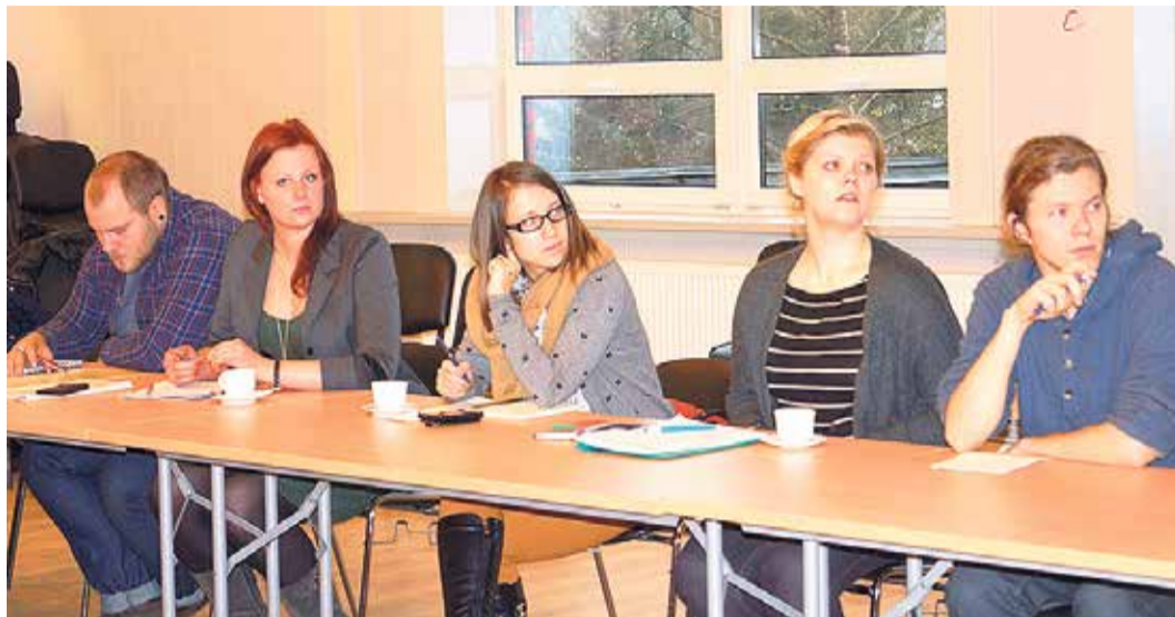
Studenti palīdzēs veikt Latvijā līdz šim nedarītu, unikālu darbu – izstrādās pašvaldības ilgtspējības ziņojumu.

30. oktobrī Saulkrastu novadā viesojās vides zinātnes maģistrantūras II kursa studenti – topošie zinātnieki un vides pārvaldnieki – no Latvijas Universitātes Ģeogrāfijas un Zemes zinātņu fakultātes.