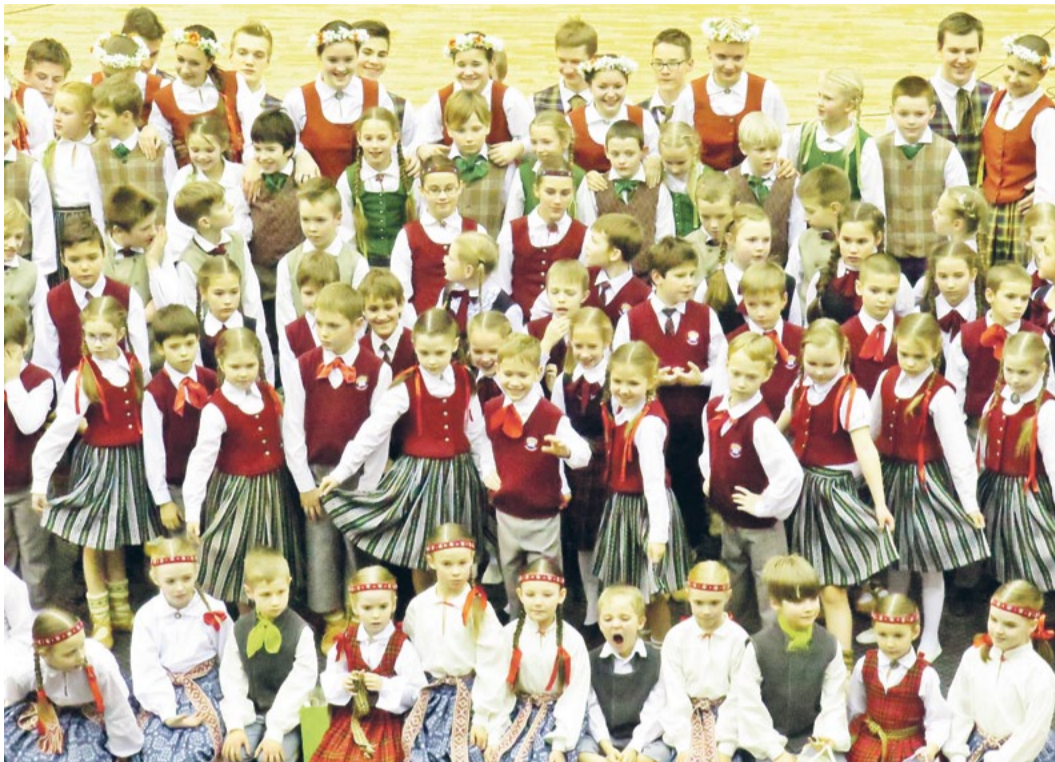
Draudzības koncerta dalībnieki.

23. janvārī Saulkrastu sporta hallē draudzības koncertā „Ceļā uz Skolu jaunatnes dziesmu un deju svētkiem” savus svētkus svinēja deja. Uz mirkli sporta halle pārvērtās, jo tajā valdīja grācija, emocijas, saskaņa, smaidi, prieka dzirksts, ko iededza skolēnu tautisko deju kolektīvi – Rīgas bērnu deju kopa „Kamolītis”, Liepupes 2. - 4. un 5. - 9. klašu tautisko deju kolektīvi „Liepupīte” un Saulkrastu vidusskolas 2. - 6. klašu dejotāji no „Saulītes”.