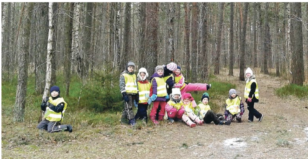
„Tinces” audzēkņi meža ekspedīcijā.