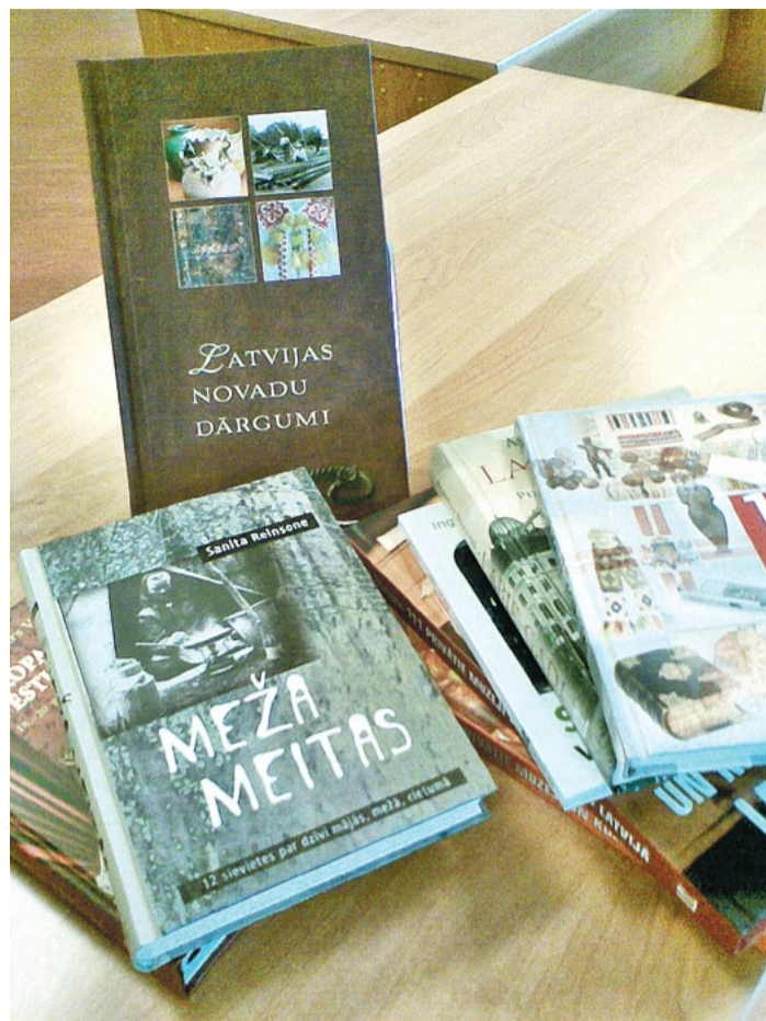
Saulkrastu bibliotēkas jaunās grāmatas.