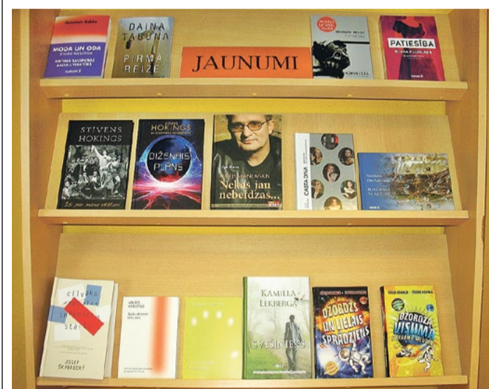
Jaunākās grāmatas Saulkrastu bibliotēkā.