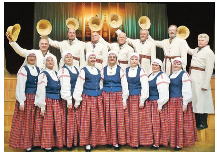
Saulkrastu senioru deju kolektīvam „Saulgrieži” projektā iegādāti jauni tautas tērpi.

Saulkrastu novada pašvaldības aģentūra „Saulkrastu kultūras un sporta centrs”, Eiropas Lauksaimniecības fonda lauku attīstībai (ELFLA) pasākuma „Lauku ekonomikas dažādošana un dzīves kvalitātes veicināšana vietējo attīstības stratēģiju īstenošanas teritorijā” 7. projektu iesniegšanas kārtā 2014. gada 9. aprīlī Rīgas rajona Lauku attīstības biedrībai iesniedza projektu „Pār deviņi novadiņi”.