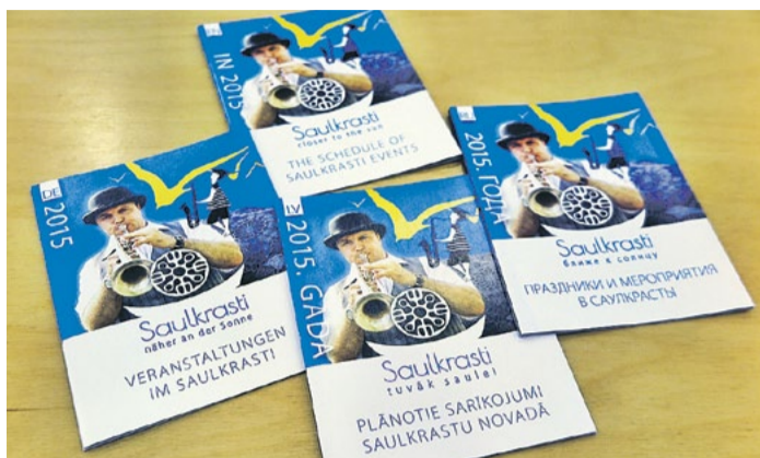
Saulkrastu sarīkojumu un sporta pasākumu kalendārs 2015. gadam.

Otrs izdots materiāls domāts kultūras un sporta sarīkojumu baudītājiem - Saulkrastu sarīkojumu un sporta pasākumu kalendārs 2015. gadam. Šogad plānoti vairāki saulkrastiešu un pilsētas viesu iemīļoti tradicionāli pasāku-