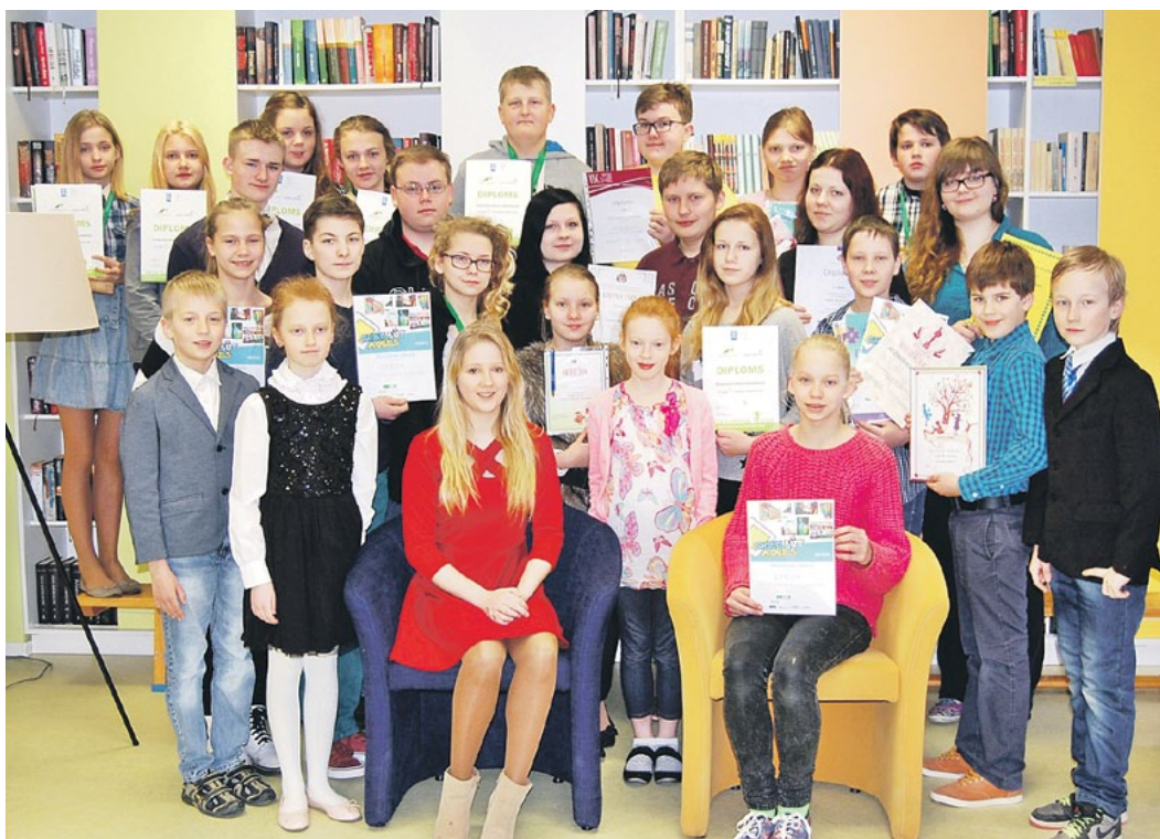
Godalgoto vietu ieguvēji.