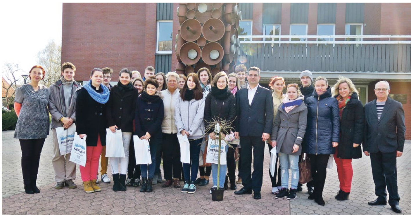
Saulkrastu vidusskolas delegācija ar Neringas pašvaldības pārstāvjiem.

Aprīļa nogalē Saulkrastu vidusskolas 10. un 11. klases skolēni devās atbildes vizītē uz Saulkrastu novada pašvaldības draudzības pilsētu Lietuvā Neringu. Krāšņā piejūras pilsēta sagaidīja ar spēcīgu, brāzmainu vēju un siltām pusdienām skolas ēdnīcā. Tikko bija atgūts možums pēc garā ceļa, skolēni devās orientēšanās sacensībās, kuru laikā bija iespēja iepazīt Neringu, Kuršu kāpu, apskatīt neparasto Tomasa Manna memoriālo muzeju, izstaigāt Zvejnieku etnogrāfisk-