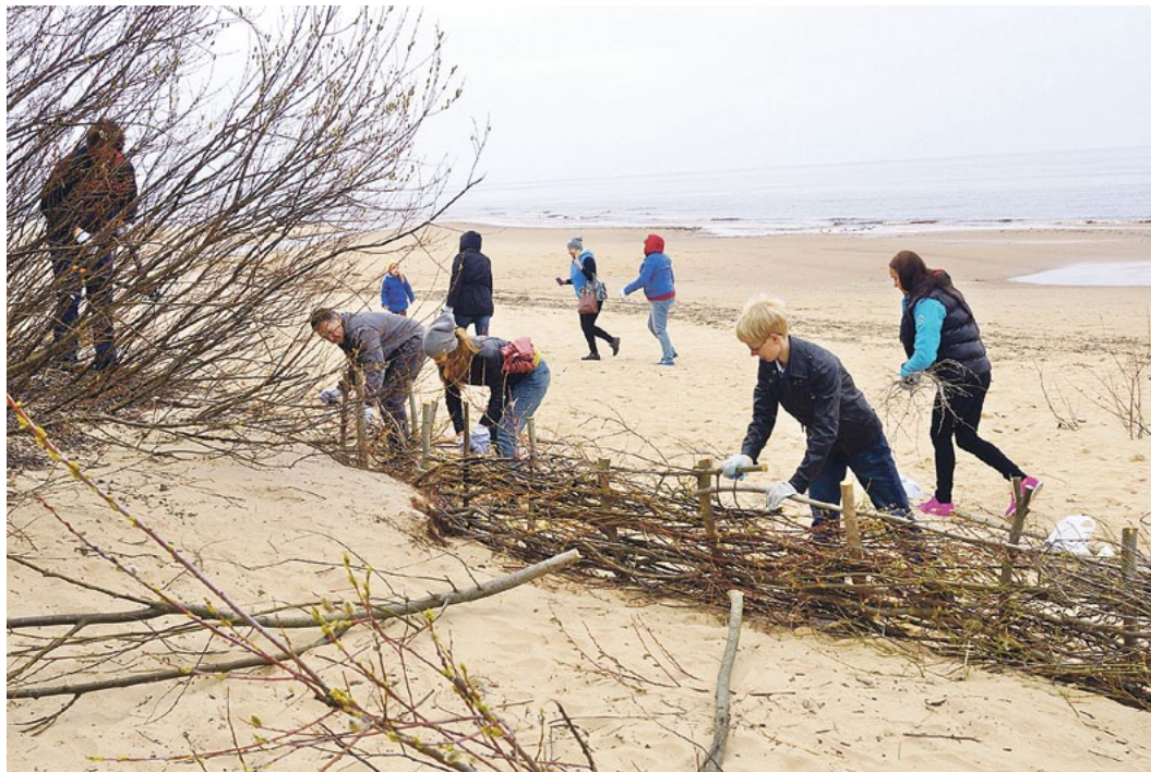
Talkotāji Saulkrastu Baltajā kāpā.

Lielā talka Saulkrastu Baltajā kāpā pulcināja pārsteidzoši lielu skaitu dalībnieku. Kopumā ieradās vairāk nekā 150 brīvprātīgo,