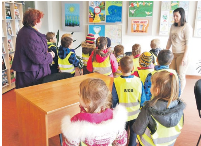
Bibliotēkas nedēļā mazie rūķiņi apmeklēja Saulkrastu bibliotēku.

Šogad PII „Rūķītis” bērni kuplā skaitā piedalījās Saulkrastu mazo dziedātāju konkursā „Saulkrastu