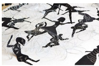
Fragments no VJMMS ekspozīcijas “Kustība”.

Valsts konkursa noslēguma pasākums, kas ik gadus ir gaidītākais, lielākais un profesionāli nozīmīgākais mākslas pedagogu saiets - mākslas pedagogu seminārs un audzēkņu konkursa dar-