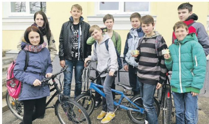
7. klases skolēni, kas ieguvuši velosipēda vadītāja apliecību.

krustojumi, kurus regulē policisti, kā arī krustojuma izbraukšana, ievērojot labās rokas likumu. Skolēni ar pasniedzēju izpēlēja vairākas situācijas, lai izprastu visus noteikumus, bet tad - laiks eksāmenam. Tas bija satraucošs mirklis, jo īpaši pašiem mazākajiem - 3. klases skolēniem. Daļai no viņiem vēl nemaz nav 10 gadu, tāpēc viņi pēc nokārtotā eksāmena apliecības vēl nesaņēma. Šiem skolēniem vēl jāsaņem desmitā dzimšanas diena, lai varētu saņemt pirmo satiksmes dalībnieka dokumentu. Eksāmenā bija gan