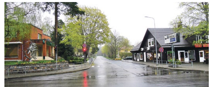
Raiņa iela savu vārdu nes jau vairāk nekā 65 gadus un uz tās atrodas gan Saulkrastu dome, Saulkrastu vidusskolas 1. - 4. klašu ēka, gan Saulkrastu bibliotēka, kafējnīcas un veikali.

Vēstures pētījumi liecina, ka šis radošais pāris mūsu jūrmaļu nav apmeklējis, tāpat viņi ir minimāli tikušies ar mūsu pusē dzīvojošām un strādājošām personībām. Taču Saulkrastu centrā viena no galvenajām ielām ir nosaukta Raiņa vārdā. Tā savu vārdu nes jau vairāk nekā 65 gadus un uz tās atrodas gan Saulkrastu dome, Saulkrastu vidusskolas 1. - 4. klašu ēka, gan Saulkrastu bibliotēka, kafējnīcas un veikali. Tādēļ arī šī gada Muzeju nakti pavadīsim, iepazīstot Raiņa ielu. Satiksimies ar uzņēmējiem, do-