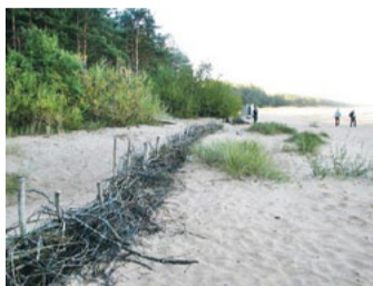
Lielajā talkā izveidots kārķu žogs.

Lai projektā varētu efektīvāk veikt Saulkrastu pilotteritorijas izpēti, plānots organizēt apmek-