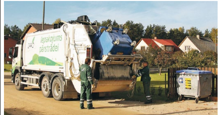
Konteineru tukšošana.

SIA ZAAO ikdienā intensīvi strādā pie modernas atkritumu apsaimniekošanas pakalpojumu nodrošināšanas un kvalitatīva klienta servisa sniegšanas. Lai uzzinātu vērtējumu uzņēmuma darbībai un sniegtajiem pakalpojumiem, klienti aicināti paust savu viedokli, aizpildot ikgadējo ZAAO klientu aptaujas anketu.