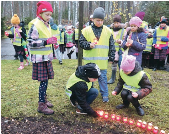
Kritušo karavīru piemiņas vieta Saulkrastu kapos.