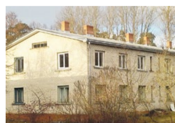
Ainažu ielā 70 ēka.

Sasaucot mājas dzīvokļu īpašnieku kopsapulci, vienbalsīgi tika nolemts, ka ēkai nepieciešams jauns jumts. Lai jumta maiņa tiktu paveikta labā kvalitātē un laikus - pirms rudens lietavu sākšanās, SKS nopietni atlasīja jumtu remonta darbu firmas, kas darbus var paveikt kvalitatīvi, ātri un par pieejamiem līdzekļiem.