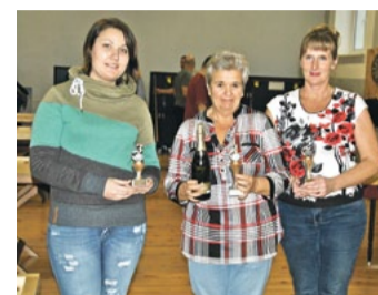
Godalgoto vietu ieguvējas dāmu konkurencē novusā.