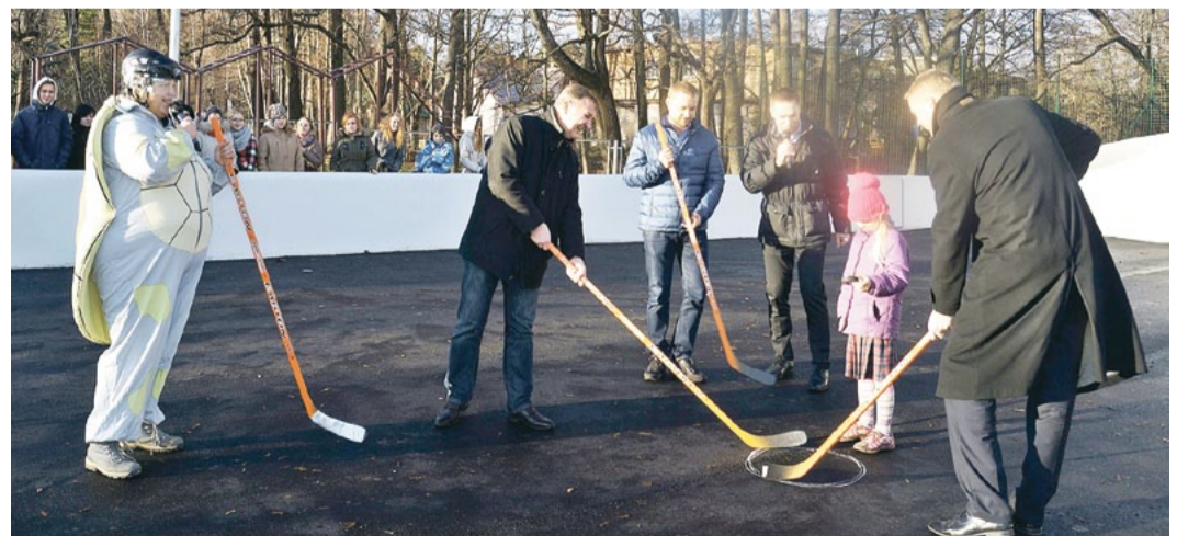
Pirms simboliskā pirmā iemetiena.

Kādreiz asfaltētā un jau sabrukušā sporta laukuma vietā tagad izveidots jauns asfalta seguma laukums, uz kura izbūvēta 15x30 m arēna ar 1 m augstām sānu malām. Arēnas galos izvietoti basketbola grozi, tās vidū ir noņemami stabi ar tenisa tīklu. Blakus arēnai izveidots ieskriešanās celiņš ar tāllēkšanas bedri. Ierīkota arī lietussūdens atvades