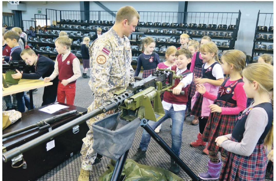
Karavīri stāstīja par savu ikdienas darbu, pienākumiem un prezentēja līdzpaņemtos ieročus.