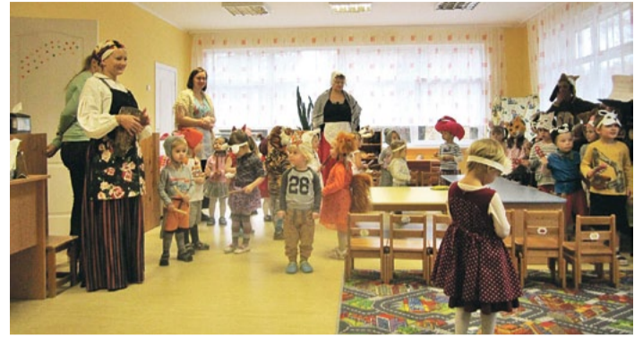
Mārtiņdienā pie “Ezišu” grupas ciemojas Zilites un Tinces.

Novembra sākumā PII Rūķītis piedalījās Ekoskolu programmas Rīcības dienās. Kopā ar vecākiem vācām makulatūru. Lai aicinātu Saulkrastu iedzīvotājus dzīvot zaļi, devāmies uz Saulkrastu sākumskolu. Dāvinājām kastani ar vēstījumu katram iestādīt koku, lai uzlabotu gaisa kvalitāti tuvākajā apkārtnē.