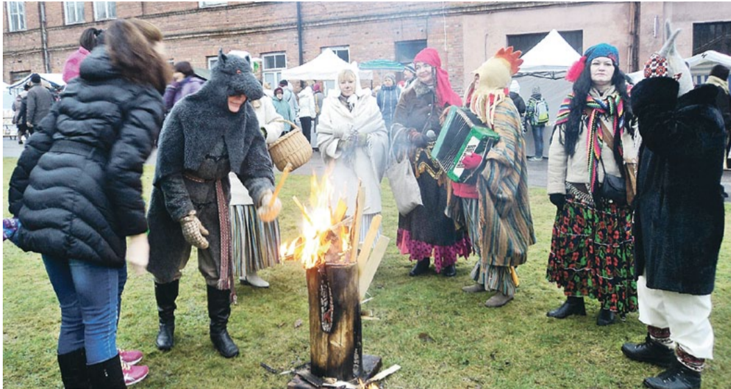
„Dvīga” Limbažos.

Ziemassvētki tautā dēvēti arī par Blūķa vakaru vai Kūķa vakaru (kūķis, koča – tradicionāls Ziemassvētku ēdiens).