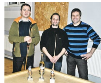
Labākie novusa spēlētāji.