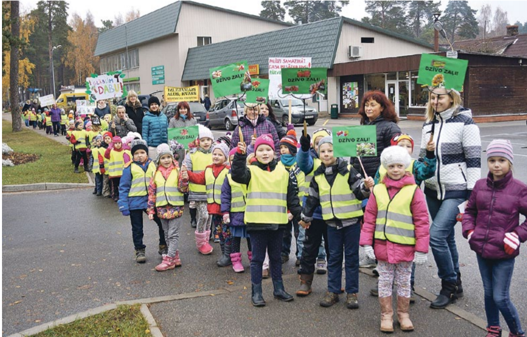
Rūķīši akcijas gājienā „Dzīvo zaļi”.