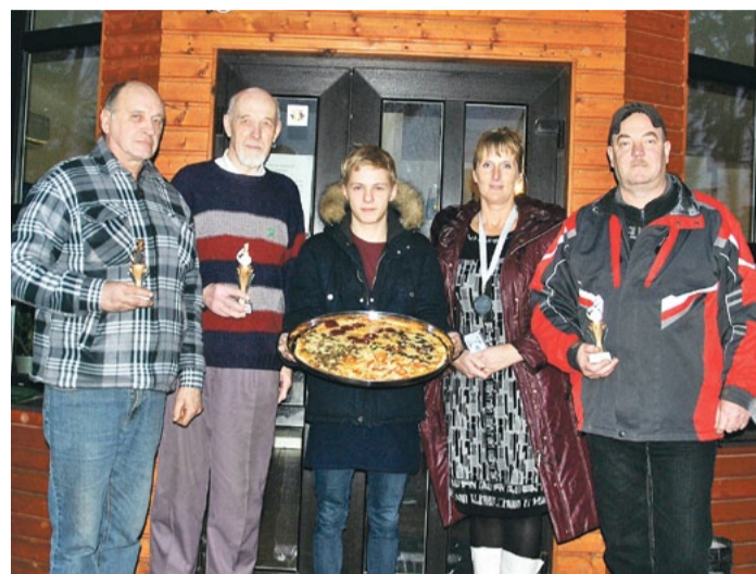
Paldies picērijai "Bundulis" par viesmīlību un gardo picu uzvarētājiem!

Gada nogalē, kā jau ierasts, tiek apkopoti rezultāti un apbalvoti labākie sportisti individuālajos sporta veidos.