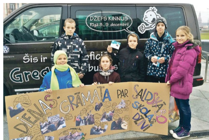
Vairāk nekā 100 plakātu konkurencē saulkraściešu veikums tika atzīts par vienu no desmit labākajiem darbiem.

Nav šaubu, ka mūsdienās visu vecumu cilvēki, bet īpaši bērni un jaunieši, lasa mazāk nekā pirms interneta un dažādo tehnoloģiju izgudrošanas. Neskatoties uz to, ik pa brīdim parādās kāds autors vai grāmatu varonis, kas spēj aizraut mūsdienu jaunatni un atkal pievērst to grāmatu lasīšanai. Viens no šādiem autoriem ir Džefs Kinnijs, kurš radījis ne daudz nikulīgā skolnieka Grega tēlu - viņa dzīve rit pavisam prozaiskā pusaudža ikdienas realitātē un tajā katrs var saskatīt ne daudz no sevis.