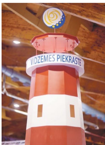
Saviļņojošā Vidzeme” - 5 pašvaldību – Alojās, Carnikavas, Limbažu, Salacgrīvas un Saulkrastu tūrisma informācijas centri šogad piedalīsies vairākās izstādēs.

Vidzemes piekrastes tūrisma klasteris „Saviļņojošā Vidzeme” izveidots, lai ar mērķtiecīgu darbu