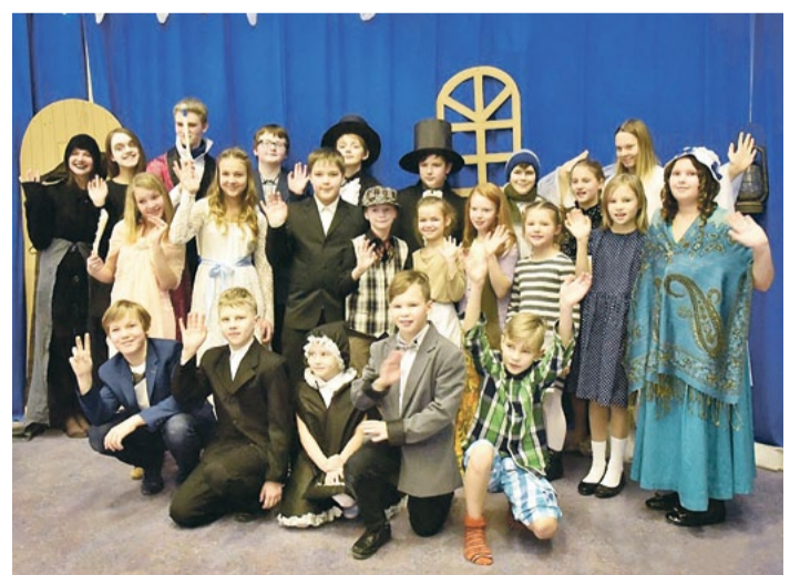
Svētku sarīkojuma “Ziemassvētku dziesma” dalībnieki.