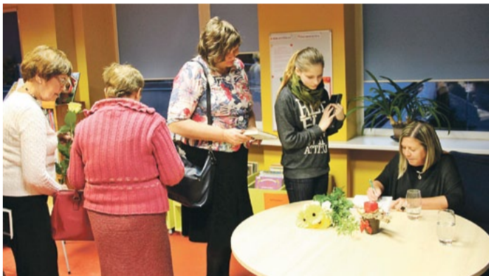
Nora Ikstena Saulkrastu bibliotēkā, parakstot grāmatas „Mātes piens” eksemplārus.

8. decembrī tikšanās ar rakstnieci Noru Ikstenu laikā un viņas jaunās grāmatas „Mātes piens” prezentācijā izvērtās dialogs starp autori un sanākušajiem interesentiem.