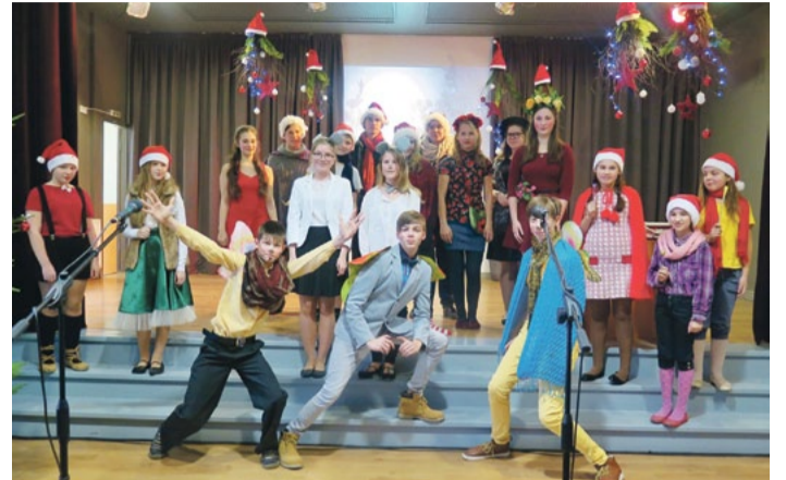
Uzvedums “Rūķu ciems” 5. - 12.kl.

Valsts 38. bioloģijas olimpiādes 2. posmā vidusskolu 10. - 12. klašu grupās katrā piedalījās vairāki nekā 500 skolēnu no visas valsts. Olimpiādes saturs ir sarežģīts - ar augstākām prasībām attiecībā uz