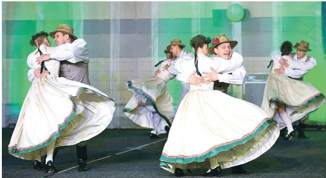
Festivāla deju dažādība un iespēja kopā izdejojot gan jaunas, gan labi zināmas dejas ir tas spēks, kas ik gadu pulcina dejojotājus no daudziem novadiem.

Jau piekto reizi martā Saulkrastos norisinājās tautas deju festivāls "Sasala jūrīna". Ik gadu tajā piedalās vairāk nekā 20 tautas deju kolektīvi no Garkalnes, Mālpils, Olaines, Stopiņiem, Ropažiem, Ādažiem, Krimuldās, Siguldās, Ogres, Carnikavas, Straupes, Skultes, Trikātas, Lim-