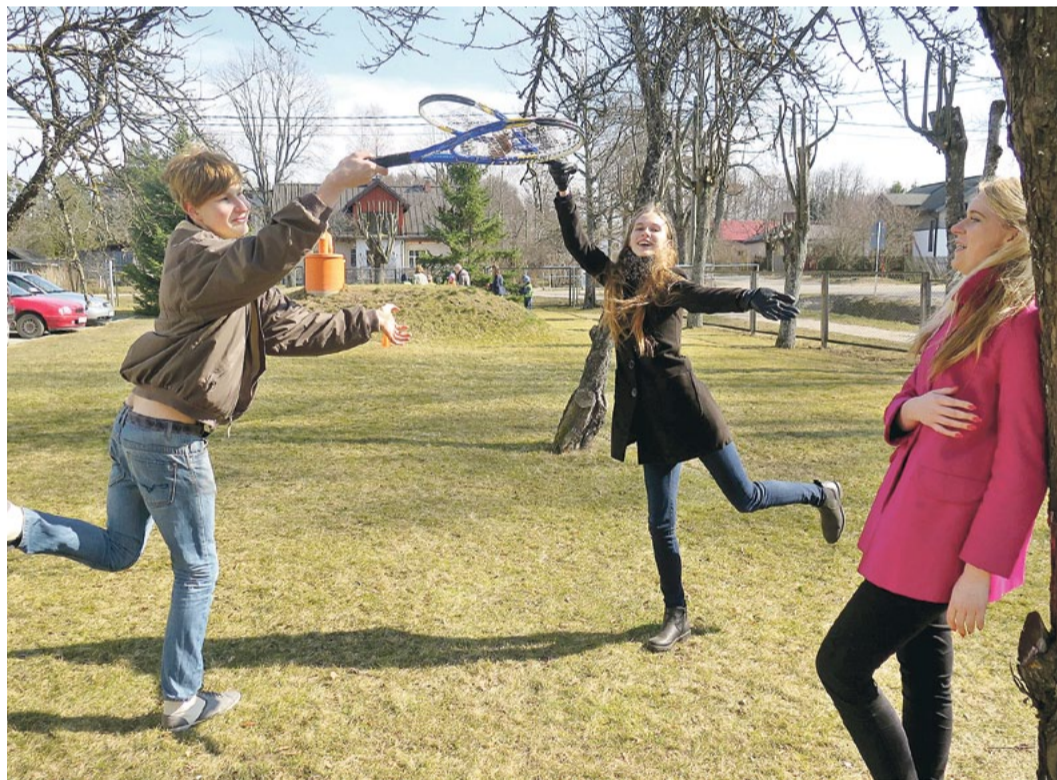
Saulkrastu vidusskolā aug jauni, interesanti, radoši, darboties gribīgi un sabiedriski aktīvi jaunieši.

Saulkrastu vidusskolā ieripojis pavasaris ar jautru un sirsnīgu Lieldienu jampadraci, ko saviem jaunāko klašu skolēniem sarūpēja Skolēnu mērija, kurā darbojas 8. - 12. klašu jaunieši.