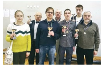
Čempionāta labākie.

Saulkrastu čempionāts šahā, veltīts Latvijas meistaram Jānim Kļaviņam, šogad pulcēja 51 dalībnieku no dažādām Latvijas vietām. Par uzvarētāju kļuva Arturs Bernotas. Mūsu Jānis Visockis izcīnīja 4. vietu kopvērtējumā