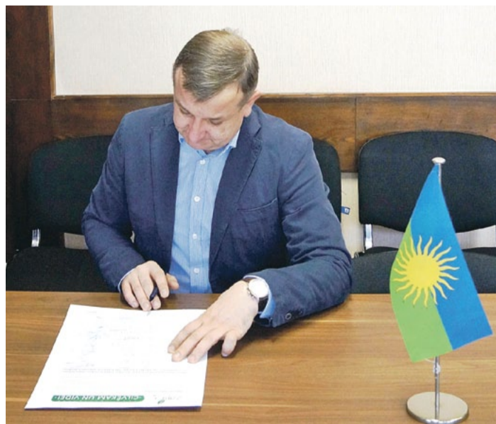
Apmēģanos strādāt pie kopīgās dāvanas Latvijai jau apliecinājušas 22 pašvaldības. Tagad arī Saulkrasti.

Savu darbu – dāvanu Latvijai tās 100. dzimšanas dienā - no maija vidus pieteikt www.100darbiLatvijai.lv . Visi labo darbu veicēji tiks sumināti, viņu vārdi tiks ierakstīti īpašās Latvijas simtgades liecībās, kas paliks vēsturē.