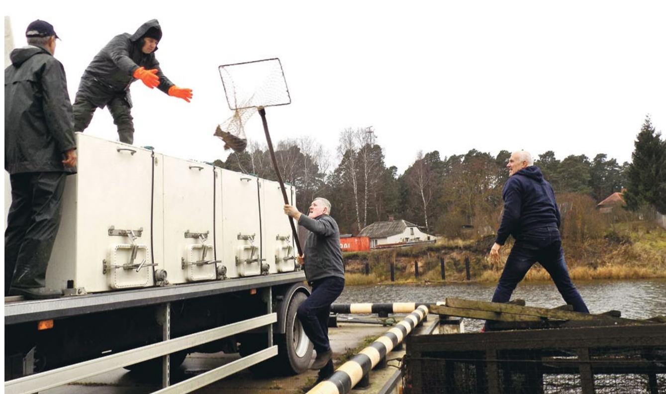
Taimiņu atdošana slaukšanai uz zivju audzētavu "Tome".

Veiksmīga sadarbība izveidojusies ar Valsts vides dienesta Valmieras un Lielrigas reģionālajām vides pārvaldēm, lai atbalstītu valsts zivju resursu aizsardzības iestādes un sniegtu palīdzību zivju resursu un vides aizsardzības kontrolei ciešā sadarbībā ar Valsts vides dienesta reģionālo pārvalžu kontroles sektoru inspektoriem. Projekta laikā tika veikti reidi