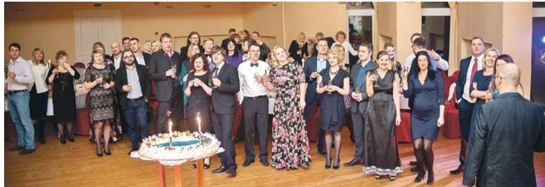
Visi pasākuma dalībnieki tika iedalīti divās komandās – „Saulainie” un „Kraisti”. Spēlē „Es mīlu Saulkrastus” uzvarēja „Saulainie”, kas saņēma uzvarētāju balvu – torti no kafējnīcas „Bemberi”.

Jau ziņojām, ka 2016. gads Saulkrastu Uzņēmēju konsultatīvajai padomei (SUKP) iesākās vareni – organizējam uzņēmēju konferenci un lielo balli, kurā piedalījās vairāk nekā 100 uzņēmēji. Tika pasniegtas balvas labākajiem uzņēmumiem – par gada Saulkrastu ražotāju apbalvoti uzņēmumi „Gardi G” un „Adi Hai”, par gada Saulkrastu pakalpojuma sniedzēju apbalvoti uzņēmumi „Costa del Sol” un „Easy sup”, par gada Saulkrastu jauno uzņēmumu atzīts uzņēmums „RK Spark”, bet par gada Saulkrastu tūrisma veicinātāju atzīts uzņēmums „Saulkrastu Velosipēdu muzejs”. Ballē tika izspēlēta aizraujoša spēle „Es mīlu Saulkrastus”.