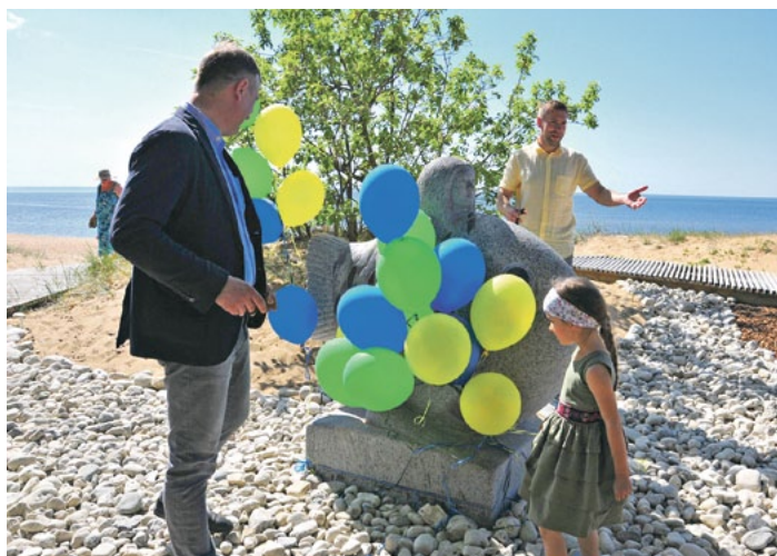
Vides objekta „Jūras puika” atklāšana.

Maija pēdējā sestdienā, kopā pulcējoties vairāk nekā 30 tūrisma informācijas centriem, mājražotājiem un amatniekiem no visiem Latvijas reģioniem, Saulkrastos notika III Latvijas tūrisma informācijas tirgus, kurā ikviens varēja baudīt dažādu novadu muzikālos priekšnesumus, iegādāties Latvijas amatnieku un mājražotāju produkciju, uzzināt par Latvijas novadu tūrisma piedāvājumiem.