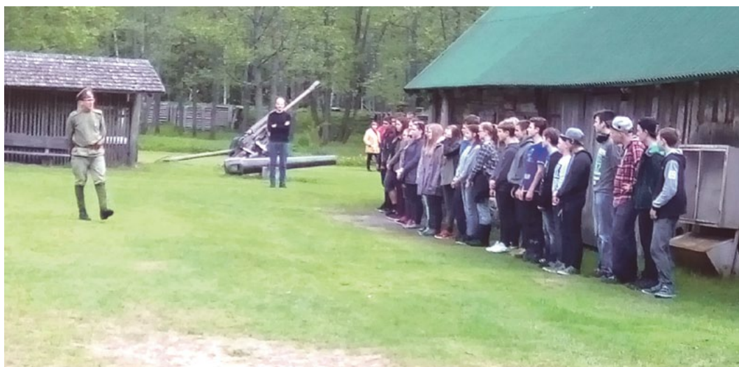
Skolēni Ziemassvētku kauju muzejā „Mangaļu” mājās.

Jau otro gadu Saulkrastu vidusskolas 8. klase piedalījās Monreālas Latviešu sabiedriskā centra atbalstītajā ekskursiju projektu konkursā „Pētīsim un izzināsim Latvijas vēsturi!”. Arī šoreiz guvām atbalstu savam projektam, kas paredzēja ekskursiju pa latviešu strēlnieku cīņu vietām. Iepazīnām ierakumu sistēmu,