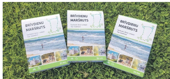
Brīvdienas maršruta buklets.

Sadarbībā ar Limbažu novada TIC un karšu izdevniecību "Jāņa sēta" gadatirgum tika sagatavots praksē pārbaudīts un iecienīts brīvdienas maršruta 1 - 2 dienām buklets „Saulkrasti - Bīriņi - Limbaži - Tūja - Saulkrasti”, kurā apkopota informācija par apska-