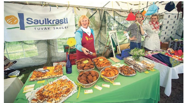
Saulkrastu „Superpīrāga” gardumi.