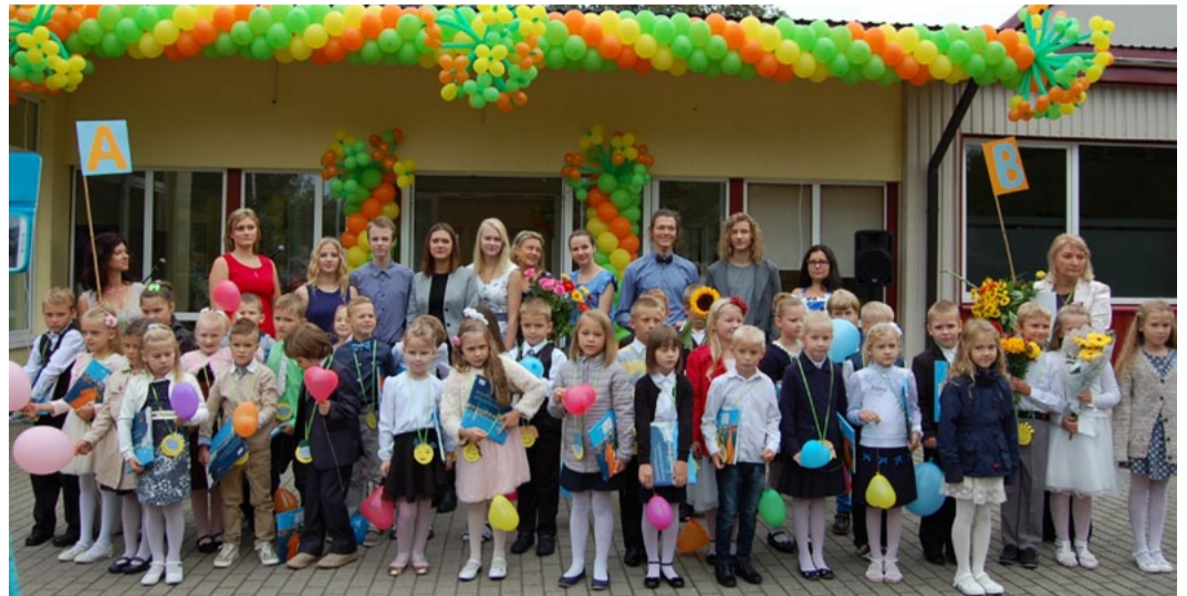
Zvejnieciema vidusskolas pirmklasnieki un izlaiduma klases skolēni un skolotājas.

Vidzemes jūrmalas Mūzikas un mākslas skolā mācības sāka 117 audzēkņi. Mūzikas izglītību apgūs 102, mākslas izglītību –