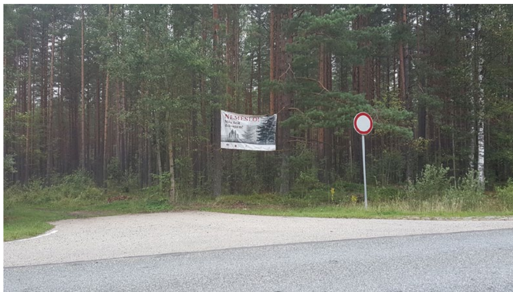
Baneri ceļa V101 malā, netālu no degvielas uzpildes stacijas „Lukoil”.

iedzīvotājam jāatceras, ka nevietā izmesto atkritumu apsaimniekošana notiek par pašu maksājumiem nodokļiem. Jo vairāk līdzekļu pašvaldībai jāatvēl negodprātīgu pilsoņu atstāto atkritumu savākšanai no mežiem, ceļmalām, ezeru krastiem un citām nepiemērotām vietām, jo mazāk naudas paliek dzīves telpas kvalitātes uzlabošanai. Piemēram, bērnu rotaļu laukumu un sporta laukumu izveidei, publisko peldvietu ierīkošanai. Turklāt šādas informatīvas kampaņas palīdzēs iedzīvotājiem veidot izpratni par vidi, kurā dzīvojam, kā izdarīt videi draudzīgākas izvēles un nepiesārņot to. Šāda pieeja ir daudz efektīvāka un motivējošāka nekā sodu piemērošana.