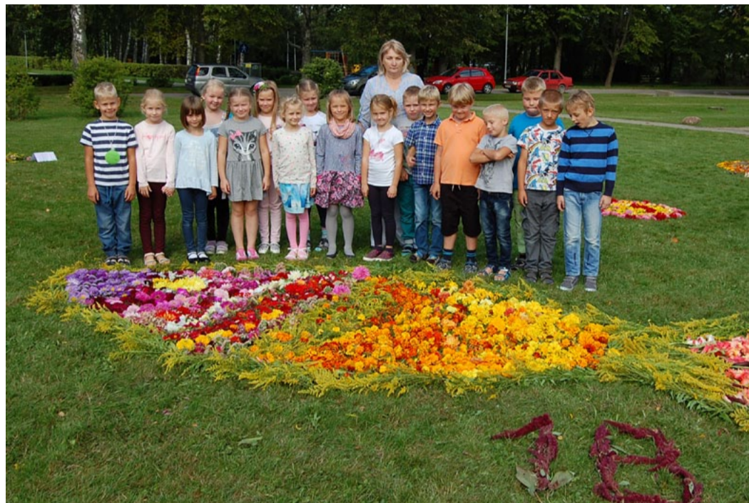
Zelta zivtiņas autori - 1.b klase.

Mācību gads tikko iesācies, gadalaiku ritumā rudens turpina nostiprināt savas pozīcijas, dārzeņus krāšņi rotājas dālijas, asteres, samtenes, gladiolas un citi ziedi, bet pie Zvejniekciema vidusskolas „atpeldējusi” Zelta zivtiņa : varbūt tādēļ, lai mēs atcerētos pasaku burvību un to, ka visu vēlmju un ieceru piepildīšanās ir katra paša ieguldītā darba rezultāts.