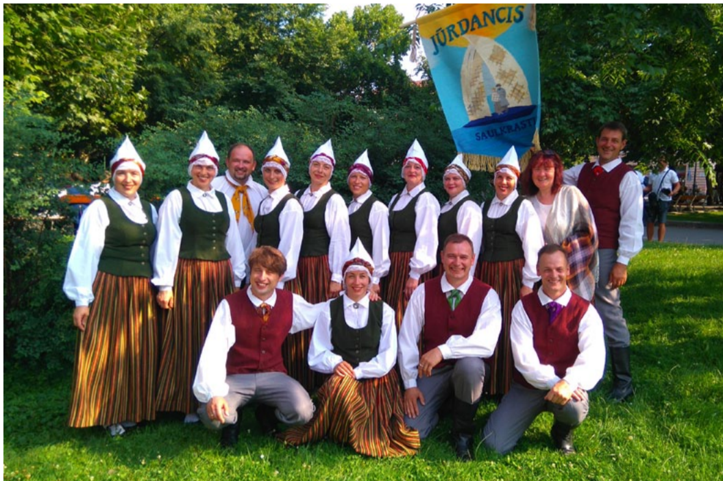
Vidējās paaudzes deju kolektīvs „Jūrdancis” Segedā Ungārijā.