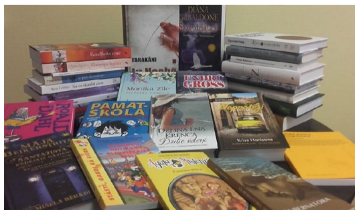
Bibliotēkas jauno grāmatu klāsts.

miem esam papildinājuši arī bibliotēkas krājumu: