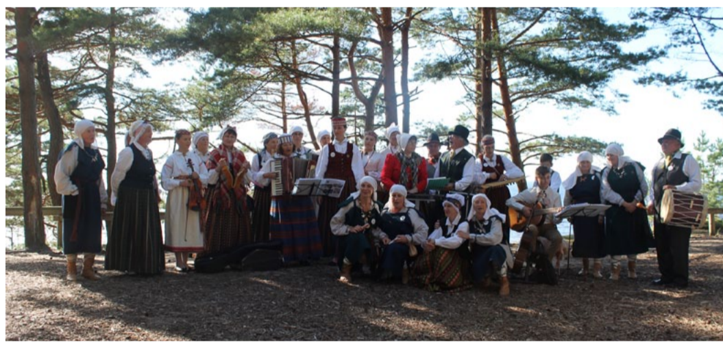
Muzicējot Baltajā kāpā. Publicitātes foto.

27. augustā Saulkrastos notika V folkloras festivāls „Pa saulei”, kas šogad pulcēja kuplu dalībnieku skaitu - festivālā piedalījās 8 folkloras kopas no visas Latvijas, kopumā aptuveni 90 dalībnieku. Folkloras kopas muzicēja vienlaikus vairākās Saulkrastu vietās un vakarā satikās kopkoncertā Saules laukumā. Pēc koncerta visi devās līdz jūras krastam, lai aizdegtu Senās uguns nakts ugunskuru un mirkli būtu vienoti ar tautām, ko vieno Baltijas jūra. Dziesmotais un vējainais vakars noslēdzās ar latvju danču programmu Saules laukumā! Festivāla foto - www.saulkrasti.lv .