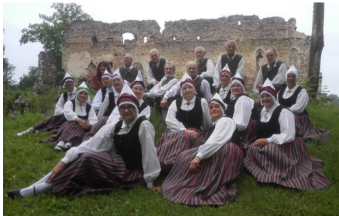
Senioru deju kolektīvs „Saulgrieži” pēc koncerta Raunā.

Saulkrastu novada deju kolektīviem aizritējusi notikumiem un koncertiem bagāta vasara. Dejots gan Saulkrastos, gan citur Latvijā, gan aiz mūsu valsts robežām. Visi trīs mūsu novada deju kolektīvi – jauniešu deju kolektīvs „Krustu šķērsu”, vidējās paaudzes deju kolektīvs „Jūrdancis” un senioru deju kolektīvs „Saulgrieži” – 4. jūnijā piedalījās Pierīgas deju svētkos „Atkal vienā vainagā” Baldones estrādē. Todien kopā sadoja bijušā Rīgas rajona deju kolektīvi. Kolektīvi Saulkrastos dejujuši gan sarīkojumā „Ieripo Saulkrastu vasarā”, gan Luču svētkos, Jāņu ieligošanas sarīkojumā un Saulkrastu svētkos.