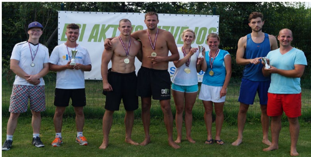
Sacensību „Esi aktīvs „Aizvējos”” komandu dalībnieki.