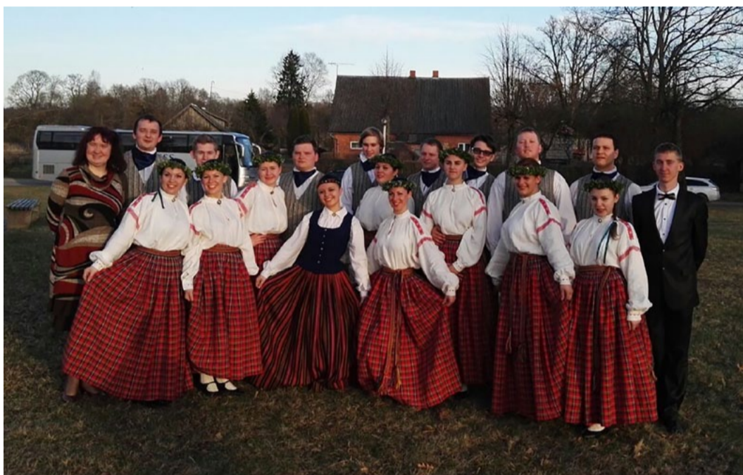
Jauniešu deju kolektīvs „Krustu šķērsu” pēc skates Lēdurgā.

darbības gadu laikā bija pirmais koncertbrauciens uz starptautisku festivālu ārzemēs, pirmā šāda veida pieredze un gandarījums par paveikto.