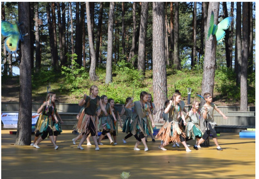
Fitnesa diena Saulkrastos. 1. - 4. klase.