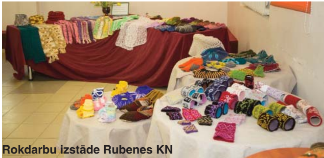
Rokdarbu izstāde Rubenes KN

Latvijas neatkarības atjaunošanu svinot un Latvijas simtgadi sagaidot, Jēkabpils novadā un visā Latvijā maija sākumā tika svinēti Baltā galdauta svētki.