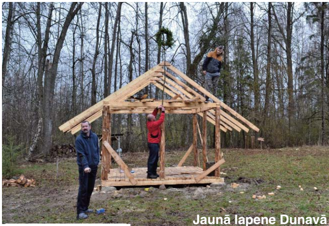
Jaunā lapene Dunavā