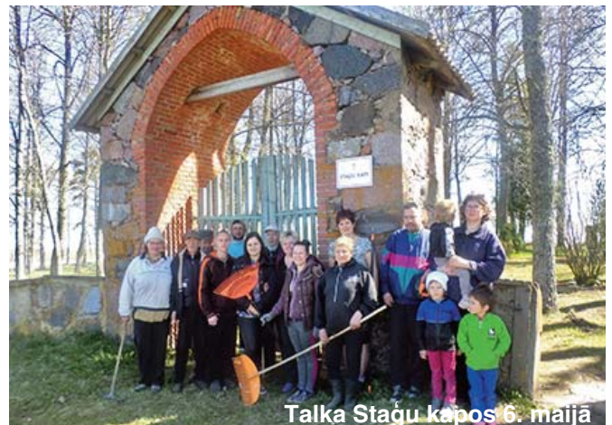
Talka Staģu kapos 6. maijā