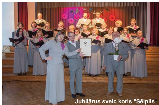
Jubilārus sveic koris "Sēlpils"