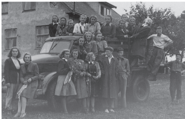
Pirmais izlaidums rudens talkā.

cauri lielajam valsts mežam dažreiz vienatnē, kas ne reizi vien iedvesa paniskas bailes.