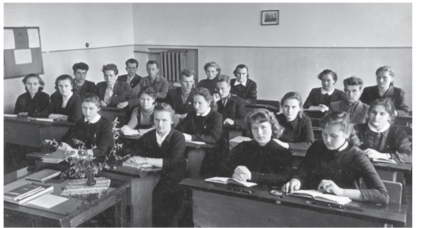
Septītais izlaidums skolas solos.