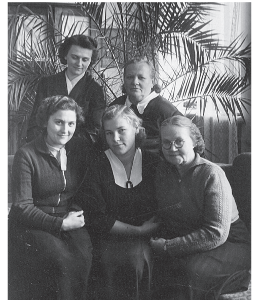
Skolotājas ap 1960. gadu.