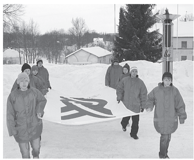
Olimpisko spēļu karogu nes Ērgļu vidusskolas sportisti.

Pie skolas norisinājās spraiņa cīņa, cīņa uz slidām un nūjām. Hokeju paskatīties sanāca tikai ar tādu - garāmģājēja aci. Bet vienmēr esmu apbrīnojusi šo sporta veidu. To, cik ļoti vienotiem ir jābūt, lai aizslidotu uz uzvaru. Lielāko pirmās dienas sacensību laiku pavadīju, vērojot biatlona sacensības. Jā, lai nu cik tas mulktīgi skanētu, arī slēpošana mani vienmēr ir fascinējusi. Skatoties no malas, kā sportisti burtiski lidoja uz slēpēm, tas izskatījās tik vienkārši, tik elementāri. Vērojot, kā sportisti šāva pa mērķiem, sapratu, ka sports - tā ir veiksmē, tās ir sagādīšanās. Protams, lielā-