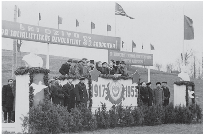
Svinīgais mītiņš 1953.g. pie Burtnieku skolas.