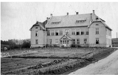
Burtnieku skolas priekšā kādreiz bija plašs izmēģinājumu lauks.

Pēc Ērģļu vidusskolas beigšanas iestājos Daugavpils Pedagoģiskā institūta Fizikas un matemātikas fakultātē. Augstskolu pabeidzu 1968.gada pavasarī un saņēmu norīkojumu darbā uz Cesvaines internātskolu. Tur man piedāvāja audzinātājas darbu 3. klasē, no kā es atteicos. Pēc tam Vestienas astoņgadīgajā skolā nostrādāju 6 gadus un pārgāju strādāt uz Madlienas astoņgadīgo skolu, kura 1972. gadā kļuva par vidusskolu. Te esmu nostrādājusi 42 gadus, mācot matemātiku, reizēm arī fiziku. 2009.gada vasaras notikumi pieļika punktu manai pedagoģiskajai kar-