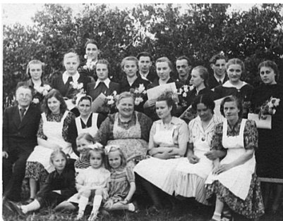
2. izlaiduma audzēkņi kopā ar tehniskajiem darbiniekiem.

jerai. Skolai esmu veltījusi 48 savas dzīves gadus.