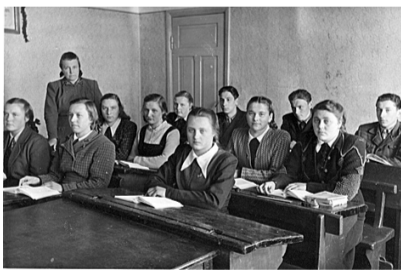
10. klase 1954. gadā