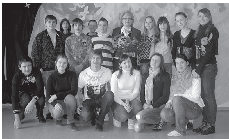
9.a klase kopā ar audzinātāju.