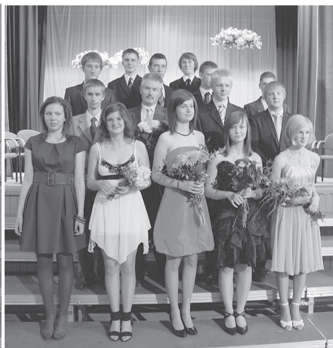
9.b klase izlaidumā.