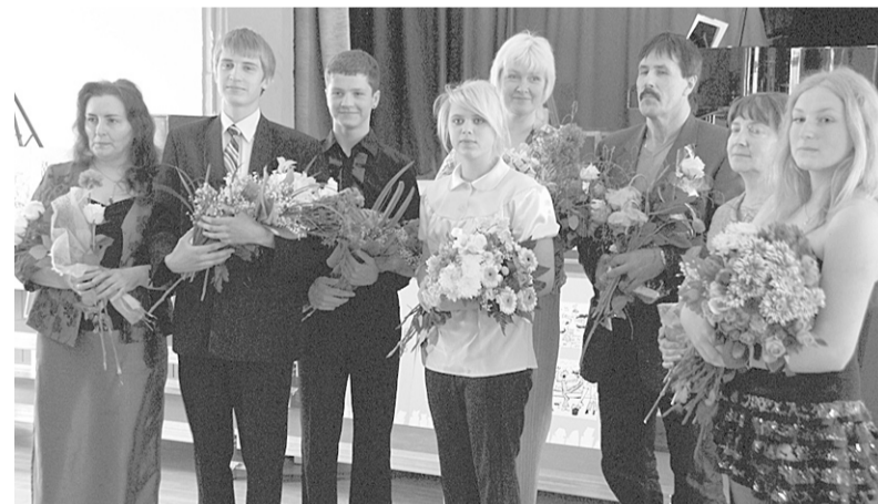
2010. gada mūzikas nodaļas absolventi ar pasniedzējiem.