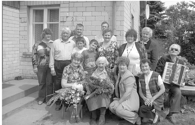
Gaviļniece viesu lokā.