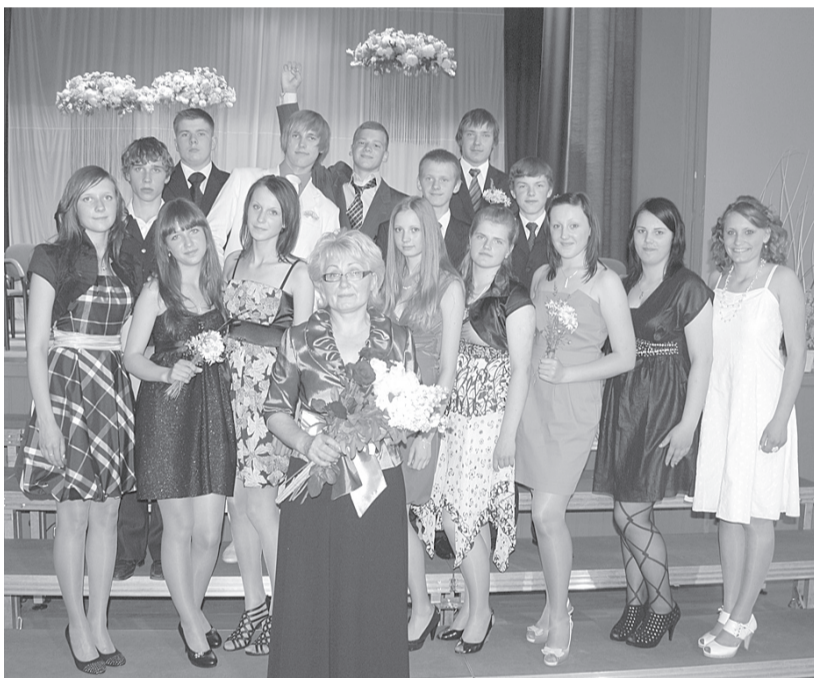
9.a klase izlaidumā.