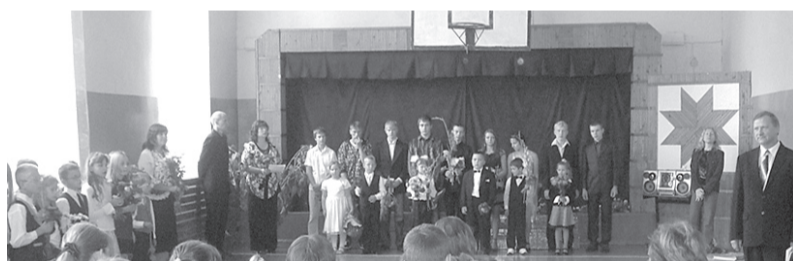
Jāņa Zāliša Sausnējas pamatskolā mācīsies 66 skolēni. Zināšanas mācīs 12 skolotāji, par bērniem rūpēsies 8 tehniskie darbinieki. Pirmsskolas apmācības grupā uzturēsies 12 bērni 3 pedagogu un tehniskā darbinieka uzraudzībā.