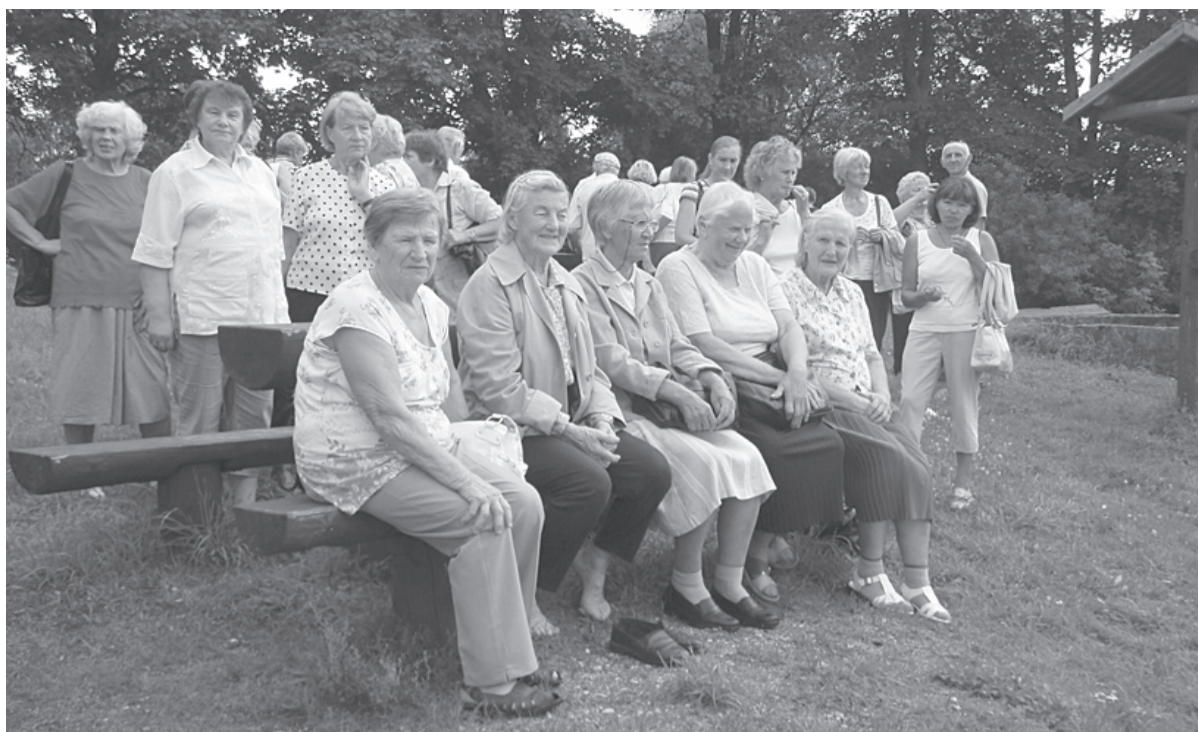
Priecājoties par Abavas senleju Vīnalknā.

Salonā skan klusas sarunas, kad apmēram pusceļš ir nobraukts, sāk līt, gāž kā ar spaiņiem. Kača domās lūdza, lai tik nelītu, kad būs pirmais apskates punkts. Un tik tiešām, kad aiz kalniņa parādās divi tornīši, pie debesīm sāk mirdzēt saulīte. Ceļotāji dodas aplūkot Jaunmoku pili. Pils ir krāšņa, liela, istabās ir daudz ko redzēt. Tiek dota viena stunda pils apskatei. Pēc noteiktā laika