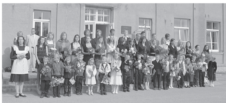
Ērgļu vidusskolā mācības uzsākuši 265 skolēni 28 pedagogu un 12 tehnisko darbinieku vadībā.