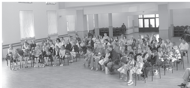
Ērgļu mākslas un mūzikas skolā prasmes mūzikas nodaļā apgūs 27 audzēkņi un mākslas nodaļā 45 audzēkņi, speciālo zināšanu apguvi nodrošinās 9 pedagogi un tehniskais darbinieks.