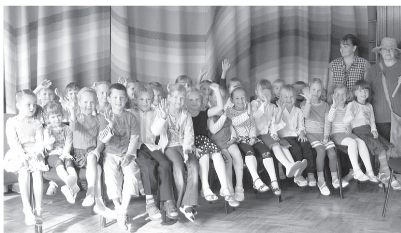
Pirmsskolas izglītības iestādē „Pienenīte” zināšanās skolosies 112 audzēkņi, par viņiem rūpēsies 13 pirmsskolas izglītības skolotāji un 13 tehniskie darbinieki.