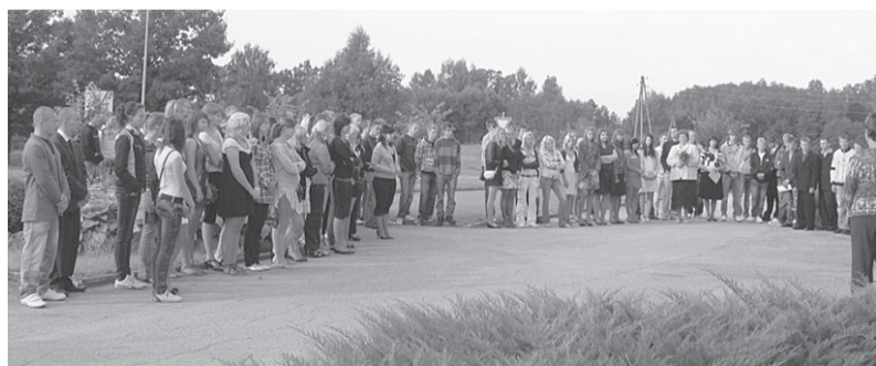
Ērgļu arodvidusskolā profesiju apgūs 166 audzēkņi, kurus zināšanās un prasmēs virzīs 29 pedagogi un par viņu labsajūtu rūpēsies 21 tehniskais darbinieks.