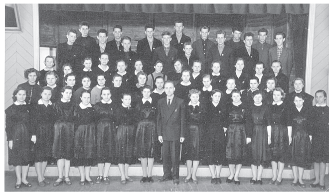
Ērgļu vidusskolas jauktais koris 1960. gada pavasarī.