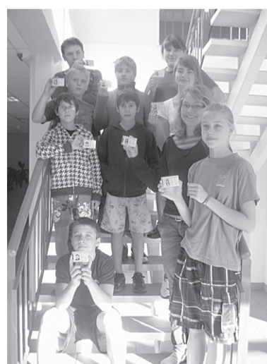
7.klases skolēni saņēmuši savas godam nopelnītās velosipēdista apliecības.