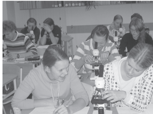
Darbs ar modernajām tehnoloģijām.

Kopējā summa 40 090.19 LVL, piegādātāji – apvienība: SIA „TCon”, SIA „GT 19”, SIA „ATEA”, SIA „Ventspils Digitālais centrs”, SIA „Lielvārds”. Katrs dabas zinību mācību kabinets saņēma arī specifiskus mācību līdzekļus – fizikas kabineta aprīkojumu veido komplekti – elektrostātiskā indukcijas mašīna ar piederumiem, funkciju ģenerators,