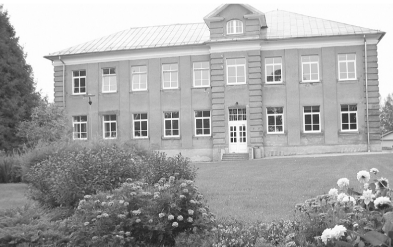
Ērgļu vidusskola 2010. gada septembrī.

18. septembrī košo kļavkoku ieskauda Ogres krastā Tu sagaidīji tuvus un tālus ciemiņus savā 60 gadu jubilejā. 57 izlaidumos 1675 absolventi. Vai tas ir daudz vai maz Tavā skolas mūžā?