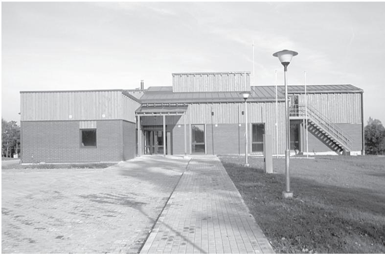
Jaunais Jumurdas pagasta saietu nams.