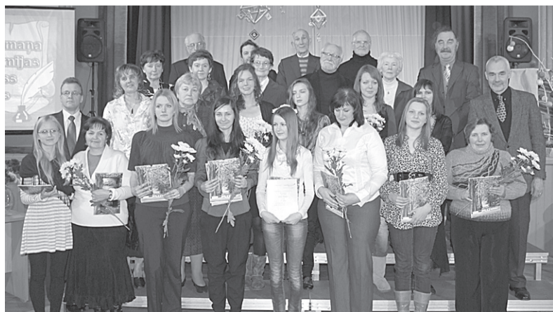
Konkursa laureāti ar skolotājiem un žūriju.