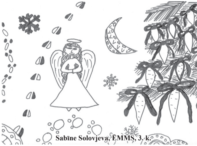
Sabīne Solovjeva, ĒMMS, 3. k.

Sniedzīņ, sniedzīņ, ak tu viens! Bērniem esi lielais prieks. Slēposim un slidosim, sniegavīrus savelsim, sniega pilis uzcelsim.