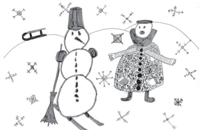
Rimants Stankevičs, ĒMMS, 3. k.