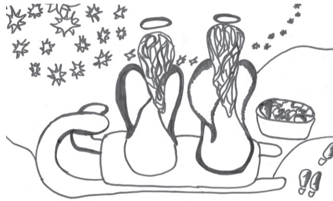
Monta Kurzemiece, ĒMMS, 3. k.