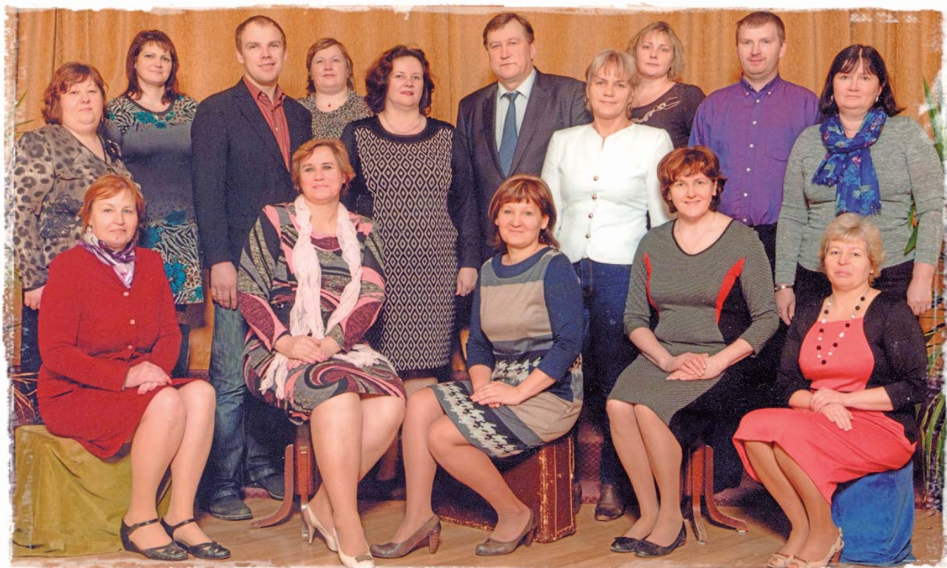
Mazzalves pamatskolas pedagogu kolektīvs piedalās jaunā mācību satura aprobācijā

Izglītības un zinātnes ministrija ir atlasījusi 100 no 235 izglītības iestādēm, ko pašvaldības no visas Latvijas nominēja dalībai mācību satura aprobācijā projekta Nr.8.3.1.1/16/I/002 "Kompetenču pieeja mācību saturā" ietvaros. Tās būs pirmās pirmsskolas izglītības iestādes un skolas, kurās ar projekta atbalstu skolotāju