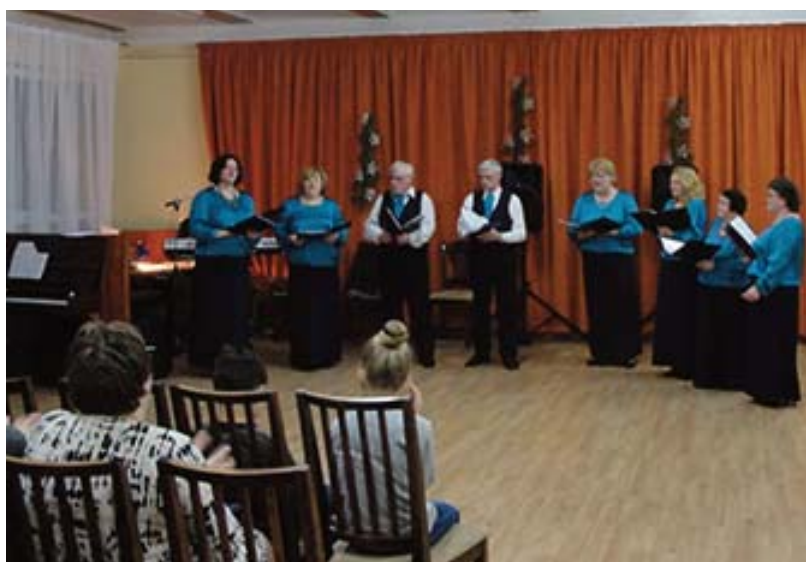
10.martā Mazzalves pagasta zālē pulcējās pašdarbnieki uz tradicionālo pasākumu, kurā atskatījās uz aizvadītajā sezonā paveikto

Pēc koncerta, nedaudz padejojuši grupas “Zemeņu lauks” vadībā, katrs Mazzalves pašdarbības kolektīvs parādīja savu radošumu, prezentējot mājas darbu – atraktīvi muzikālos skečos parādot, kāda ir sieviete īsu brīdi pirms iemīlēšanās, īsu brīdi