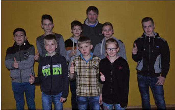
Mazzalves pamatskolas florbola komanda