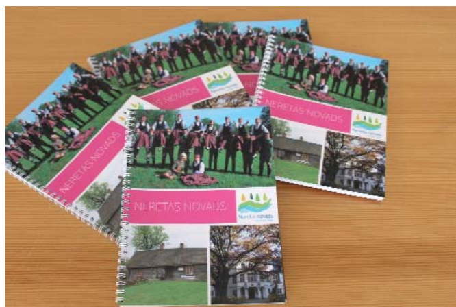
Neretas novada tūrisma bukletā atrodama informācija par mūsu novadu – pašvaldības iestādēm un notikumiem, tūrisma objektiem, naktsmītnēm u.c.

Krāsainais, ar fotogrāfijām bagātais izdevums ietver īsu, kodolīgu informāciju par Neretas novada skolām, bibliotēkām, biedrībām, kultūras pasākumiem, pašdarbnieku kolektīviem, baznīcām, Ērberģes un Pīlkalnes muižu, Jāņa Jaunsudrabiņa muzeju "Riekstiņi", Strobuku un Muldenieku pilskalniem, sarakstu un ilustratīvu materiālu par piemiņas vietām u.c. Tāpat pieejama īsa, koncentrēta informācija par Neretas novada viesu mājām un to piedāvātajiem pakalpojumiem. Brošūrā atrodamas arī precīzas norādes par katra objekta un iestādes atrašanās vietu un sazināšanās iespējām – adrese, telefons, e-pasts, kas ceļotā-