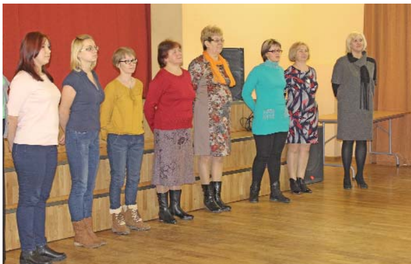
Neretas kora dalībnieces ievingrina balsis