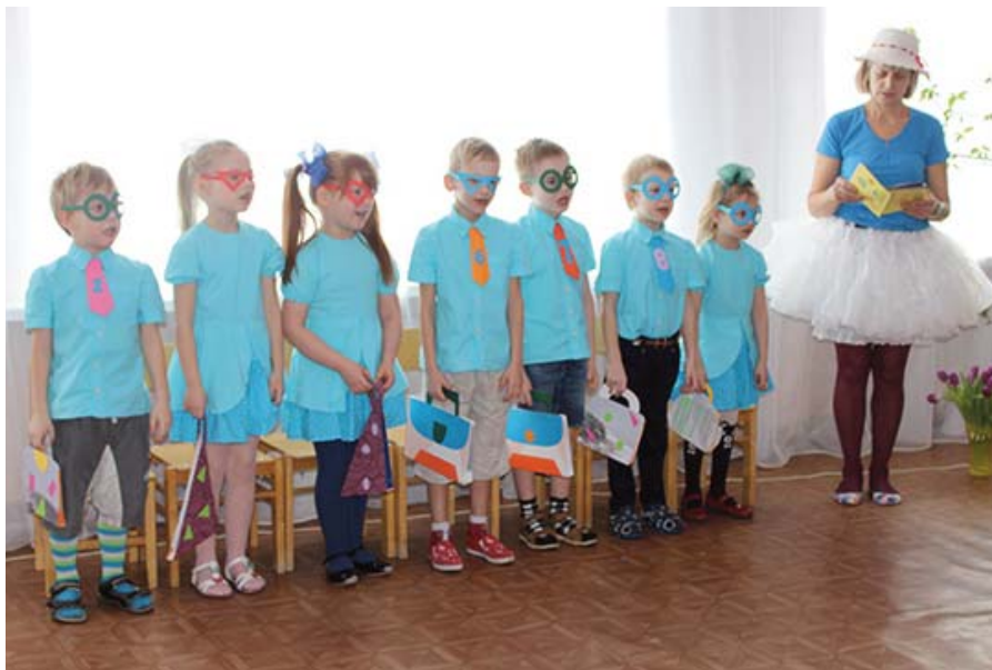
Pirmā desmitnieka svētkos bērni bija iemācījušies daudz dažādu dzejoļu un dziesmu, kas saistītas ar skaitļiem

Ciparu svētkus krāšņoja bagātīgs daudzums dzejoļu un dziesmiņu, kas saistīti ar skaitļiem, - bērni atraktīvi izdejoja