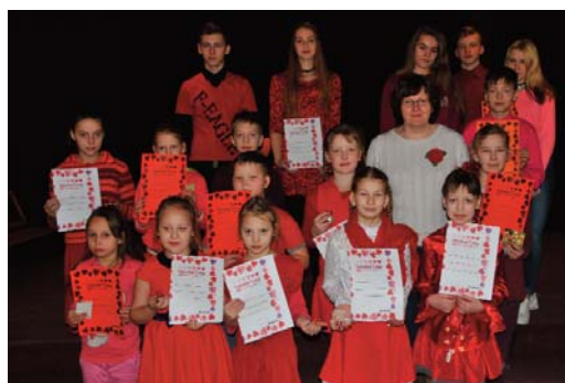
14.februārī Mazzalves pamatskolas skolēni atzīmēja Valentīndienas svētkus

Bet tieši 14. februārī skolēni tika aicināti ierasties sarkanos apģērbos. Aktīvākie izrādījās 2. un 9. klases skolēni.