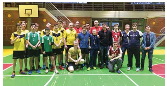
Volejbolisti visās spēlēs demonstrēja meistarību un cīnījās par katru punktu