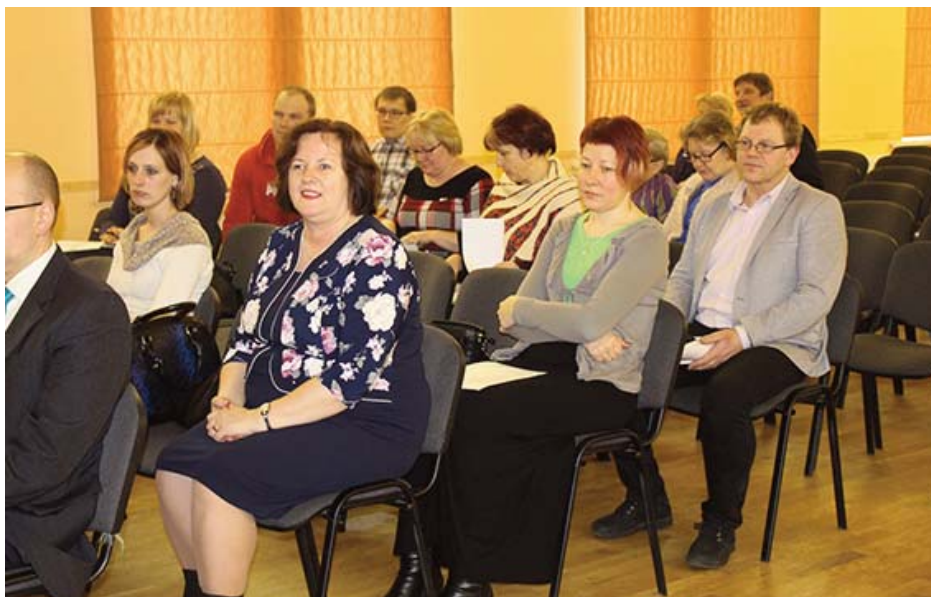
Uzņēmēji, pašvaldības pārstāvji un biznesa ideju autori 15. februārī Neretas kultūras namā piedalījās Jēkabpils Biznesa inkubatora rīkotajā seminārā