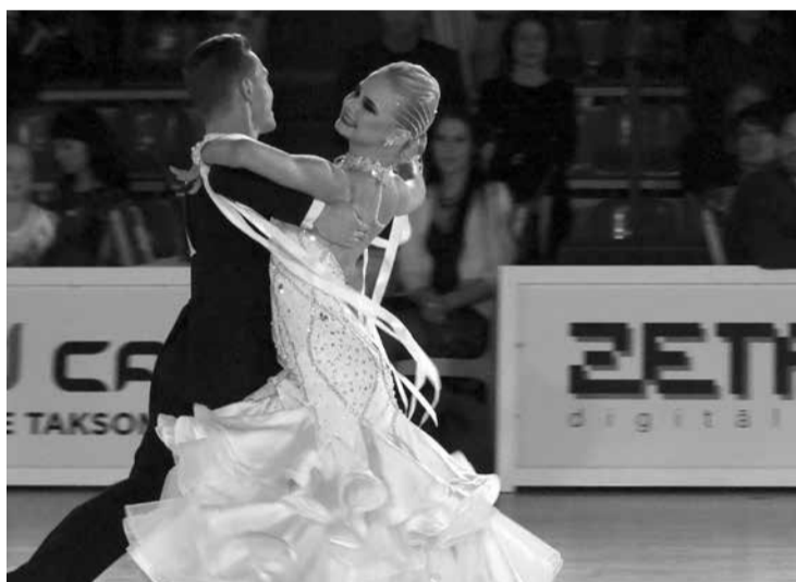
Šis uzvarētāju pāris pārspēja gravitāciju! Viņi patiesi ir sadejojušies.