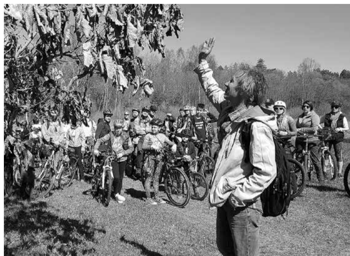
Velobraucēji uzmanīgi klausās gida stāstījumā.