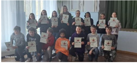
Augstkalnes bibliotēkā Norisinājās Nacionālās skaļās lasīšanas sacensības pirmais posms.