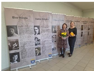
Krimūnu bibliotēkā Projekta izstādes "Latvijā ievērojami cilvēki Krimūnu pagastā" atklāšana.