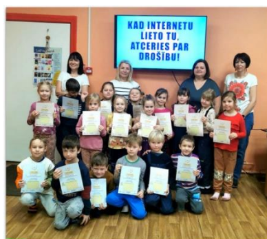
Auces pilsētas bibliotēkā Nodarbība par drošu internetu – PII Pīlādžītis.