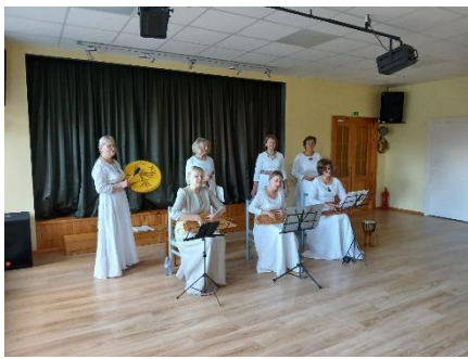
Ukru bibliotēkā Spēka dziesmu sadziedāšanās kopā ar Gaismas ģimeni “Baltās dūjas”.