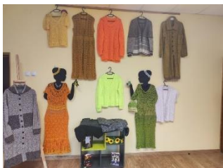
Zebrenes bibliotēkā Zebrenieces Mārītes Eņģeles adījumu un tamborējumu izstāde.