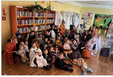
Jaunbērzes bibliotēkā Helovīnu pasākums.