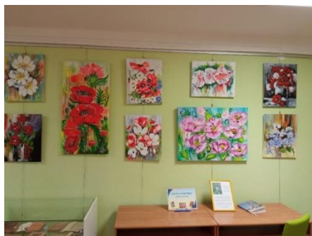
Annenieku bibliotēkā A.Štolceres gleznu izstāde.