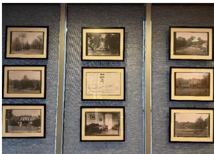
DNCB Biedrības Penkule atver durvis veidotā seno fotogrāfiju izstādē Ālaves muiža “BIJA, IR, BŪS”.