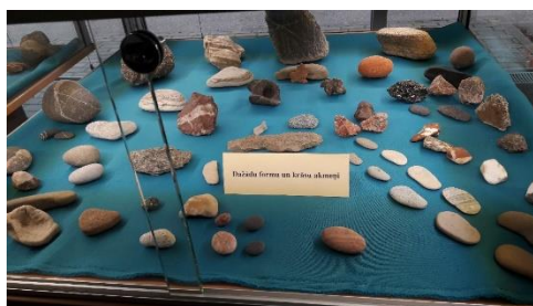
DNCB Fragments no Artūra Kazimiraīša akmeņu kolekcijas izstādes "Akmeņi, akmentiņi".