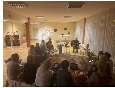
Jaunbērzes bibliotēkā Dzejas dienai vēlētās pasākums, "Randiņš ar dzeju saulrietā".