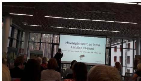
DNCB Latvijas bibliotekāru Novadpētniecības konferencē, Jūrmalas centrālajā bibliotēkā.