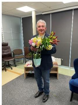
DNCB Tikšanās ar aktieri Gundars Āboliņš.