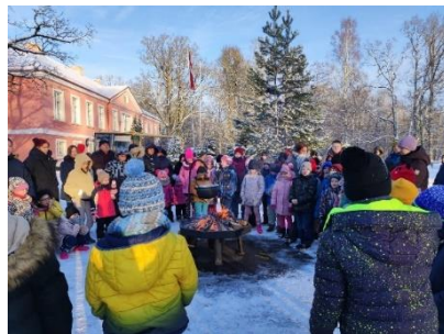
Zebrenes bibliotēkā Pie Bikstu pamatskolas rīkotais pasākums atceroties 1991.gada 16. janvāra Barikāžu laiku.