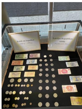
DNCB Fragments no dobelnieka Edgara Šenkeviča kolekcijas izstādes "Naudas zīmes Latvijā".