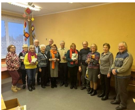
Naudītes bibliotēkā Lasītāju klubiņā tikšanās ar Gunti Birkmani.