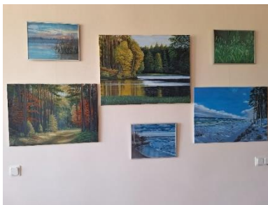
Bukaišu bibliotēkā Bukaišnieka Māra Berlanda gleznu izstāde.