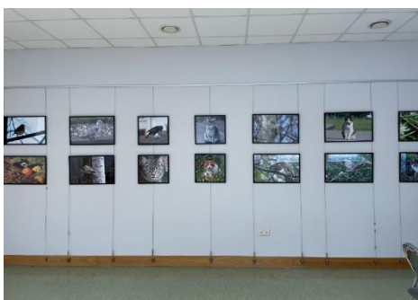
DNCB Auceniēka Ulda Jeskes fotoizstāde "Kaķi un putni".