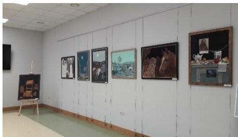
DNCB Jāņa Anmaņa gleznu izstādē “Māksla liek domāt”, veltījums Dobeles770 jubilejai.