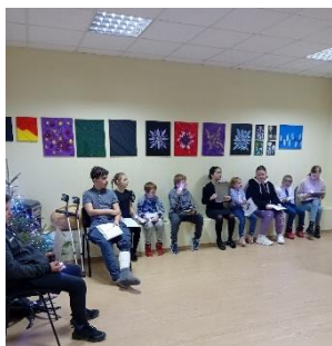
Īles bibliotēkā Ziemassvētku pasākums kopā ar “Spridzeklīšiem”.