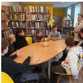
Penkules bibliotēkā Karjeras nedēļa bibliotēkā.