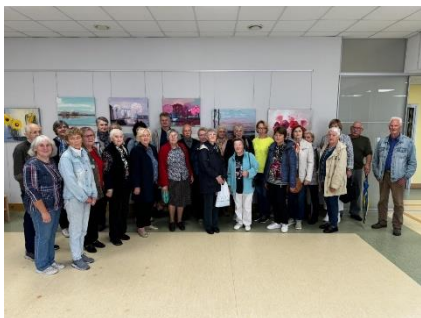
DNCB pieredzes apmaiņā, viesojas Ikšķiles bibliotēkas lasītāju klubs.