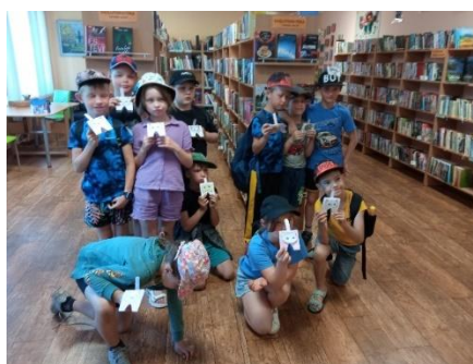
Annenieku bibliotēkā Blīdenes pamatskolas 2.klase bērni bibliotekārajā stundā.