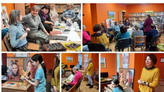
Auces pilsētas bibliotēkā Sarunu pēcpusdiena par hobijiem.