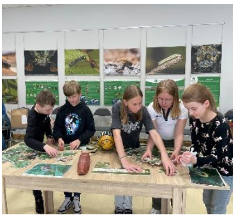
DNCB Atraktīva nodarbību bērniem “Skaistie un bīstamie augu kaitnieki”.