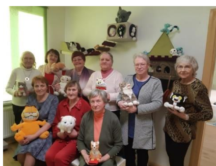
Annenieku bibliotēkā Tematiskā pēcpusdiena “Tiekamies Starptautiskajā Murrātāju dienā”.