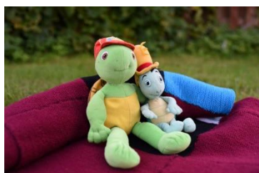
Auces pilsētas bibliotēkā Aucenieces Irisas Kurpnieces bruņurupuču kolekcijas izstāde “Stāsti, stāsti pasaciņu!”.