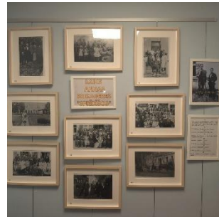
Bites bibliotēkā Kārļa Buivida fotogrāfiju izstāde.