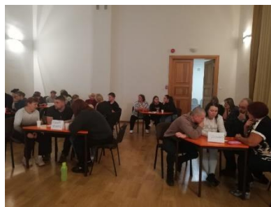
Krimūnu bibliotēkā Erudīcijas spēle "Gudrā pūce".