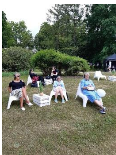
DNCB Dobeles pilsētas svētku ietvaros, lasītava "Klusie stāsti".