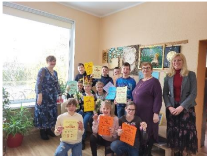
Bikstu bibliotēkā Nacionālās skaļās lasīšanas sacensības 1.kārta, kur piedalījās Bikstu pamatskolas 5. klases skolēni.