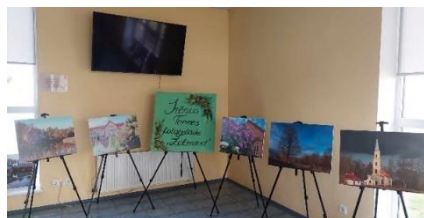
Šķībes bibliotēkā Irēnas Temnes fotoizstāde.