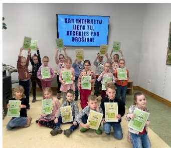
DNCB "Atceries par drošību" medijpratības nodarbība bērniem.