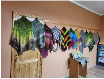
Bikstu bibliotēkā Vijas Spalvaines “Plecu lakatu izstāde”.