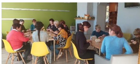
Penkules bibliotēkā Radošā darbnīca “Kaprona ziedu pasaule”.