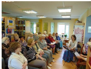
Bites bibliotēkā Pasākums “Baltā galdauta svētki” kopā ar folkloras kopu “Ceļtekas”.