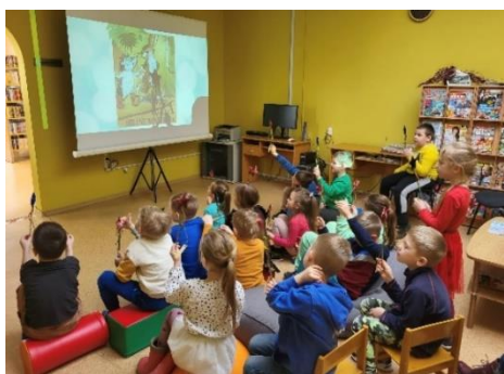
Naudītes bibliotēkā PII “Auriņš”-“Kastanītis un Riekstiņš” grupiņas bibliotekārajā stundā.