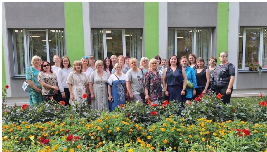
Gulbenes novada bibliotekāri pie Simalas pagasta bibliotēkas

Pārskata periodā bibliotēkas darbinieki devās pieredzes apmaiņas braucienā uz Preiļu galveno bibliotēku, Riebiņu un Simalas pagastu bibliotēkām. Ļoti iedvesmojoša bija tikšanās Preiļos, it īpaši saruna par darbu Ģimenes digitālo aktivitāšu centrā. Pārsteidza Riebiņu pagasta bibliotēkas telpu plašums un darbinieku skaits. Mūsu novada pagastu bibliotēkās ar līdzīgu darba slodzi strādā tikai viens bibliotekārais darbinieks.