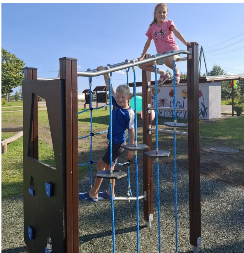
Bērnu rotaļlaukums pie Daukstu pagasta bibliotēkas

Gulbenes novada pašvaldības līdzdalības budžetēšanas projektu konkursā tika atbalstīts projekts “Bērnu rotaļlaukuma izveide un Daukstu pagasta bibliotēkas teritorijas labiekārtošana”, kura realizēšana notika 2024. gadā. Siltākajā laika posmā bibliotēkas āra lasītavā var ērti izmantot bezmaksas interneta pakalpojumus, izmantojot planšetdatoru, lasīt jaunākos preses izdevumus, spēlēt galda un lielformāta spēles.