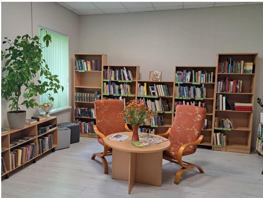
Telpa pēc remonta Kalnienas bibliotēkā

pārkrāsotas sienas, krāsns, durvis. Pozitīvi, ka radās iespēja saimniecisko stūrīti pārvietot uz citu telpu. Tagad šajā telpā ir iekārtota lasītava ar nozaru literatūras krājumu un novadpētniecības materiālu stūrītis. Tas radīja labākus apstākļus iedzīvotāju sanāksšanai, pasākumu rīkošanai.