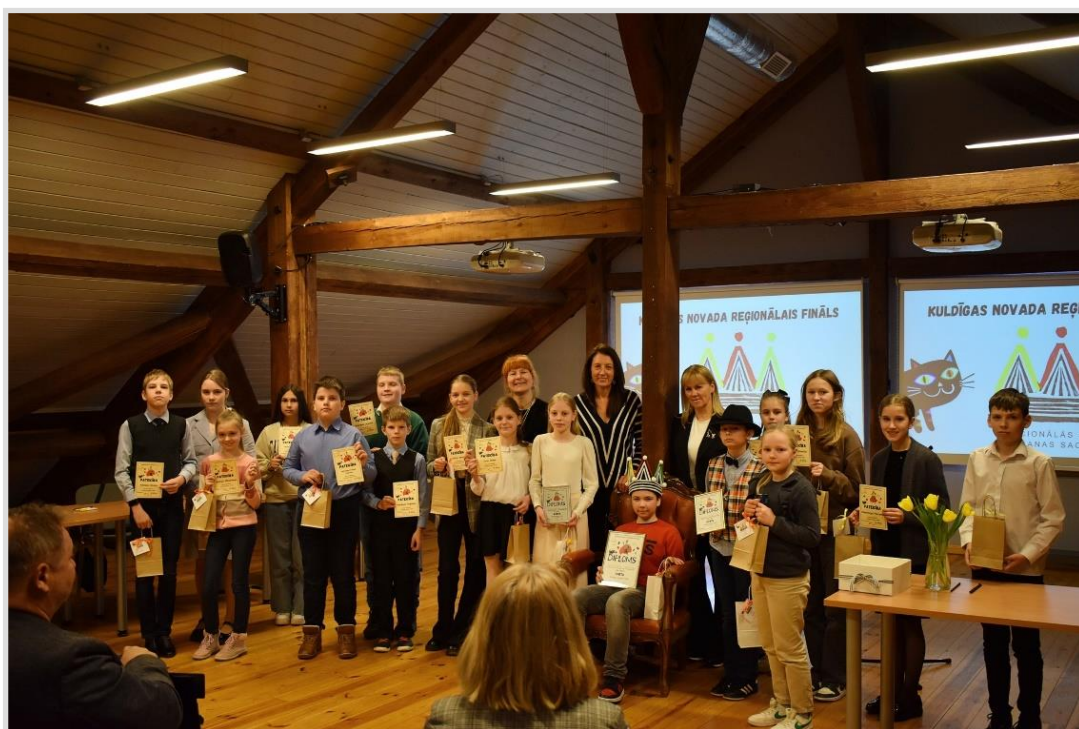
37. attēls. Skaļās lasīšanas sacensības fināls Kuldīgas Mākslas Namā.

Kuldīgas novadā reģionālajā finālā piedalījās 17 dalībnieki no Kuldīgas pilsētas, Skrundas pilsētas un novada skolām. Pēc tam notika Kurzemes Skaļās lasīšanas pusfināls Ventspils Pārventas bibliotēkā, kur tika izvēlēti trīs kandidāti, kuri devās uz Nacionālo