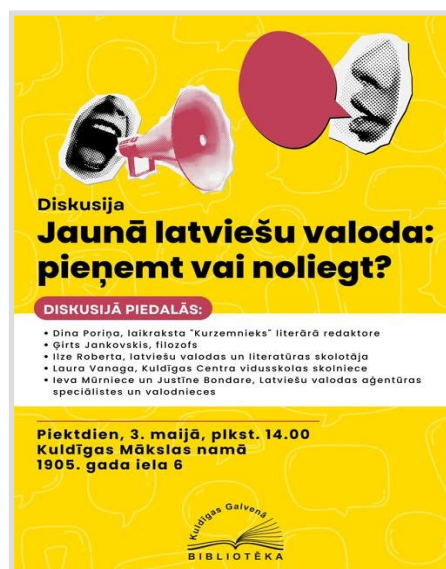
14. attēls. Diskusijas par pārmaiņām latviešu valodā plakāts ar ekspertu

jautājumiem, pārtapa par unikālu galda/sarunu spēli. Spēlējot šo citātu spēli, būs iespēja veicināt atvērtāku diskusiju starp dažādiem kopienu pārstāvjiem, skolās, darba kolektīvos un citur. Notika arī diskusija “Jaunā latviešu valoda: pieņemt vai noliegt?”, uz kuru tika uzaicināti seši eksperti, bet sarunā aktīvi iesaistījās arī auditorija, pasākums bija viens no apmeklētākajiem 2024. gadā. Uz tās organizēšanu rosināja sabiedrībā plaši izplatītā tendence latviešu sarunvalodā aizvien vairāk iekļaut angliskotus latviešu valodas vārdus vai pat aizstāt latviešu valodas vārdus ar angļu valodas vārdiem, piemēram “mačot” 1 , “outfits” 2 , “red flag” 3 un citi.