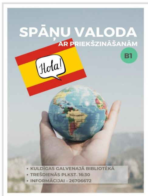
18. attēls. Spāņu valodas klubiņa plakāts