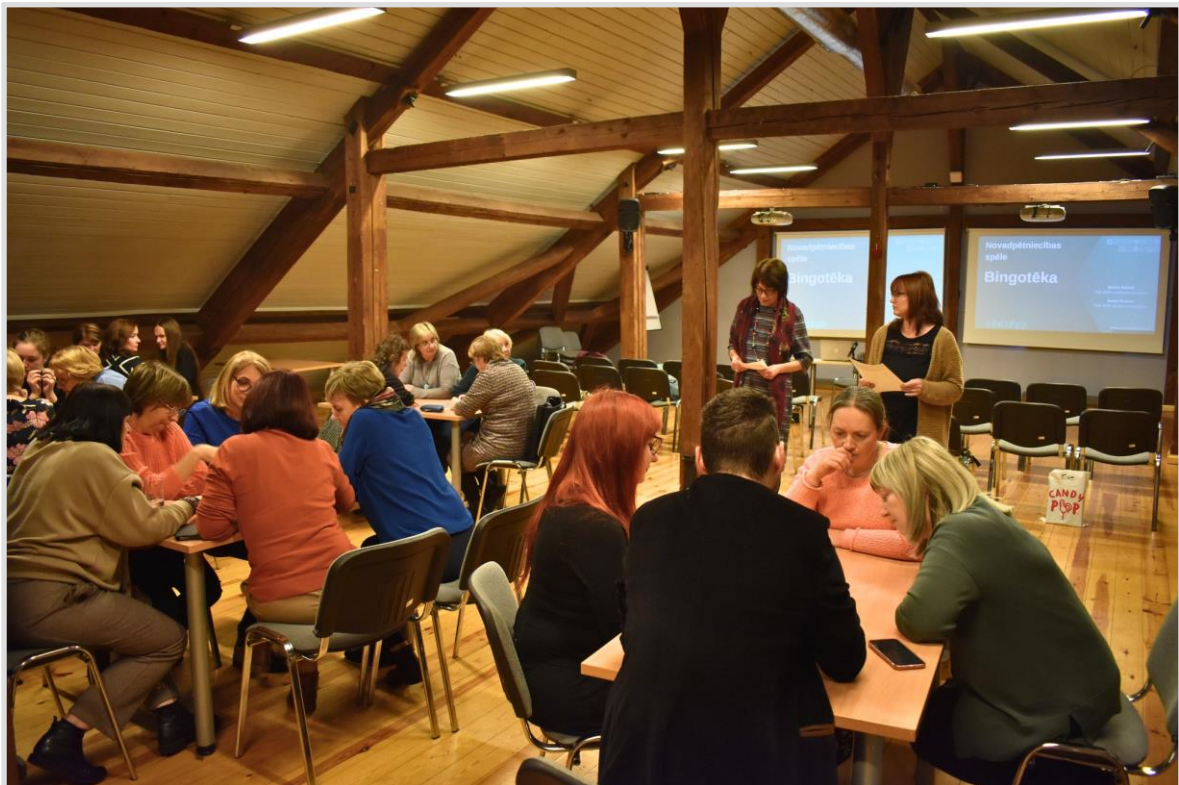
49. attēls. Kuldīgas novada bibliotakāri spēlē "Bingotēku."

Novembra seminārs Kuldīgas Galvenajā bibliotēkā jau tradicionāli saistīts ar novadpētniecību, kad tiek prezentētas novadā izveidotās virtuālās izstādes un apbalvoti šo