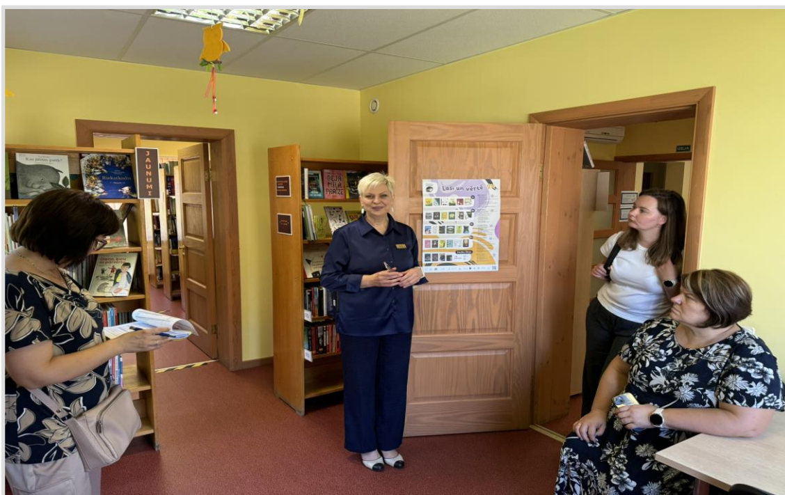
47. attēls. Akreditācija Turlavas pagasta bibliotēkā.

2024. gada prioritāte Kuldīgas Galvenās bibliotēkas metodiskajā darbā bija sagatavot un savlaicīgi iesniegt dokumentāciju novada vietējas nozīmes bibliotēku akreditācijai un palīdzēt bibliotēkām sagatavoties šim procesam. Pārskata periodā apmeklētas visas novada vietējas nozīmes publiskās bibliotēkas, dažas pat vairākas reizes,