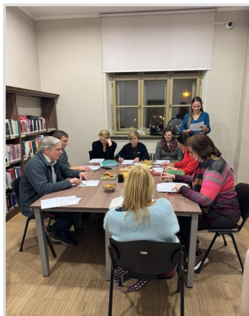
19. attēls. Skats no spāņu valodas nodarbības Klusajā Lasītavā

2024. gada rudenī tika atjaunota bibliotēkas “ Valodu kafejnīca ”, kurā regulāri tikās spāņu valodas interesenti. Kopumā nodarbības apmeklējuši 128 cilvēki.