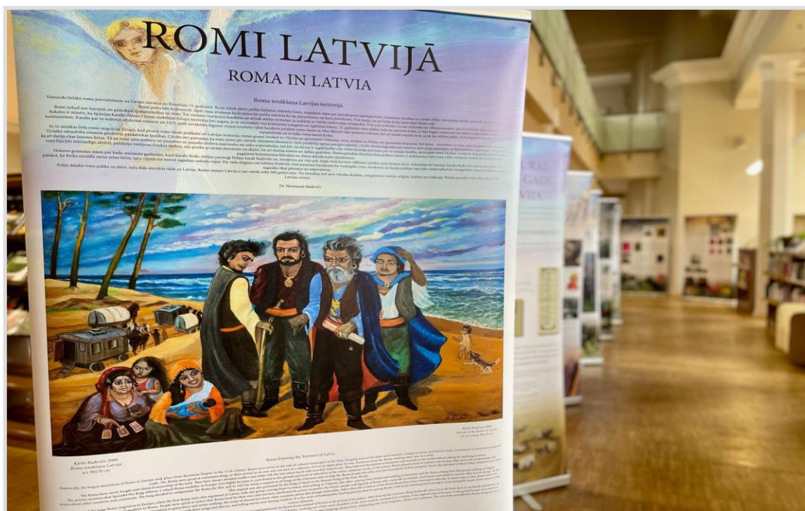
16. attēls. Skats no izstādes “Romi Latvijā”