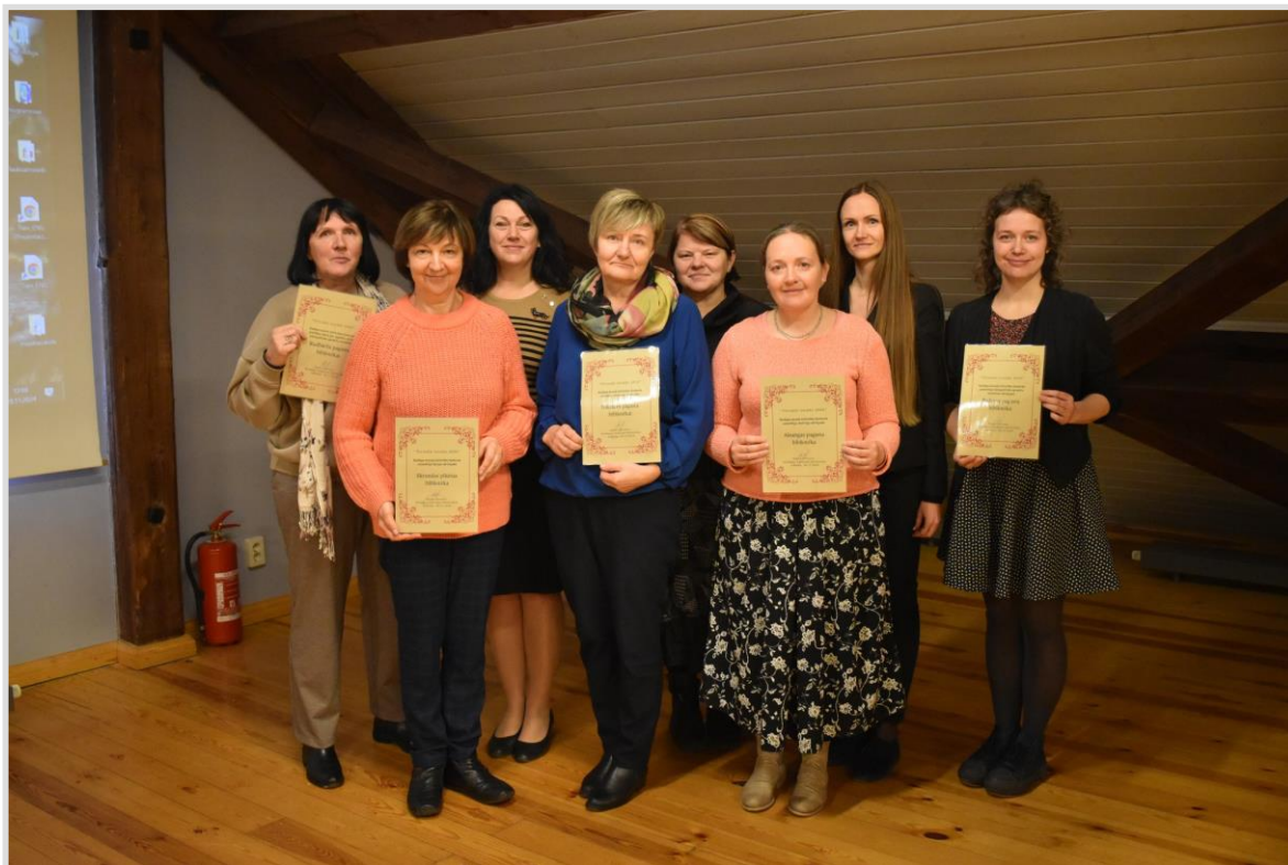
5. attēls. Virtuālo izstāžu konkursa uzvarētāju apbalvošana.

pagasta bibliotēka par bibliogrāfisko aprakstu kvalitāti, Skrundas pilsētas bibliotēka par