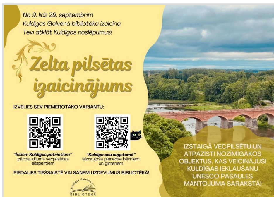
39. attēls. Zelta pilsētas izaicinājums.