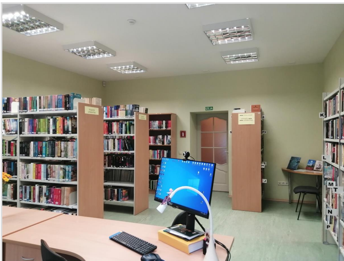
3. attēls. Snēpeles pagasta bibliotēkas abonements.

Snēpeles pagasta bibliotēkā izveidota telpa preses lasītavai un datorlietotājiem, ērts rotaļu stūrītis bērniem. Bibliotēkas lielākajā telpā izvietots krājums un bibliotekāra darba vieta.