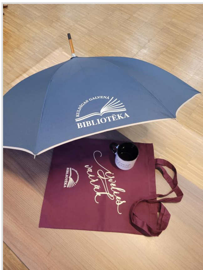
44. attēls. Suvenīri ar bibliotēkas logo.

TikTok platformā bibliotēka piedzīvoja ievērojamu 824% pieaugumu skatījumu skaitā. Šis pieaugums saistāms ar jauniem video formātiem, kas bija īpaši pievilcīgi lietotājiem. Populārs kļuva novadpētniecības materiālu apskats, kas iepazīstināja skatītājus ar bibliotēkā pieejamajiem vēstures