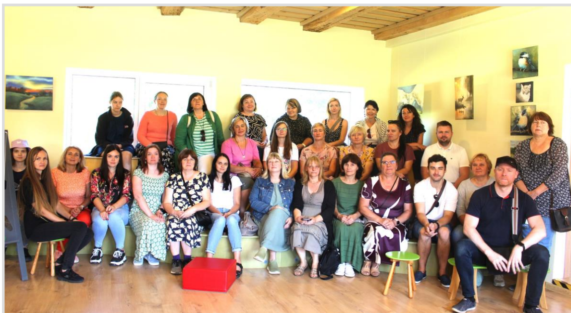
50. attēls. Kuldīgas novada bibliotekāri Tukuma novada Jaunpils bibliotēkā.

2024. gadā Kuldīgas novada bibliotekāri apmeklēja divas Latvijas Nacionālās bibliotēkas Atbalsta biedrības ilgtermiņa projekta “Iedvesmas bibliotēka” atbalstītās bibliotēkas Tukuma Novadā – Pūres bibliotēku un Jaunpils pagasta bibliotēku.