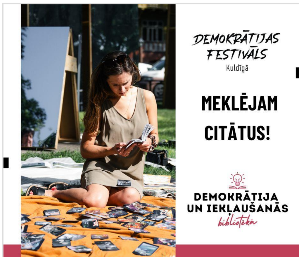
8. attēls. Iedzīvotāji tika aicināti piedalīties arī projekta “Demokrātija&Iekļaušanās bibliotēkā” citātu spēles veidošanā.

Kuldīgas Galvenajā bibliotēkā visaptveroša sabiedrības un bibliotēkas lietotāju aptauja pārskata periodā nav veikta, taču veikta aptauja, lai īstenotu starptautiskās