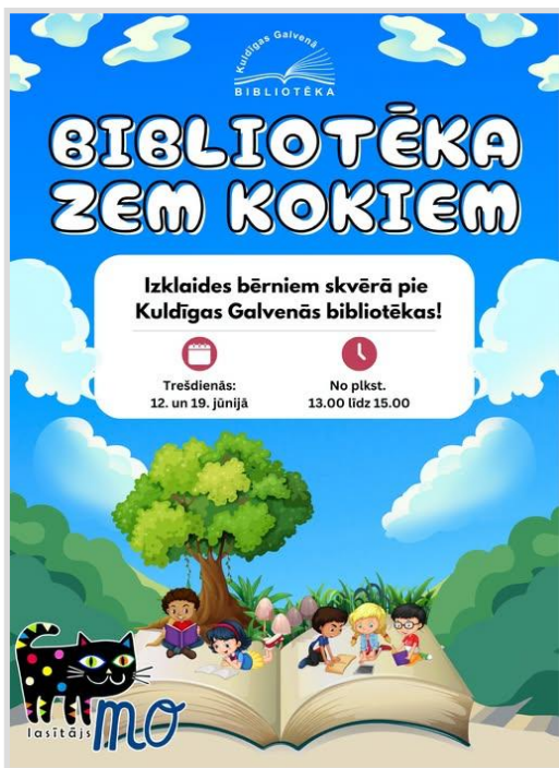
34. attēls. "Bibliotēka zem kokiem" publicitātes plakāts.