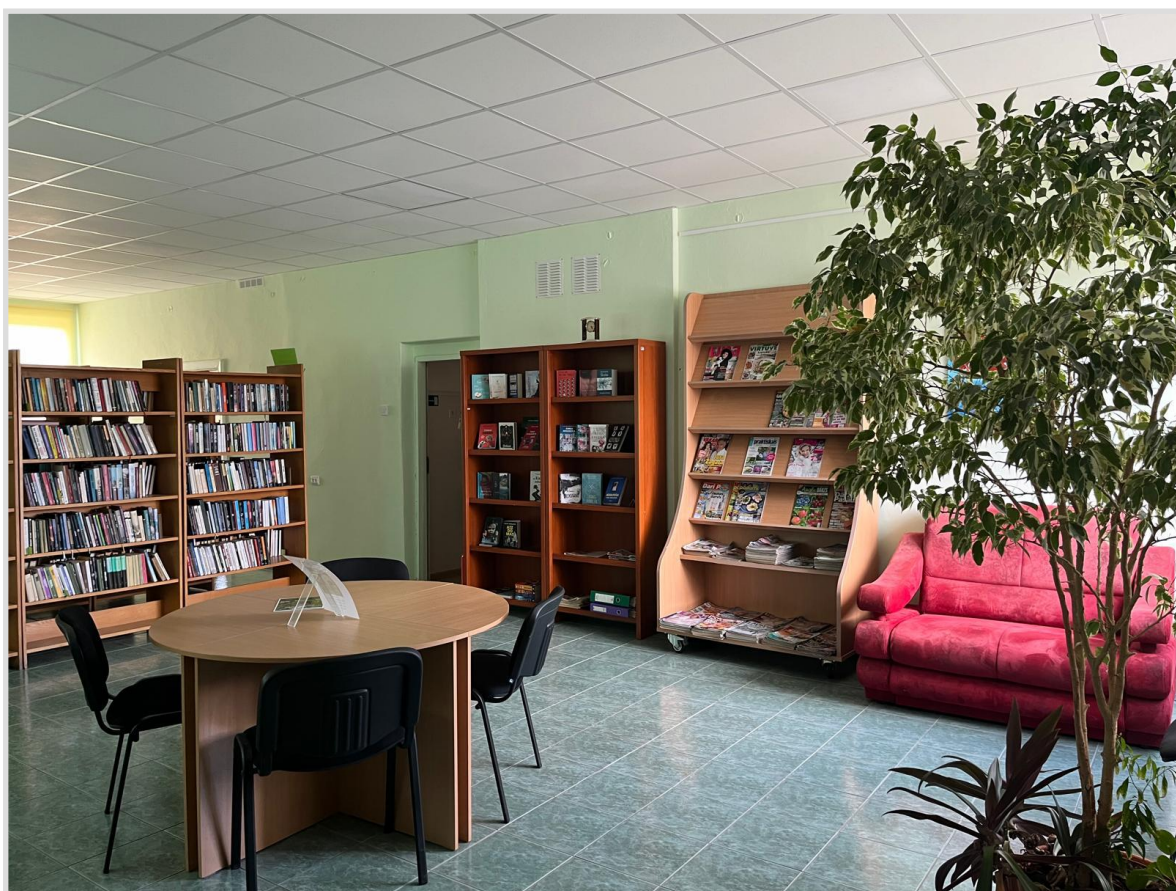
2. attēls. Alsungas pagasta bibliotēka pēc pārmaiņām.

Alsungas pagasta bibliotēkā uz atsevišķu telpu pārvietota izdevumu izsniegšanas un saņemšanas vieta, lai uzlabotu klimatiskos apstākļus bibliotēkām, jo pirms tam bibliotēkāra darba vieta atradās dienvidu pusē, kur paaugstinoties gaisa temperatūrai laukā, telpās tā sasniedza +32 grādus. Pārkārtojot plauktus, tika atbrīvota vieta bibliotēkas pasākumiem, un kārtojot krājumu, tulkotā daiļliteratūra sakārtota vienotā alfabētā, bet nozaru literatūra - secīgi UDK sistēmā. Kārtojot krājumu, tika atlasītas nolietotās grāmatas un dubleti. Mēbeļu izvietojums tika mainīts arī pārējās bibliotēkas zonās.