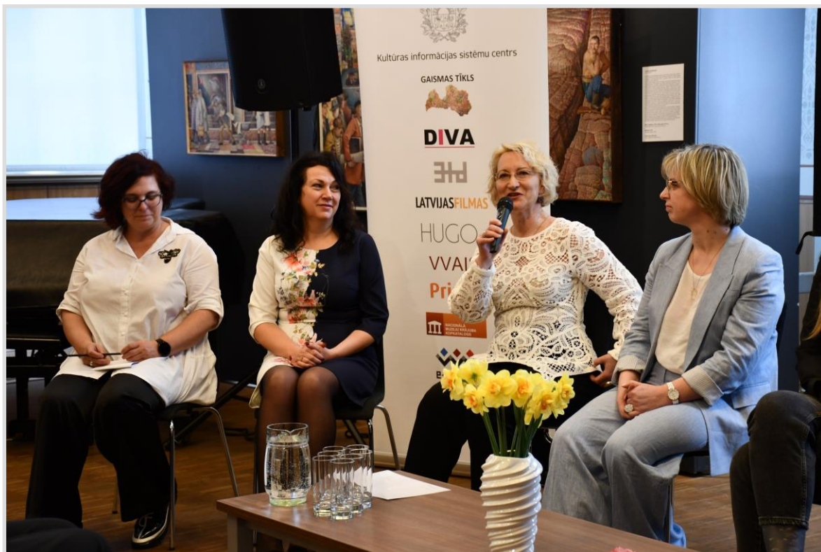
6. attēls. Skats no 3td e-grāmatu bibliotēkas 5 gadu jubilejas pasākumam veltītās diskusijas.