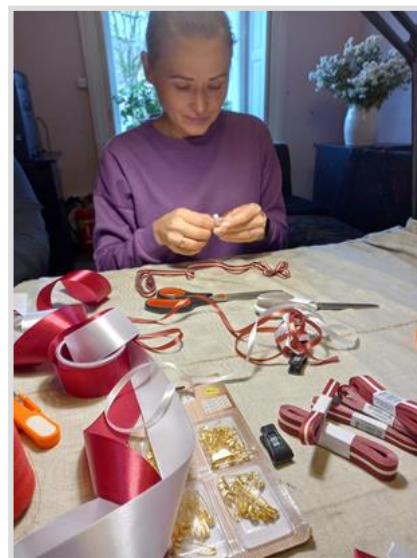
21. attēls. Valsts svētku lentīšu pagatavošanas nodarbības Īvandes pagasta bibliotēkā.

Pagastu publiskajās bibliotēkās vietējo iedzīvotāju atsaucību gūst dažādas radošās nodarbības, kur var satikties, parunāt un izgatavot kaut ko līdzīgu paņemamu. Piemēram, Īvandes pagasta bibliotēkā notika nodarbība "Nāc pagatavot savu svētku piespraudi", jo Latvijas dzimšanas diena ir katram Latvijas iedzīvotājam nozīmīga svētku diena un to vēl īpašāku var darīt rotas Latvijas karoga krāsās. Savukārt decembrī notika radošā darbnīca "Mīļietīņa Ziemassvētku eglītei", kur gan pieaugušie, gan bērni no filca auduma gatavoja eglītē karināmu mantiņu.