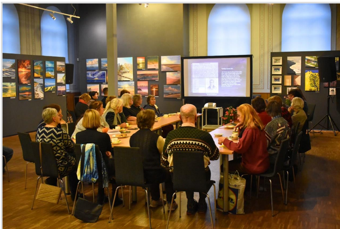
38. attēls. Atmiņu pēcpusdiena par seno Kuldīgas ķieģeļu tiltu.

Ņemot vērā to, ka 2023. gada 17. septembrī Kuldīgas vecpilsēta iekļauta UNESCO Pasaules mantojuma sarakstā, Kuldīgas novada pašvaldība septembri turpmāk noteikusi par