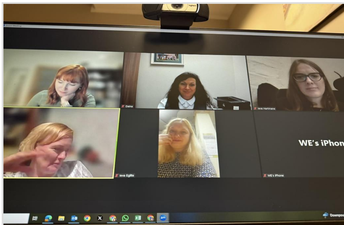
28. attēls. skats no kārtējā diskusiju vakara platformā Zoom.