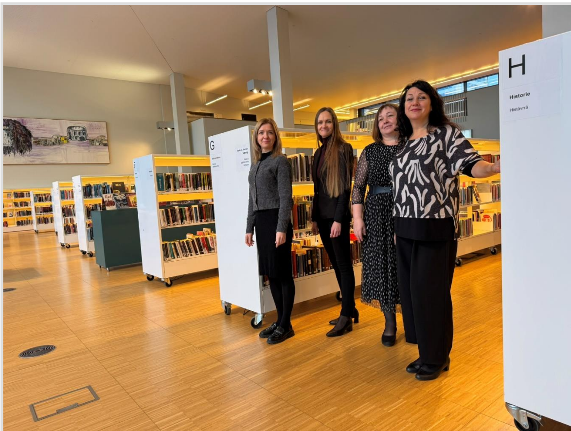
46. attēls. Kuldīgas novada bibliotekāri viesojas Norvēģijā Stormen bibliotēkā.

Kuldīgas novada Skrundas pilsētas un pagastu publisko bibliotēku sadarbības partneri novadpētniecības jomā ir Kuldīgas novada muzejs, kas palīdz izpētes procesā un