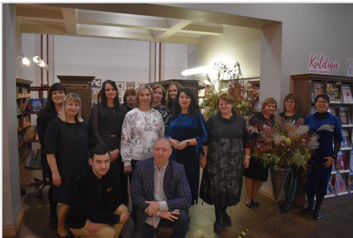
4. attēls. Kuldīgas Galvenās bibliotēkas kolektīvs bibliotēkas 104. dzimšanas dienā 2024. gada 11. decembrī.

Noslēdzot 2024. gadu, Kuldīgas Galvenajā bibliotēkā strādāja 20 darbinieki, no kuriem 15 ir bibliotekārie darbinieki . Ir vairāki tehniskie darbinieki, kuru pienākumos ietilpst ne vien bibliotēkas, bet arī Kuldīgas Mākslas nama, kurš ietilpst bibliotēkas ēku