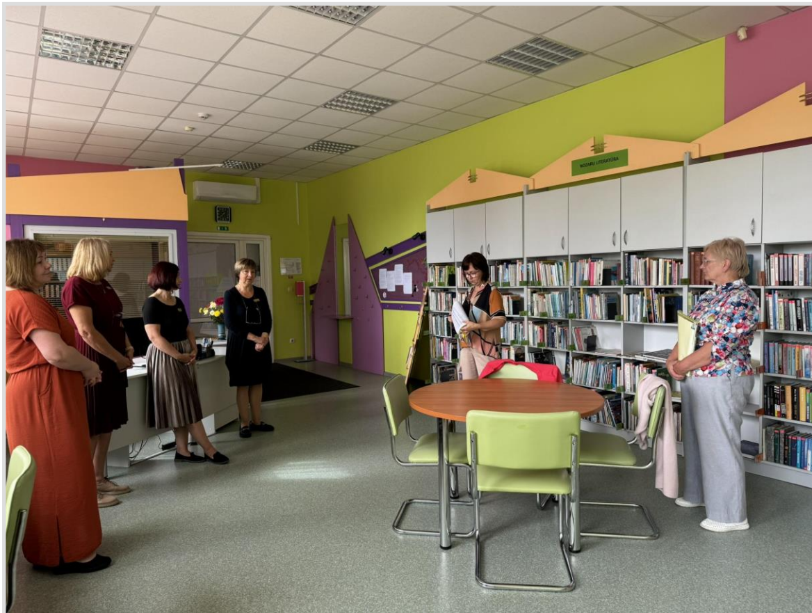
1.attēls. Atkārtota akreditācija Skrundas pilsētas bibliotēkā.