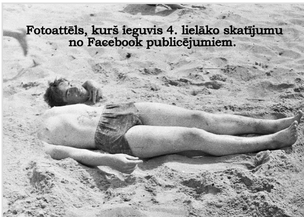
45. attēls. Rudbāržu pagasta bibliotēkas krājuma fotogrāfija "Vidusskolēni smiltīs".