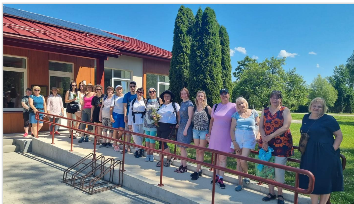
51. attēls. Kuldīgas novada bibliotekāri pie Rumbas pagasta bibliotēkas.