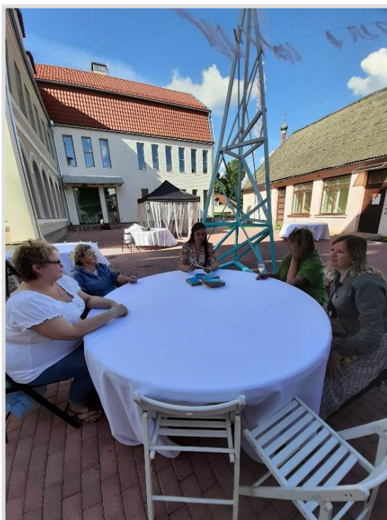
10. attēls. Citātu spēle pirmo reizi tika izspēlēta ikgadējā Kuldīgas Demokrātijas festivālā.

Pārskata periodā Kuldīgas Galvenajā bibliotēkā aktīvi interesentiem tikusi piedāvāta Klusā lasītava, kas 2024. gadā rezervēta 103 reizes . Šo iespēju labprāt izmanto uzņēmēji, pieslēdzoties tiešsaistes pasākumiem, skolotāji individuālajām nodarbībām, spāņu valodas klubiņš, garīgo meklējumu klubs “Dzīves atslēgas” un citas interešu grupas.