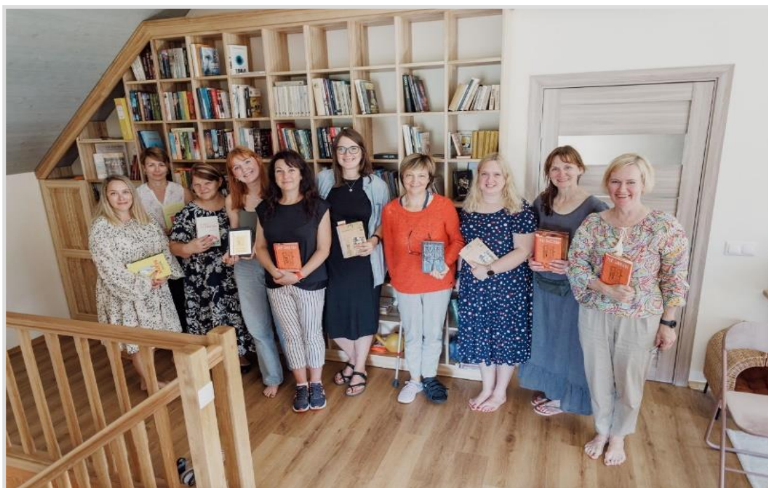
27. attēls. Tiešsaistes literatūras diskusiju kluba PLAUKTS klātienēs tikšanās vasarā kluba dalībnieces mājās Kurmāles pagasta “Pūcēs”

Aktīvi darbojies Mārītes Milzeres vadītais “ Lasītāju klubiņš ”, ko apmeklējuši 126 dalībnieki, bet Martas Pujātes vadīto tiešsaistes literāro diskusiju klubu “ Plaukts ” - 122 klausītāji.