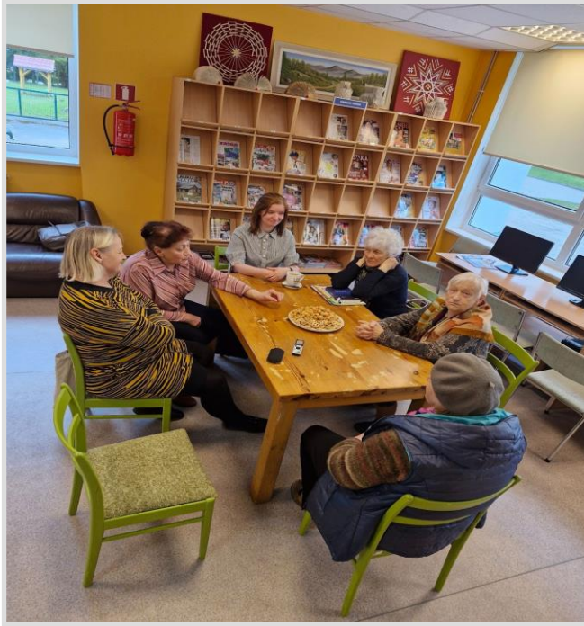
43. attēls. Stāstu vakars Vārmes pagasta bibliotēkā.

Laikraksta Kurzemnieks (Nr. 93 (2024, 22. novembris), 5. lpp.) raksā “Digitālās izstādes saglabā mantojumu” tika raksturots Padures pagasta bibliotēkas darbs novadpētniecībā, aicinot iedzīvotājus dalīties ar senām un ne tik senām fotogrāfijām, tādējādi saglabājot lokālās kultūras mantojumu.