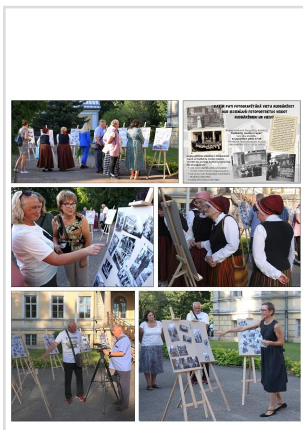
41. attēls. Rudbāržu pagasta bibliotēkas organizētās brīvdabas izstādes “Pils trepes” atklāšana.