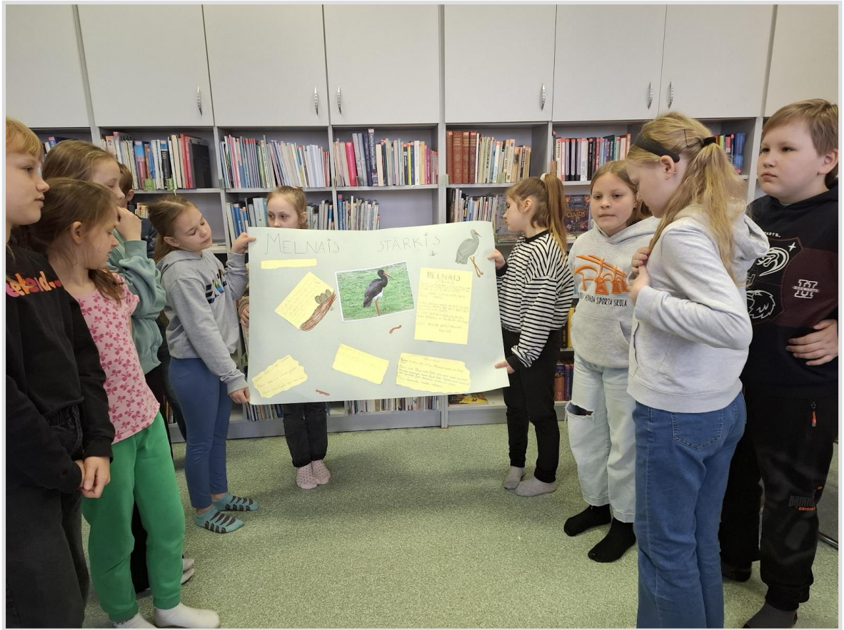
35. attēls. Informācijas meklēšanas stunda Skrundas pamatskolas 4. klases skolēniem.

Informāciju tika meklēta enciklopēdijās, vārdnīcās un datu bāzē Letonika .