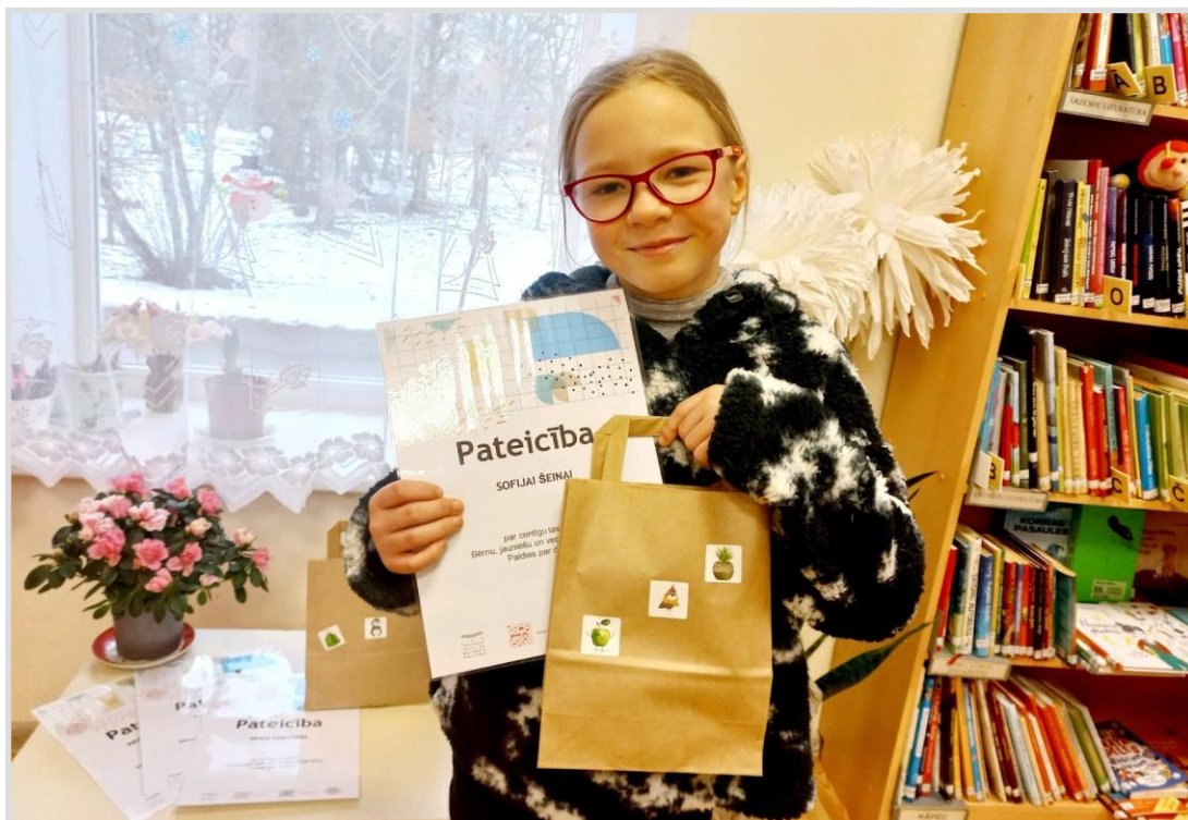
36. attēls. Laidu pagasta bibliotēkas BJVŽ dalībniece ar dāvanu.

sacensības . Konkurss norisinājās trīs posmos: sacensības skolā vai vietējā bibliotēkā, reģionālais fināls un valsts fināls Latvijas Nacionālajā bibliotēkā. Šajā gadā tika mainīta kārtība, kā skolēni tiek izvirzīti uz Nacionālo Skaļās lasīšanas sacensību finālu.