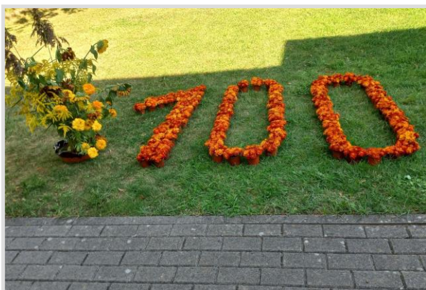
22. attēls. Ziedu izstāde "Laidu pagasta bibliotēkai - 100"

1. septembrī pie Laidu pagasta bibliotēkas bija skatāma interešu kluba "Dzīvot Laidos" dalībnieku veidotā ziedu izstāde godinot Laidu bibliotēkas 100. gadadienu. Izstādes veidotāji no samteņu podiņiem izveidoja skaitli 100, bet decembrī Laidu bibliotēkā notika radošā sniegpārslīņu darbnīca, kuru vadīja Laidu iedzīvotāja Sanita Osmolovska. Nodarbībā izgatavotās