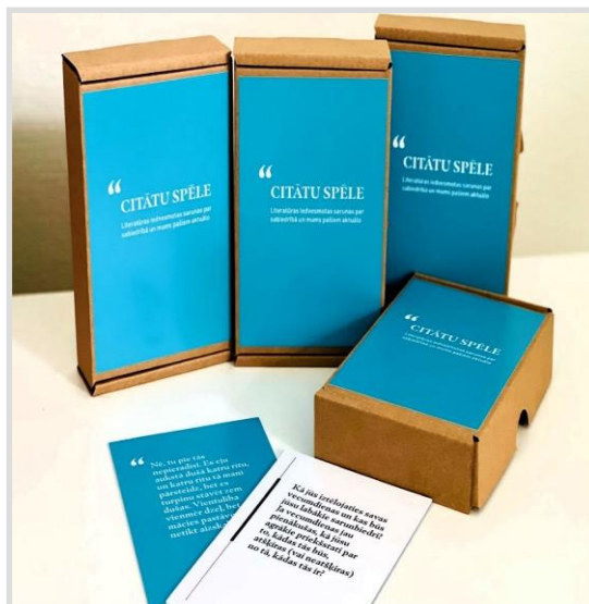
11. attēls. Citātu spēle "Literatūras iedvesmotas sarunas par sabiedrībā un mums pašiem aktuālo".

Domāt par sabiedrībai aktuāliem tematiem rosinājuši starptautiskā EUROPE CHALLENGE projekta "Demokrātija un iekļaušanās bibliotēkā" pasākumi, ko vadīja dažādi eksperti. Šajos pasākumos vietējās kopienas cilvēki piedalījās diskusijās "Vai vientulība ir mūsdienu sabiedrības plāns?"