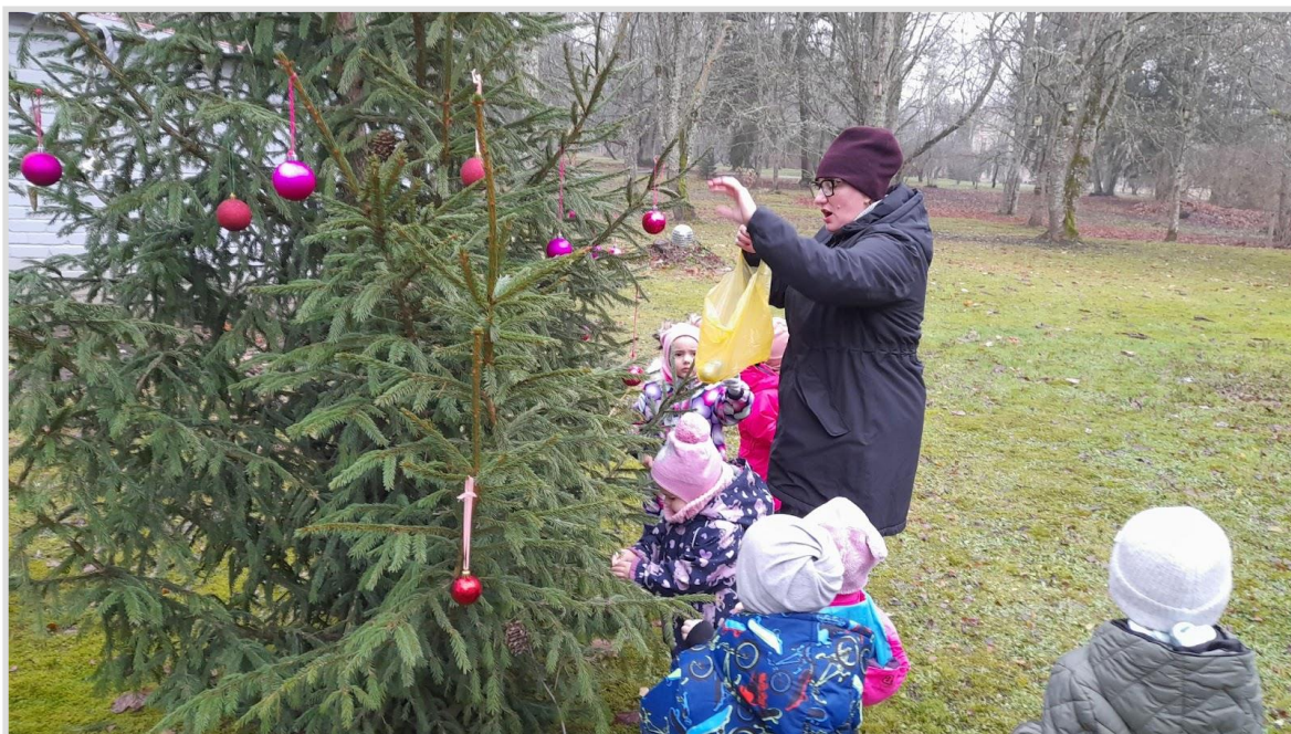
24. attēls. Kopīga eglītes rotāšana pie Vārmes pagasta bibliotēkas.

Īpaša saikne ar vietējo kopienu izveidojusies Vārmes pagasta bibliotēkai . Decembrī kopīgi tika rotāta eglīte pie bibliotēkas, kur katrs varēja ielikt savu mantiņu,