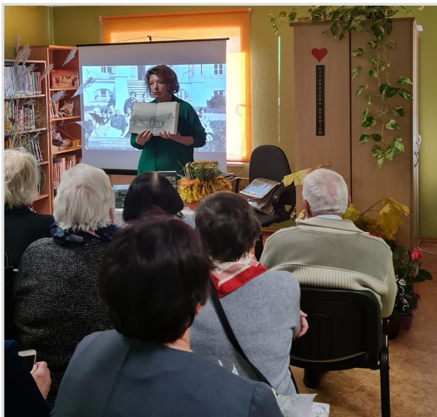
42. attēls. Grāmatas “Padures mozaīka - vēsture uz paša ādas” atklāšana Padures pagasta bibliotēkā.