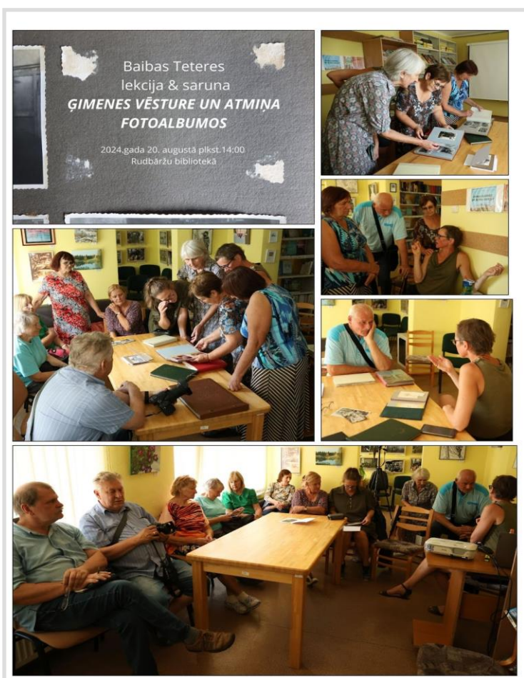
40. attēls. Lekcija un saruna un lekcija “Ģimenes vēsture un atmiņa fotoalbumos” Rudbāržu pagasta bibliotēkā.

Nozīmīgs darbs lokālās kultūrvides dokumentu krājuma papildināšanā pārskata periodā veikts Rudbāržu pagasta bibliotēkā . Vērtība un ieguvums bija Kuldīgas novada