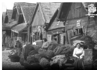
Redzi, dzirdi Latviju