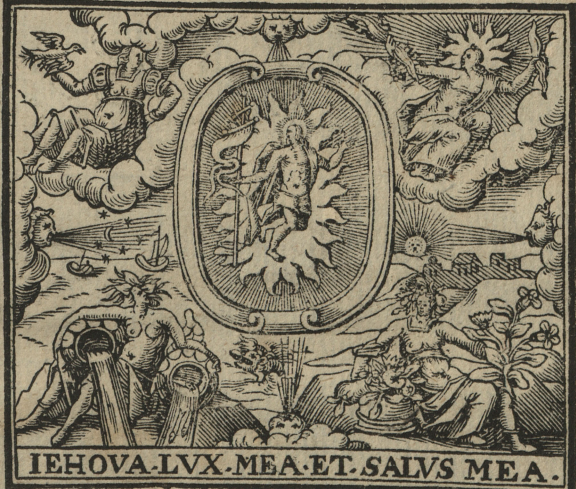
IEHOVA. LVX. MEA. ET. SALVS MEA.

Gehalten in Volekreicher versamb- lung / vnd vielen Frommen Christen zum vnerri- che In Truck verfertiget durch M. Hermannum Samsonium Pastorem der Kirchen Gottes in Riga / vnd der Schulen Inspectorem.