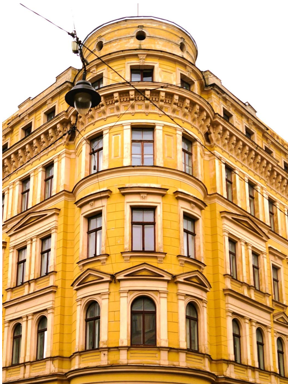
Nams Antonijas un Andreja Pumpura ielas krustojumā, Rīgā