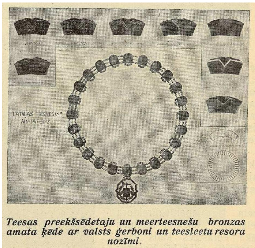
Tiesas amata tērpu piederumu 1922. gada projekts Ilustrētais Žurnāls , Nr. 11, 1922, 30. oktobris, 4. lpp.