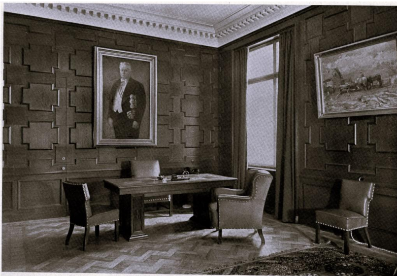
Tiesu pils Rīgā