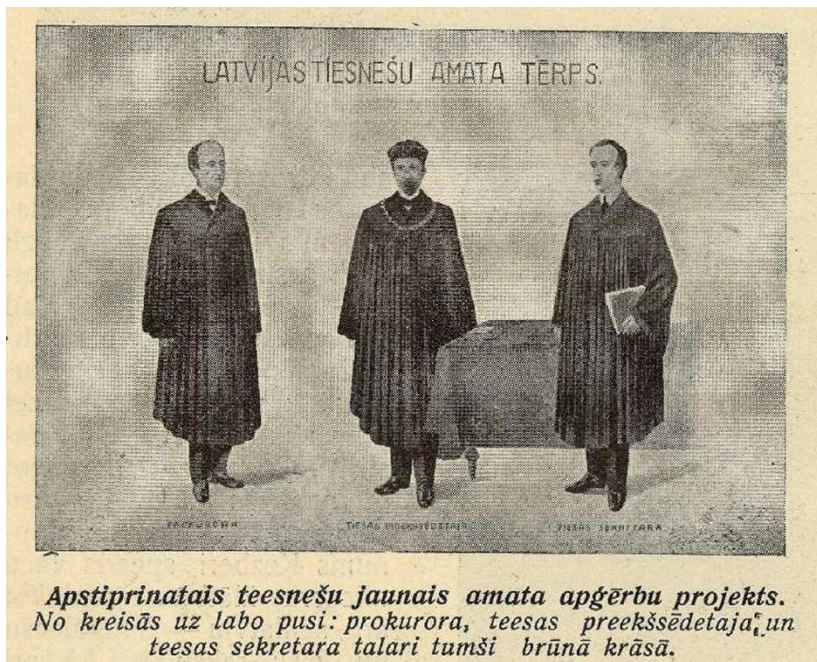
Tiesas amatu tērpu 1922. gada projekts Ilustrētais Žurnāls , Nr. 11, 1922, 30. oktobris, 4. lpp.