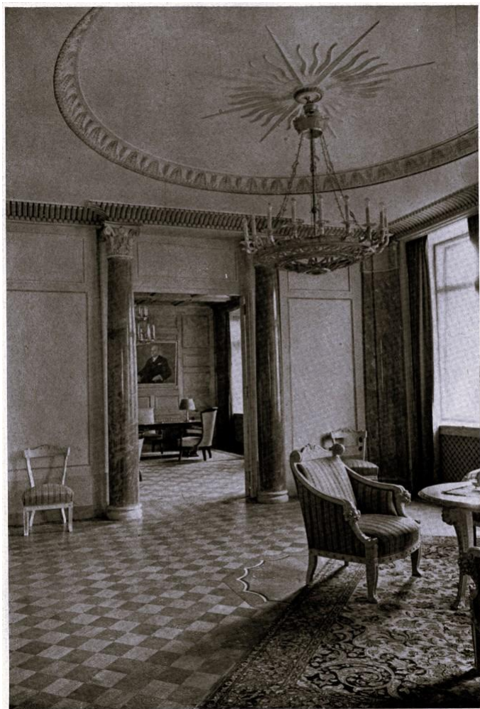
Tiesu pils Rīgā