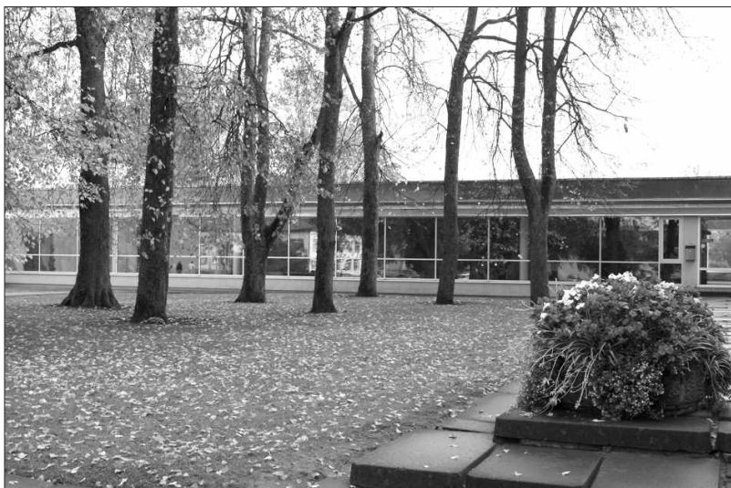
Talsu novada pašvaldības ēka.