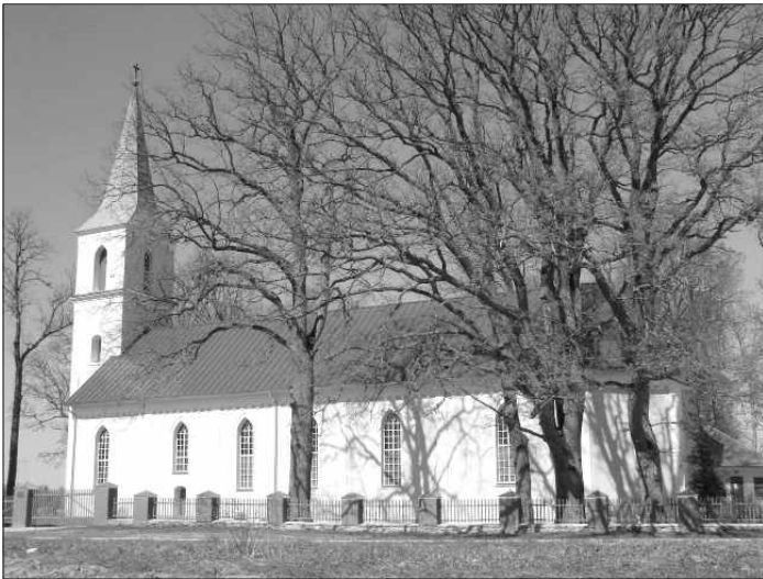
Ārlavas luterāņu baznīca.