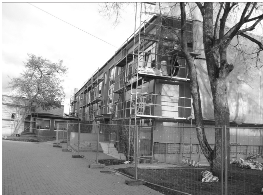
Pirmsskolas izglītības iestādē „Zvaniņš” tāpat kā vēl trīs Talsu pirmsskolas izglītības iestādēs sācies ļoti gaidītais remonts.

„Tāds ir arī šī koncerta virsuzdevums, lai mēs pēc iespējas vairāki un kopīgi sajustu, ka esam PAR Talsu novadu, PAR ļaudīm, zemi un laiku, kas mums dots” – 18. lpp.